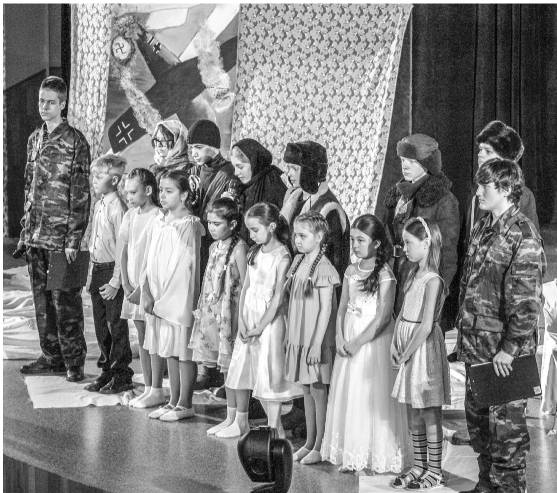
■ Постановка «Я еще не хочу умирать» - трогательное изображение жизни людей в годы войны

Трагизмом пропитан весь спектакль от начала и до конца. Начиная с реальных цифр, которые зачитывали зрителям, уже это вызывало дрожь по телу. Еще трагичнее все было, когда становилось известно о чьей-либо гибели. В блокадном Ленинграде жителям выдавали карточки на хлеб. По сюжету главная героиня Таня на улице находит хлебные карточки – в то время они дороже любых драгоценностей. Девочка прячет их к себе в сумку. А потом встречает друга Юрку, у которого работает одна мама и хлеба в доме очень не хватает. Вскоре от голода умирает его мама, и девочка отдает ему все карточки. «Ты хоть понимаешь, что это не просто карточки – это целый месяц жизни