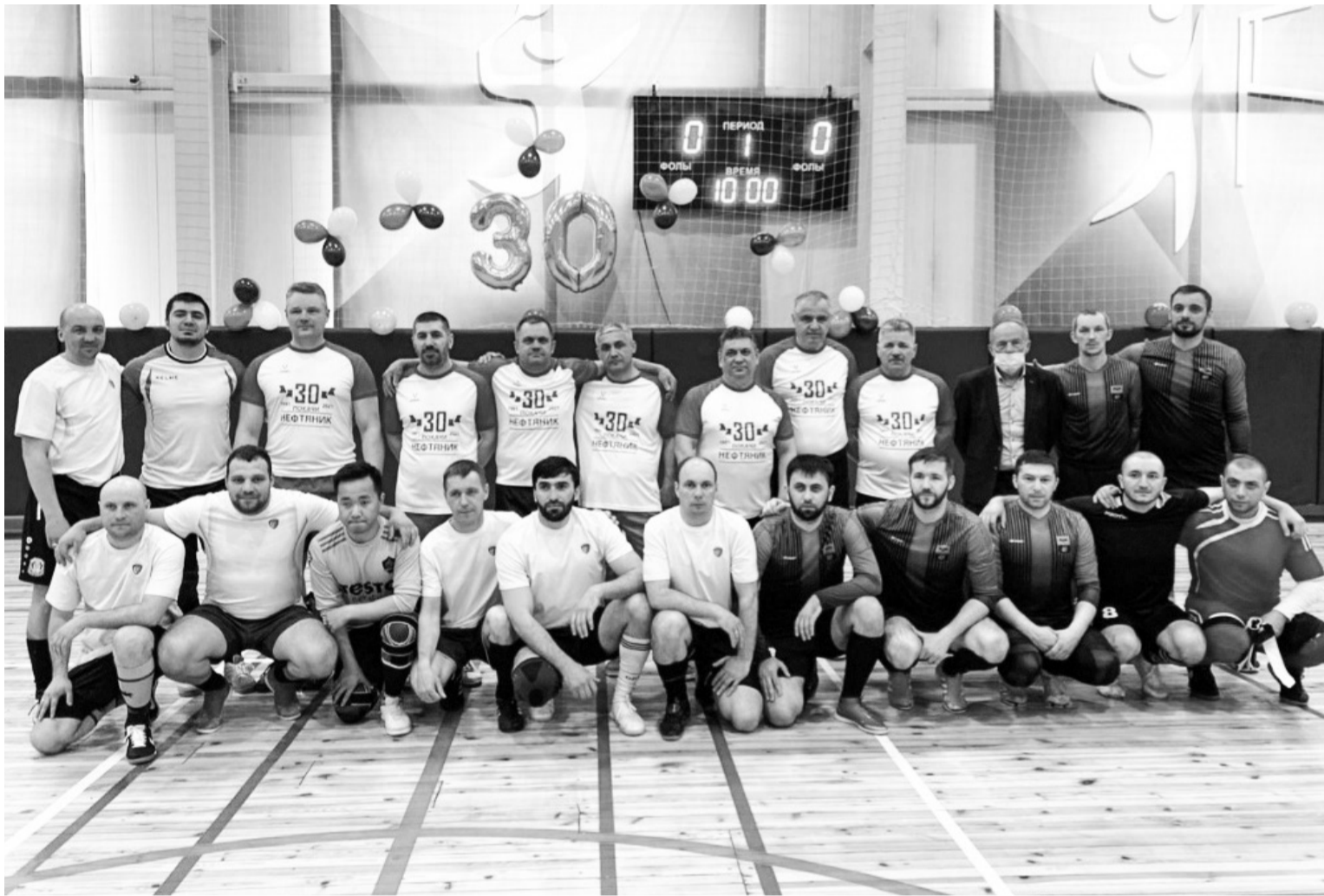
📷 Несколько поколений, влюбленных в футбол, на одной фотографии. Не любить футбол – нельзя. Он часть жизни этих спортивных ребят

Читайте новости в сетевом издании vgazetepv.ru и в наших группах соцсетей