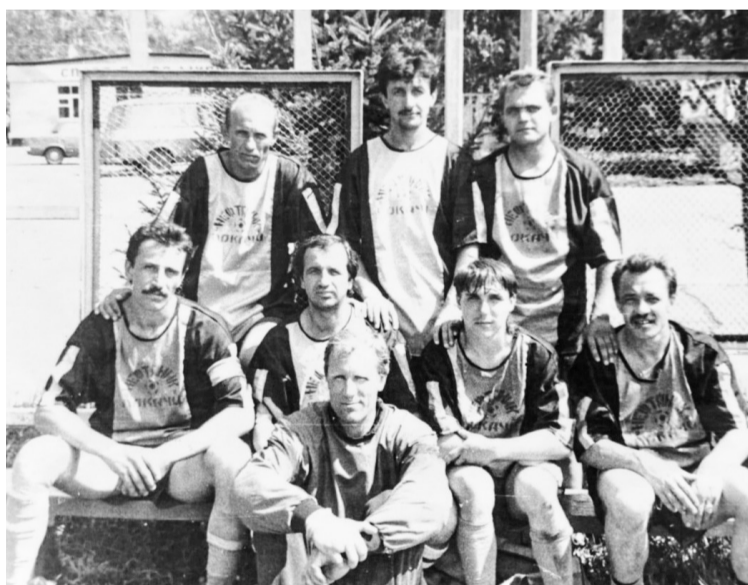
📷 Историческое фото. На нем изображены представители той самой команды, которая некогда дала старт покачевскому футболу

Нынешнему составу команды тоже есть чем гордиться. Футболисты принимали участие в Кубке губернатора Тюменской области 2016-2017 г., а также стали обладателями серебряных медалей чемпионата