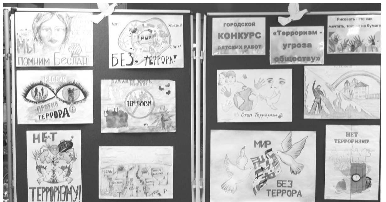
В администрации города Покачи была организована выставка детских работ «Мир без террора»