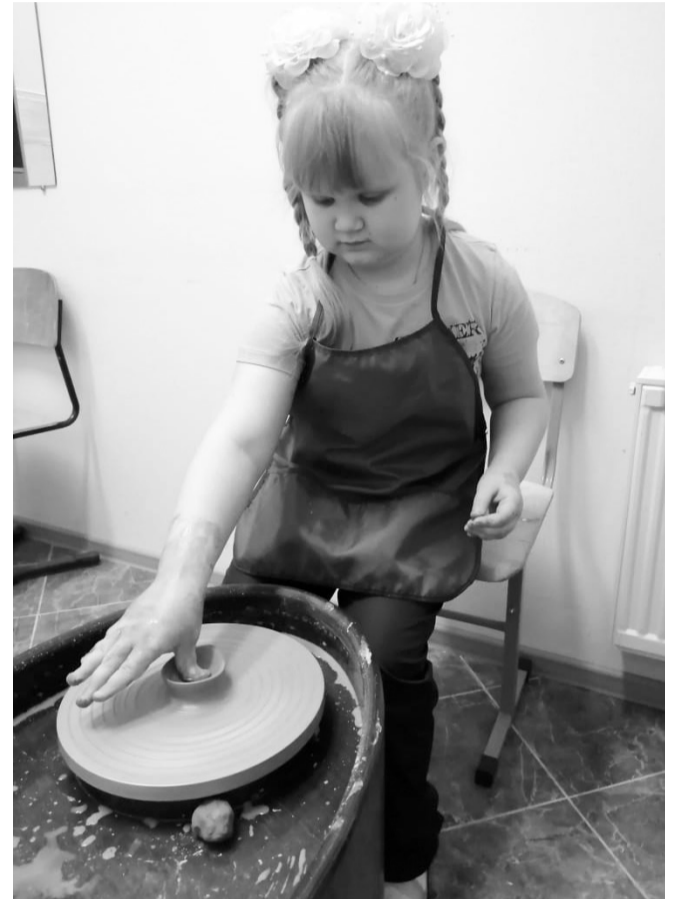
В ходе проведенных мастер-классов к творческой деятельности было привлечено 150 школьников и 100 воспитанников детских садов

В ходе проведенных мастер-классов к творческой деятельности было привлечено 150 обучающихся школ и 100 воспитанников дошкольных образовательных учреждений города. Во всех проведенных мероприятиях юные покачевцы участвовали с большим удовольствием. Кстати, гончарное