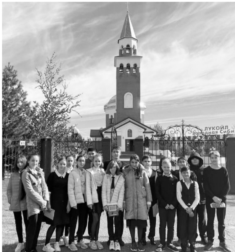
Приходу Храма Покрова Божией Матери г.Покачи, согласно паспорту антитеррористической безопасности, присвоена третья категория места массового пребывания людей

27 ноября в администрации города Покачи в онлайн-формате прошло очередное совместное заседание антитеррористической комиссии и оперативной группы города Покачи