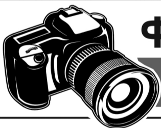
ФОТО на все виды документов

Управление жилищно-коммунального хозяйства администрации города Покачи