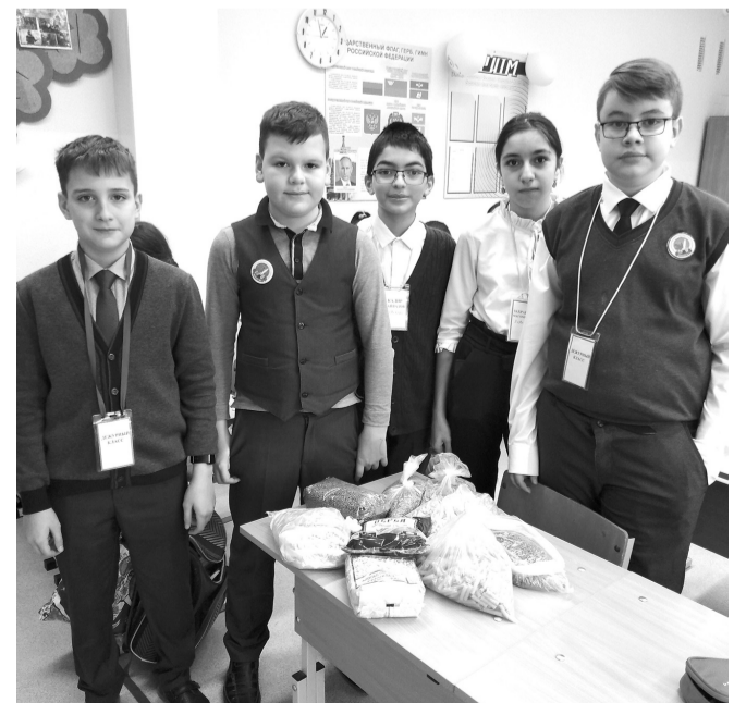
Ребята 5 А класса передали гостинец подопечным фонда