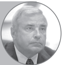
Юрий Вазенин, член Совета Федерации от Югры:

На развитие инфраструктуры в Югре работают семь национальных проектов, реализуются национальные цели развития. Так, в их рамках построено 82 километра дорог, еще 211 – отремонтировали. Повышается качество водоснабжения – сейчас реконструируются водоочистные сооружения в Пыть-Яхе и Лянторе. Строятся школы и детские сады. Регион избавляется от непригодного жилья.