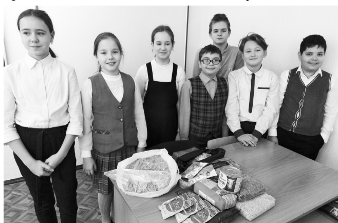
Ученики 5 Б класса - на пути к большому поступку