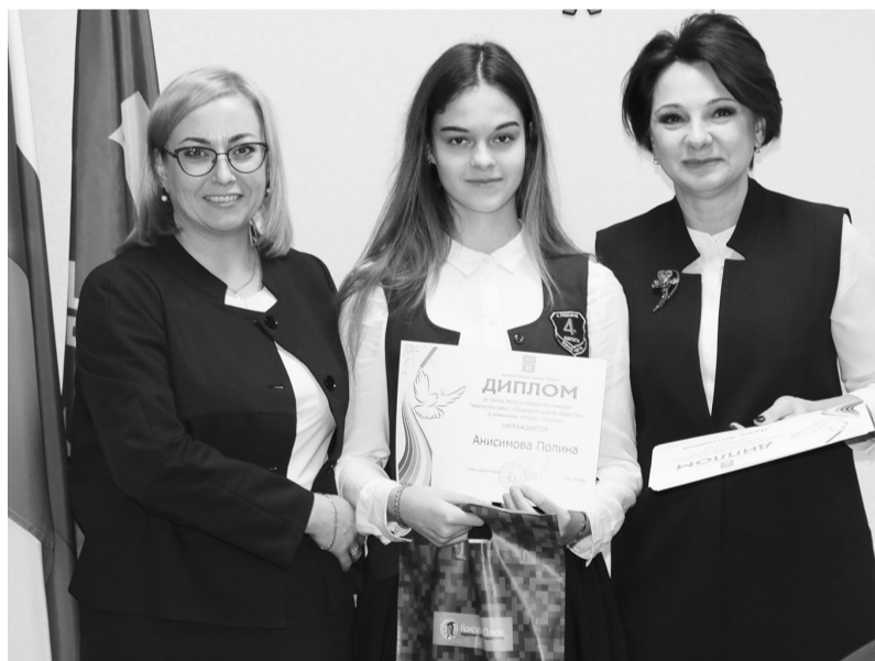
Награждение победителей городского конкурса творческих работ «Терроризм - угроза обществу»