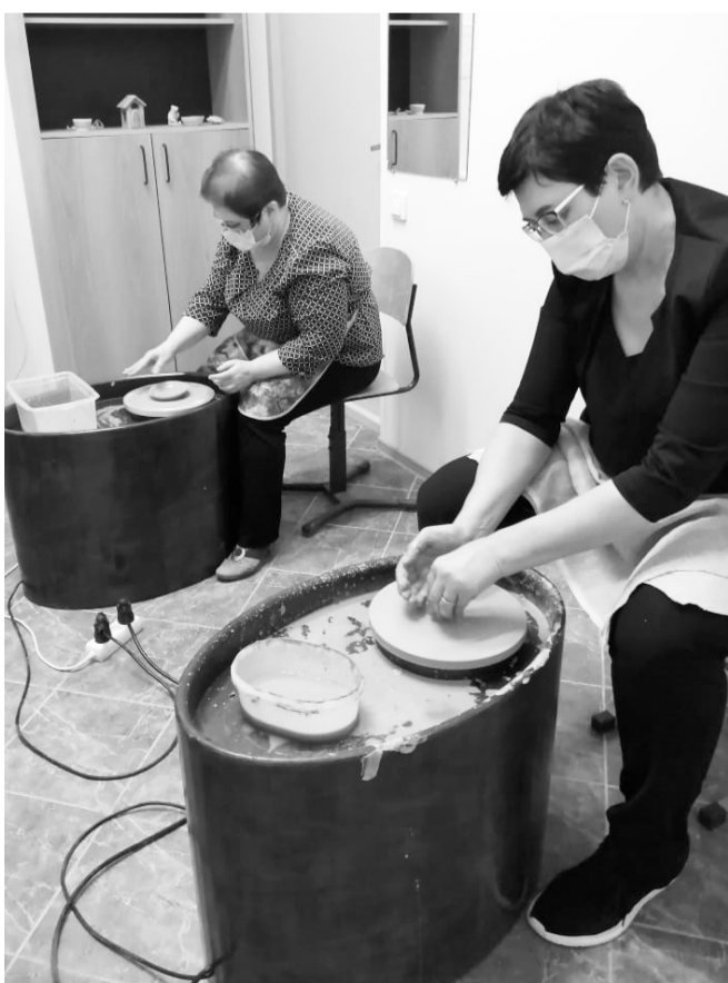
В мастер-классах принимают участие не только дети, но и взрослые

Важно, что совместная общественная деятель-