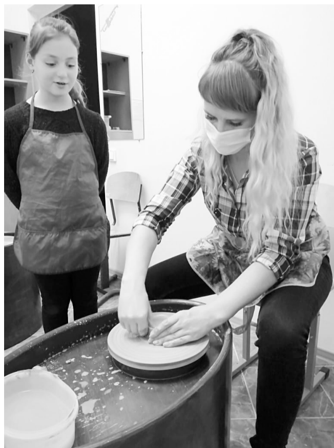
Проект «Гончарная мастерская» способствует поддержке талантливых детей

искусство – это не только интересно, но еще и полезно, так как развивает мелкую моторику, помогает тренировать образное мышление. Также регулярные занятия с глиной развивают усидчивость, концентрацию внимания и умение доводить начатое дело до конца.