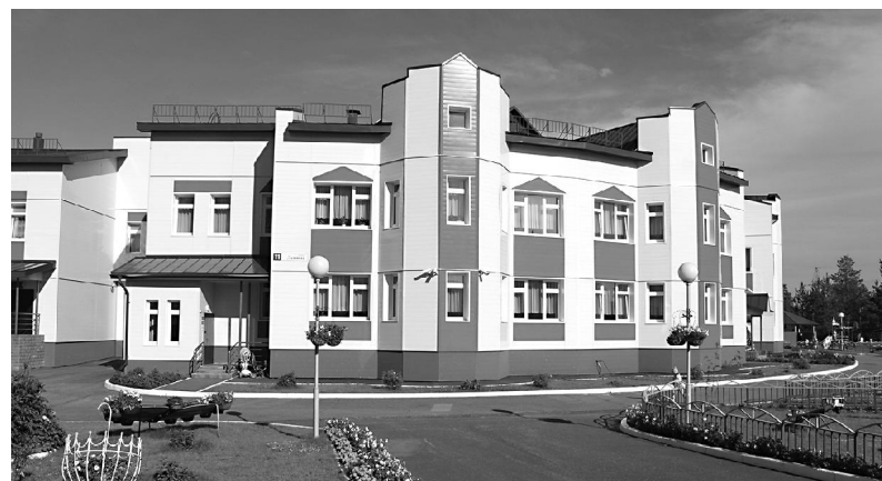
Среди дошкольных образовательных учреждений детский сад «Югорка» определён для внедрения опыта создания специальных условий для получения образования детьми с ОВЗ в рамках деятельности сетевого компетентного центра «ИНКЛЮВЕРСАРИУМ».

ющая потребностям ребёнка раннего и дошкольного возраста, в том числе детей с ОВЗ и инвалидностью. Материально-технические условия реализации индивидуальной образовательной программы обеспечены соблюдением санитарно-гигиенических норм образовательного процесса с учётом потребностей детей с ОВЗ, возможности для беспрепятственного доступа обучающихся к объектам инфраструктуры образовательного учреждения». Также было отмечено, что обучение детей с ограниченными возможностями ведётся по адаптированной основной образовательной программе детского сада «Югорка». Реализуется круж-