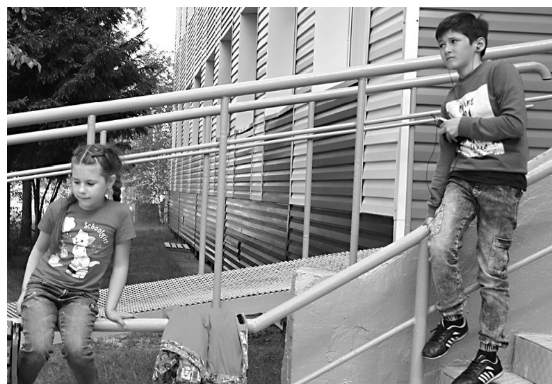
С 2018 года школа № 2 определена в качестве площадки по реализации проекта «Сетевого компетентного центра инклюзивного образования «Инклюверсарий»».