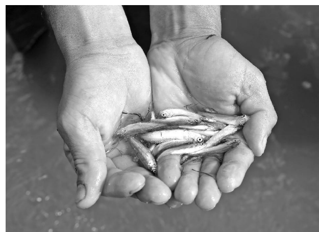
Центр по связям с общественностью ООО «ЛУКОЙЛ-Западная Сибирь».

природоохранных мероприятий ООО «ЛУКОЙЛ-Западная Сибирь». Комплексная работа ведется ежегодно с 2015 года. За прошедший период в акваторию Обь-Иртышского бассейна выпущено 146 миллионов 832 тысячи мальков рыб промысловых пород.