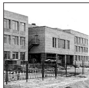
Бригада Майины Обрусняк на строительстве школы № 1