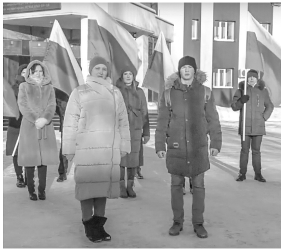
Молодежь города Покачи выступила в поддержку Российской армии

Видео было выложено в соцсети «ВКонтакте» под хештегами #ЗаРоссию #ЗаПутина #Своихнебросаем.