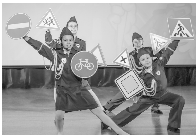
Творческий этап конкурса «Безопасное колесо»

Конкурс продолжился теоретической частью. Юные инспекторы продемонстрировали свои знания на этапах «Знатоки правил дорожного движения» и «Знатоки основ оказания первой доврачебной помощи», выполняя задания на компьютерах.