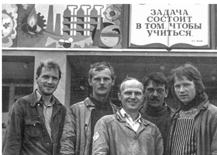
«Мы объект сдали! Ваша задача - учиться!»

Каждая планерка в НГДУ «Покачевнефть» начиналась