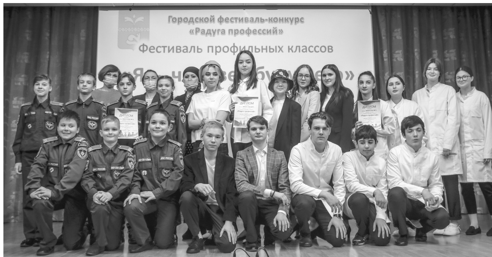
На фестивале профильных классов «Я - человек будущего» команда школы № 4 представляла профессию пожарного и заняла 1 место, команда школы № 1 - профессию телеведущего и заняла 2 место, команда школы № 2 - профессию врача и заняла 3 место

каждый ответ давалось всего по 20 секунд.