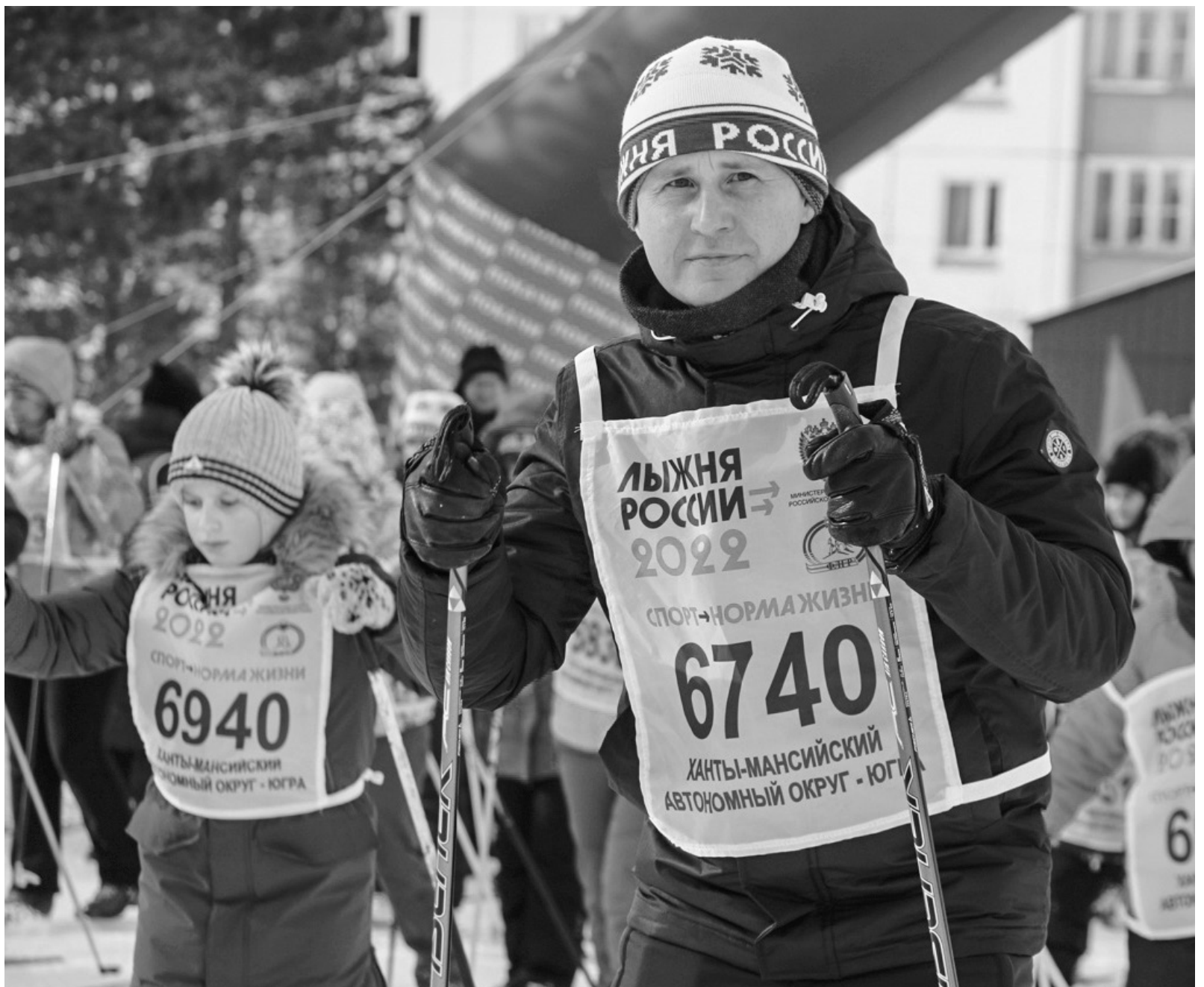
В традиционном забеге «Лыжня России - 2022» приняли участие и юные лыжники, и взрослые спортсмены с опытом

Стоит сказать, что все эти годы в нашем городе проводился только массовый забег. В этом же году впервые в Покахе состоялся ещё и спортивный забег, в котором приняли участие те покачевцы, которые занимаются лыжным спортом. В спортивном забеге стартовали 52 лыжника, среди которых как юные воспитанники лыжной секции, так и взрослые спортсмены с опытом.