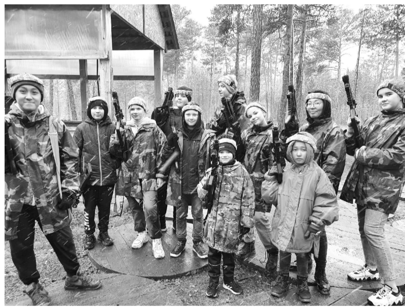
«Лазертаг» - активный отдых на свежем воздухе

Раз в две недели у медиаволонтеров группы «Таймер» релакс-терапия. Мы думали, думали, как обозначить данное действие и приняли решение, что самое подходящее – это именно релакс-терапия. Так что же это такое? Это банальный отдых от образовательной деятельности в стенах редакции и не только!