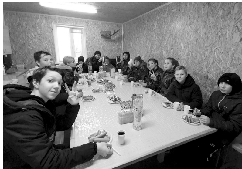
В клубе «Феникс» можно подкрепиться после подвижной игры