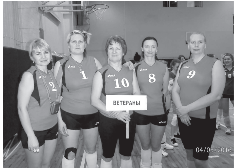
Сборная команда ветеранов волейбола г. Покачи