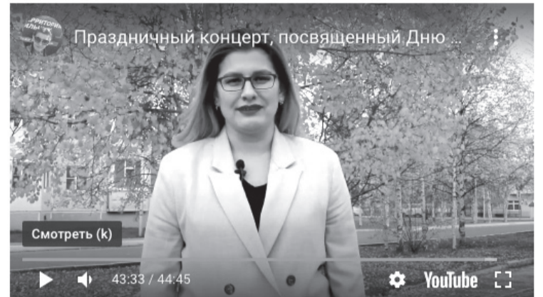
Праздничный концерт, посвященный Дню пожилого человека

#покачи #дкоктябрь #деньпожилогочеловека