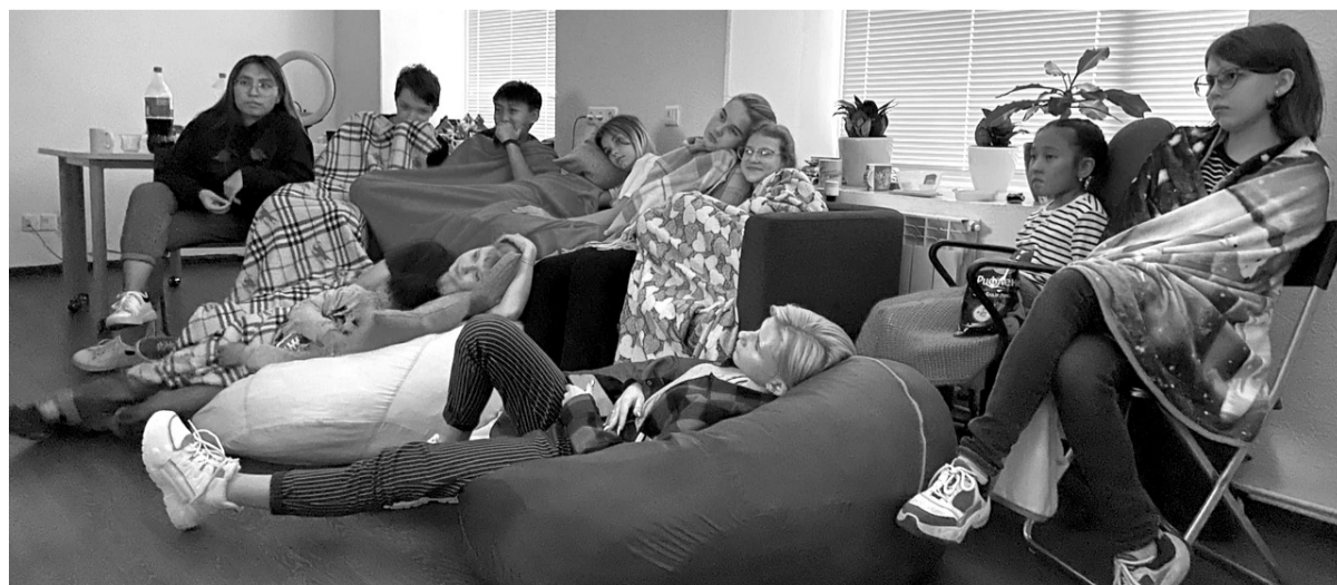
Ночь кино в «Таймере»