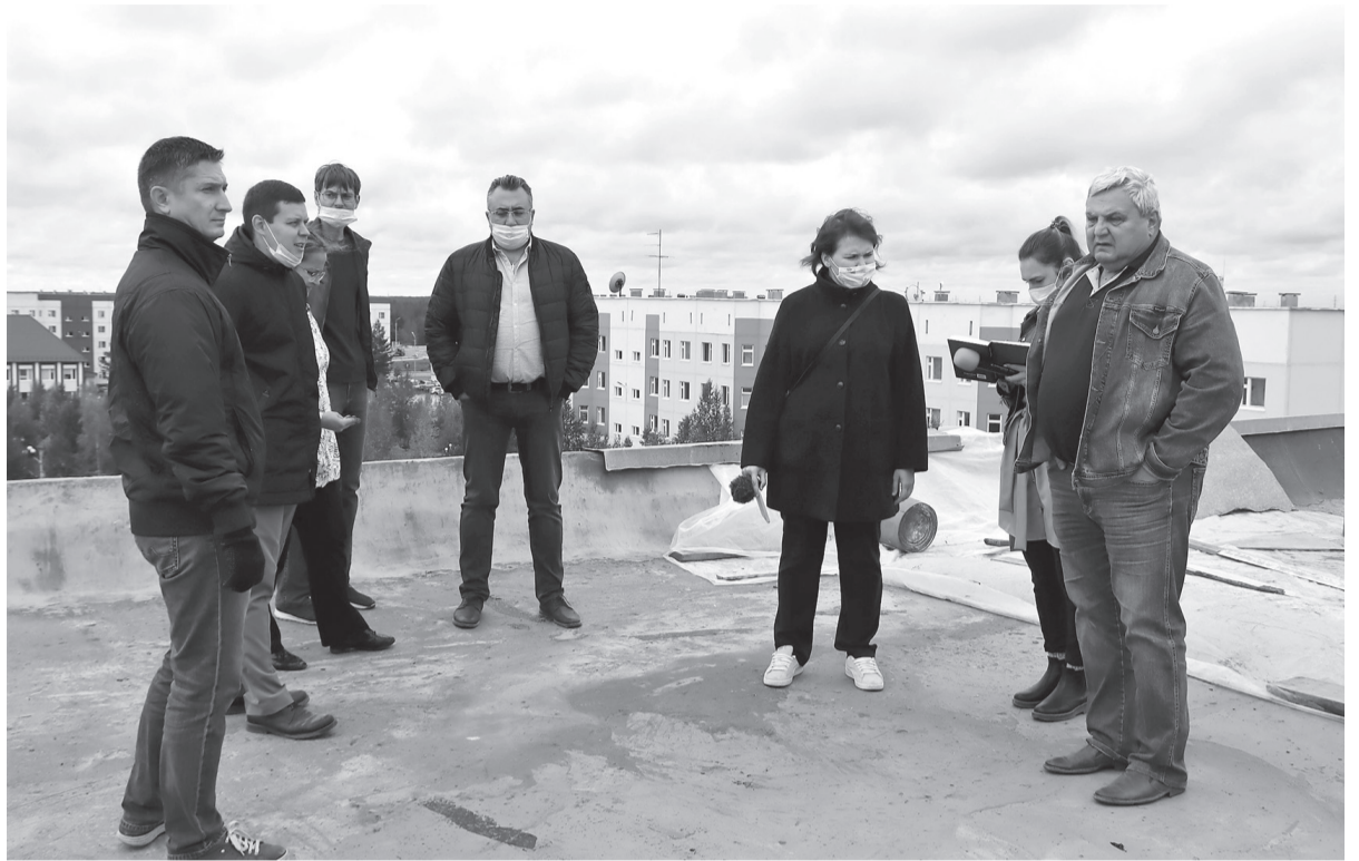
Ремонт крыши дома Таежная, 12 – на контроле администрации, управляющей компании и общественности города

Я, как председатель общественного совета, принимал участие в работе этой комиссии. Был сделан визуальный осмотр чердачного помещения и кровли.