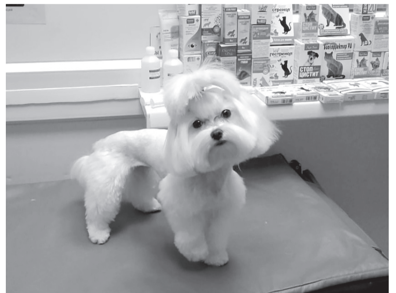
Стрижка мальтийской болонки