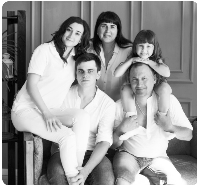
Вместе - дружная семья

А началось все с конкурса «Учитель года». В 1994-1995