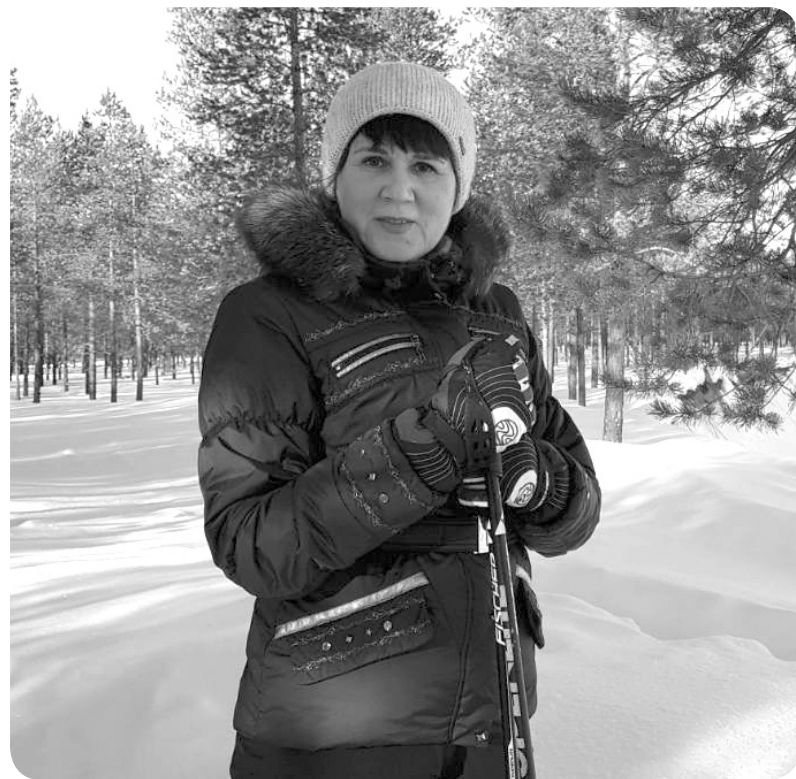
Лыжные прогулки стали традицией

У неё и сейчас глаза блестят, когда она рассказывает о незабываемой студенческой поре: «На нашем факультете жизнь кипела! У нас была своя республика «Физмат». Мы проводили математические балы, распечатывали картины на компьютерной