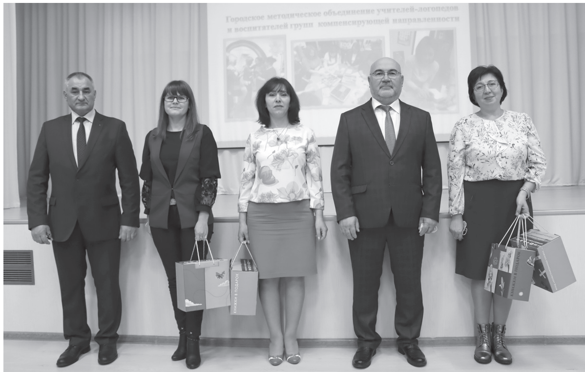
Руководителям образовательных организаций в торжественной обстановке вручили учебные комплекты для слабовидящих детей

– Родители, преподавательский состав – вы мир добрых людей. Нефтяная компания «ЛУКОЙЛ», благотворительный фонд, профсоюзная организация прикладывают немало сил для того, чтобы каждому ребенку было обеспечено право свободно развиваться в этом мире. Мы вкладываем средства