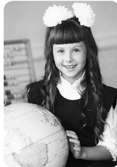
Внучка - первоклассница