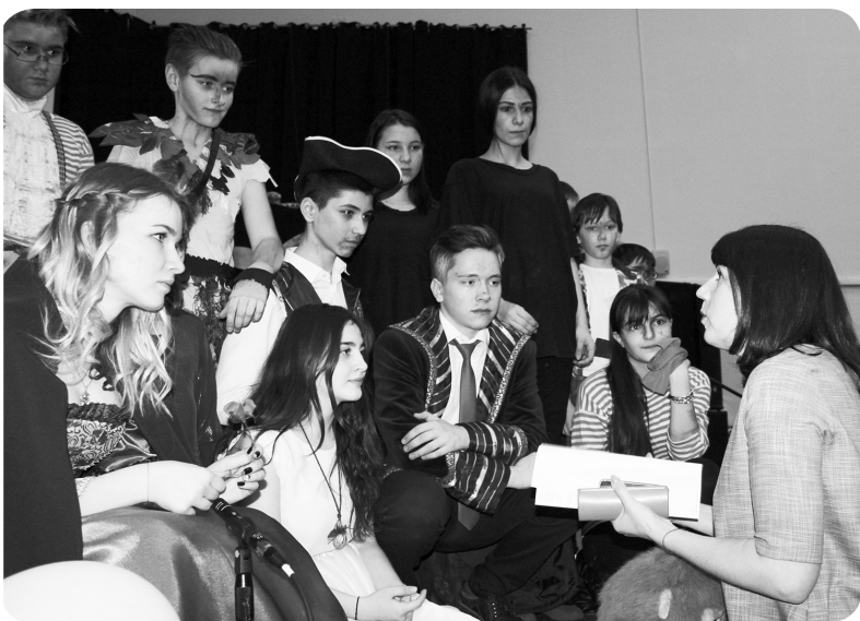
После спектакля школьного театра «INDIGO»