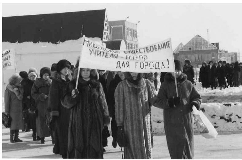
В тяжёлые 90-ые покачёвские учителя выходили на митинг

Депутаты второго созыва добились конструктивного взаимодействия законодательной и исполнительной власти на благо города.