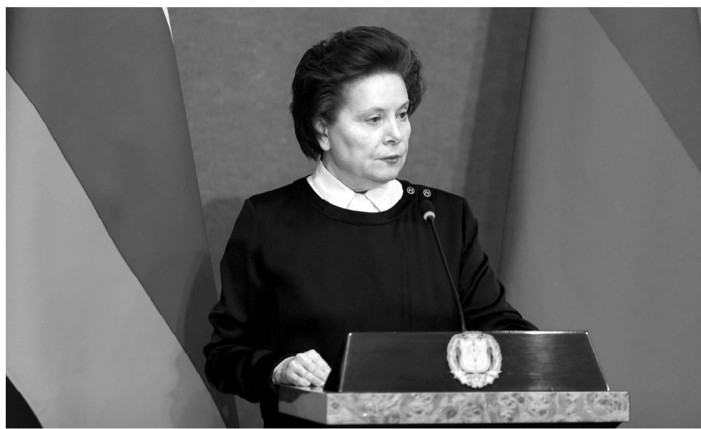
Одной из ключевых линий обращения стала связка достигнутых и планируемых показателей с нацпроектами

Другая значимая инициатива: в этом году нефтедобывающими компаниями проведен комплекс работ по подготовке территории и высадке бо-