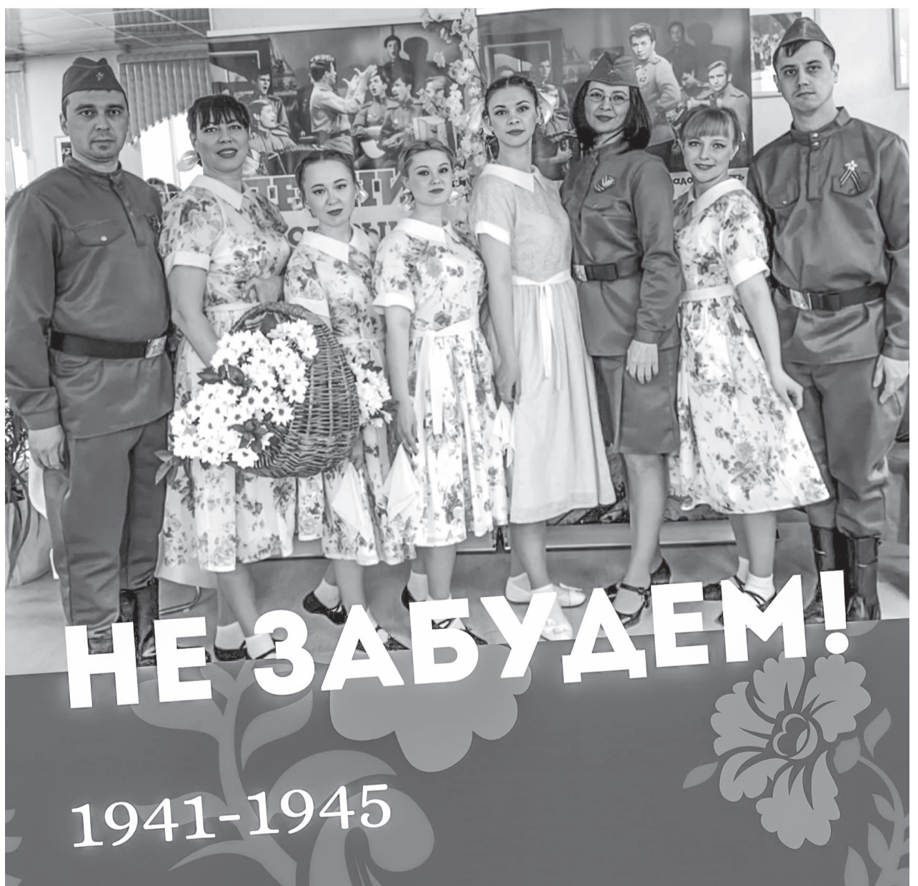
Участники фестиваля-конкурса «Песни, с которыми мы победили», команда филиала ООО «АРГОС» – СУМР

Первая песня, написанная в годы Великой Отечественной войны, называется «Священная война». Эта патриотическая композиция стала настоящим гимном советского народа. Великолепно была исполнена «Песня брянских партизан» – медленная, тихая, но сильная композиция, которая не может не трогать сердце сентиментального русского человека. А еще бойкая «Катюша», громкая, но такая знакомая и родная «Смуглянка», озорная «Песенка военных корреспондентов» на стихи Константина Симонова, родной сердцу «Алеша», как