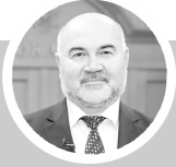
В.И. Степура глава города Покачи