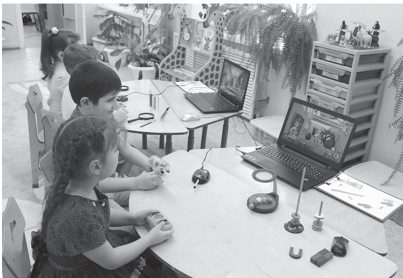
В детском саду «Рябинушка» оборудована цифровая лаборатория «Наураша»