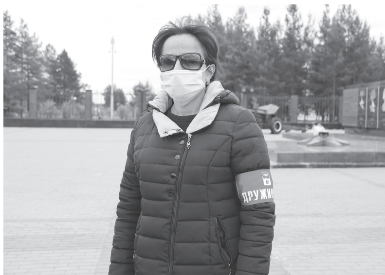
В ряды дружинников может вступить любой желающий. Возрастное ограничение 18+

«Активисты ДНД вносят свой немалый вклад в сохранение порядка. Также большая помощь дружинников необходима во время массовых мероприятий, таких, как День города, 9 Мая, День России, Масле-