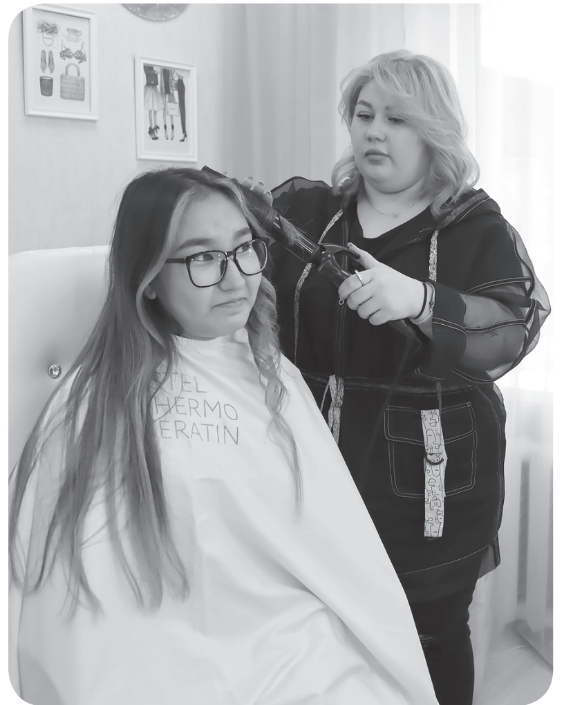
Красивая причёска создаёт привлекательный образ и поднимает настроение

«Я открыла свой маленький салон. Большой белый стол с боковыми тумбами, гримёрное зеркало с лампами и кресло на колёсиках. Ничего лиш-