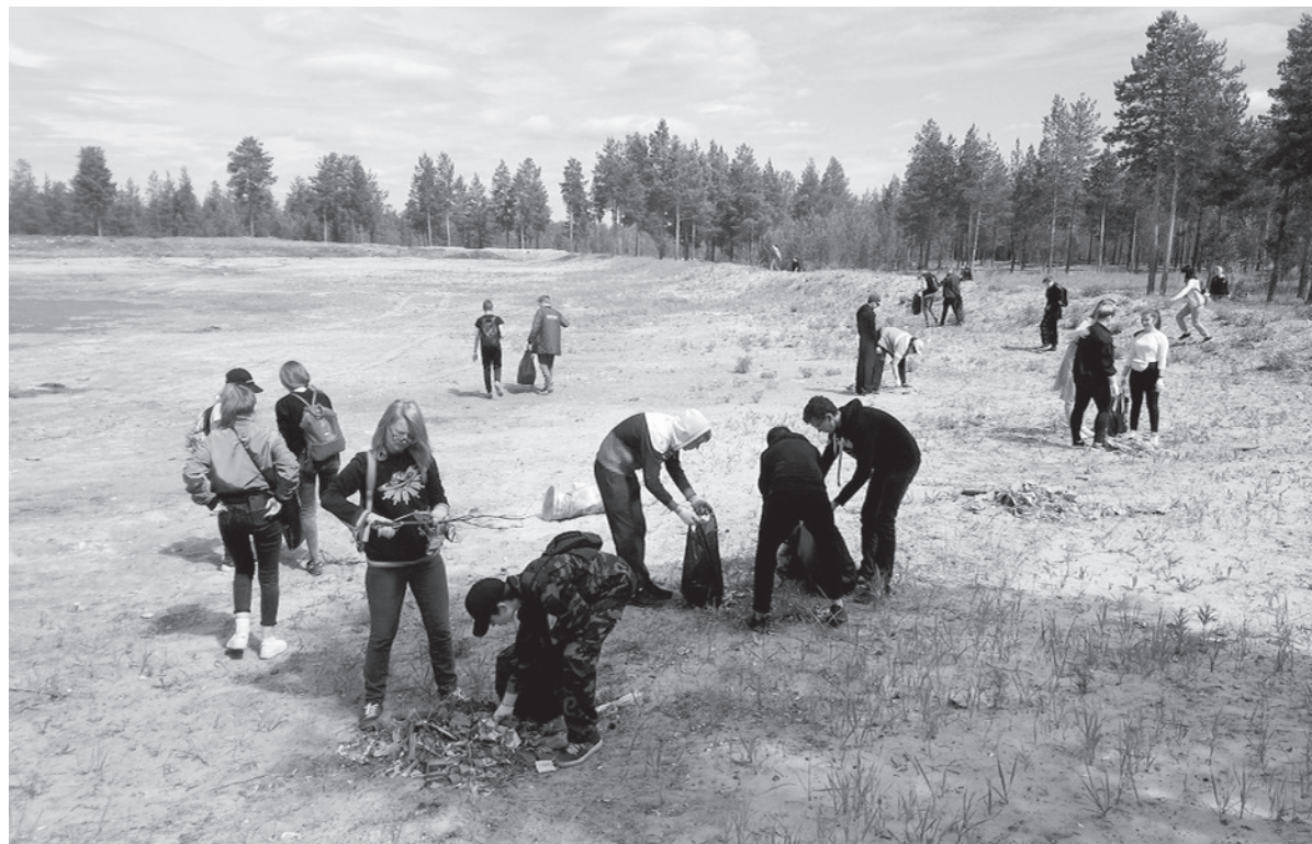
«ДОБРОотряд» на субботнике летом 2019 года