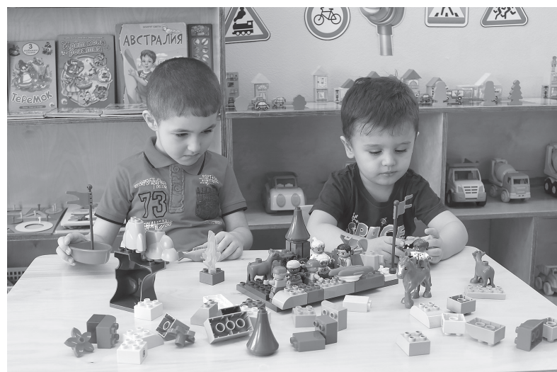
LEGO-конструирование – одно из самых любимых и увлекательных занятий детей

подведение итогов творческой группы по реализации проекта, проведение итогового педагогического совета по теме: «Образовательное пространство LEGO», обеспечение активного сетевого взаимодействия с социальными партнёрами по направлению «Образовательная робототехника» и другие.