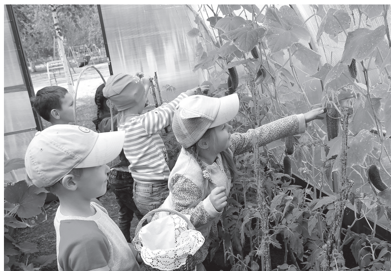
Трудовая деятельность в теплице – один из этапов проекта «Лаборатория юных исследователей»