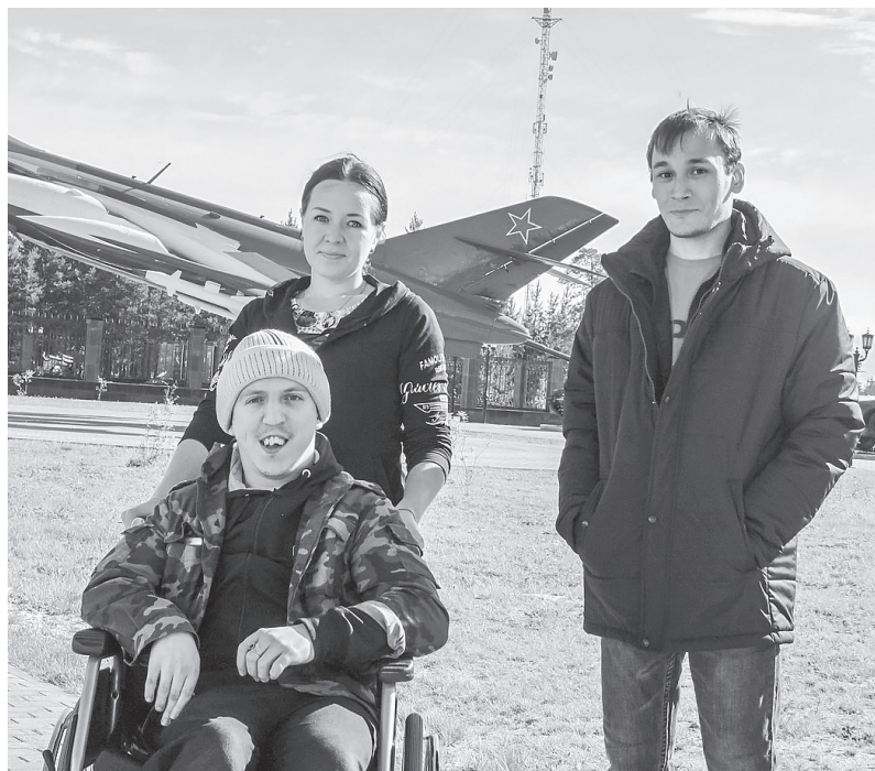
Светлые воспоминания о прогулках до режима самоизоляции