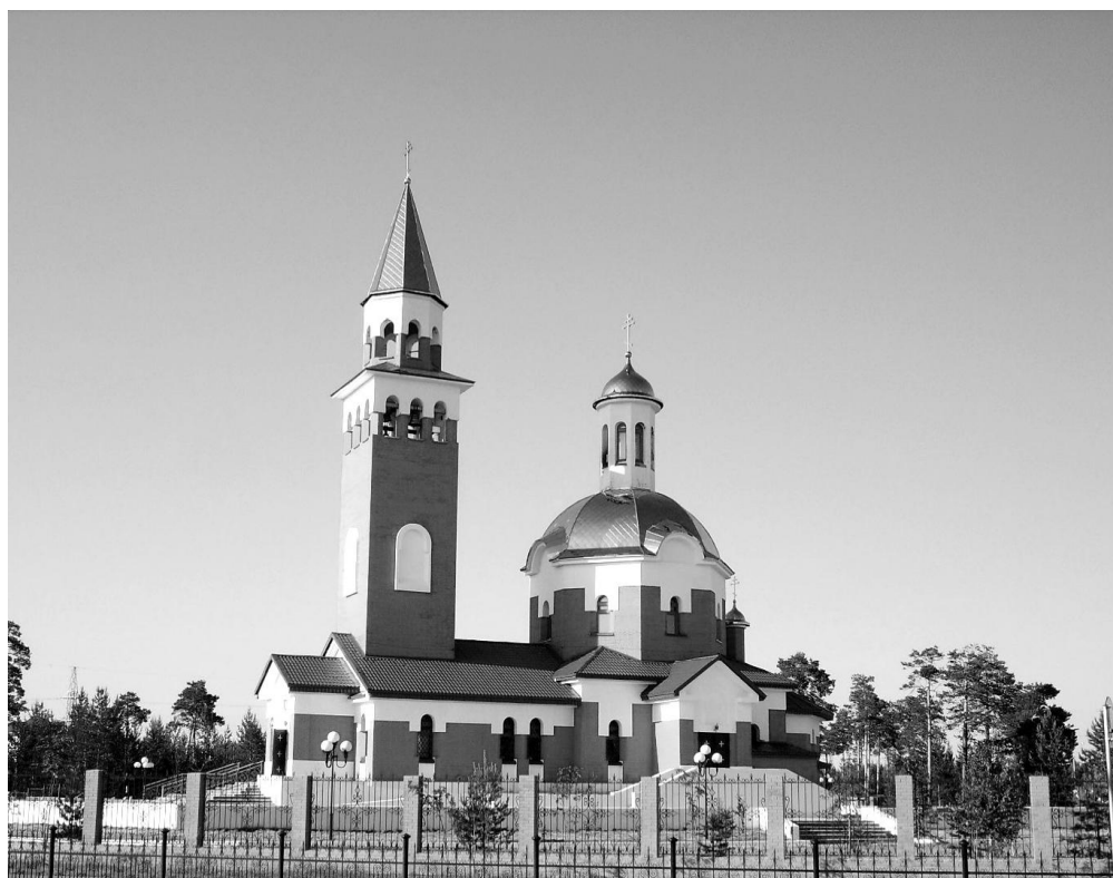
Храм Покрова Божией Матери — душа города Покачи

«Помяни нас во Твоих молитвах, Госпоже Дево Богородице, да не погибнем за умножение грехов наших, покрой нас от всякого зла и лютых напастей; на Тя бо уповаем и, Твоего Покрова праздник чествующе, Тя величаем».