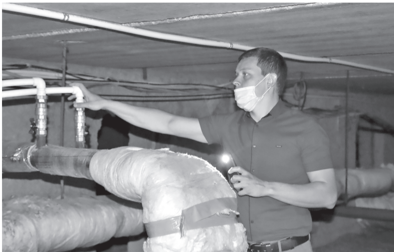
Проверка готовности объектов образования к осенне-зимнему периоду