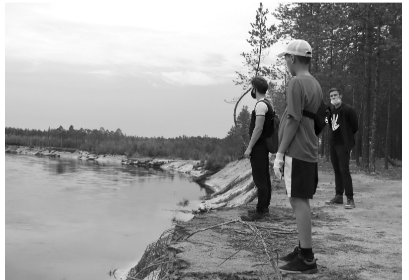
Субботники - часть национального проекта «Экология»

В акции «Чистое дело» приняли участие: активисты РМОЭД «Третья планета от Солнца», волонтеры группы «Таймер», сотрудники администрации и Думы города Покачи, а также неравнодушные горожане.