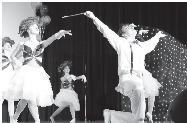
Сцена – место, где комфортно. Танец – способ жить свободно и быть собой!

«Канеш****, у вас тут весело, мне это подходит!» – кидает он мне в ответ. Занавес. Я в приятном шоке :)