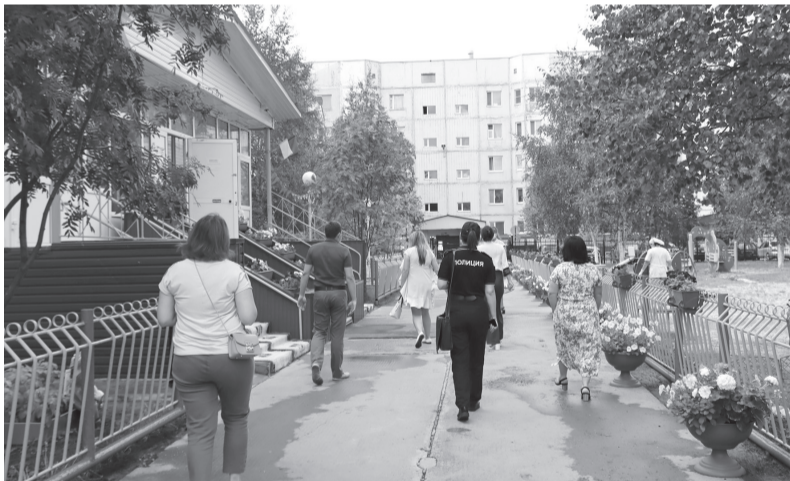
Комиссия осмотрела территорию детского сада «Сказка»