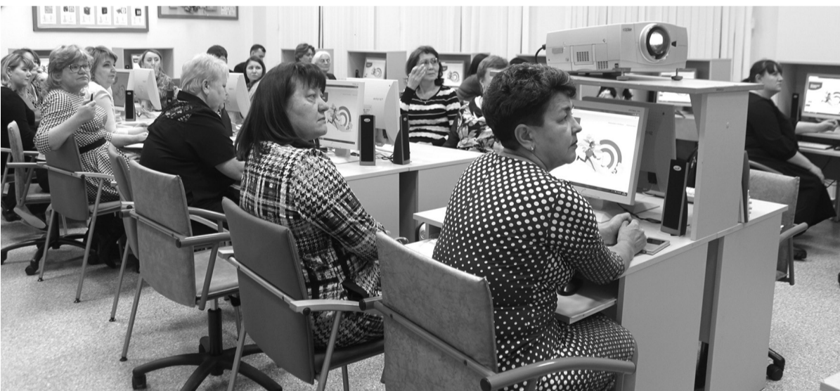
В компьютерном классе школы №4 часто проходят городские мероприятия. Семинар «Открытая школа», 2019 год

над собой. Ты должен развиваться в разных сферах и быть в курсе последних событий и новостей в образовании. Дети часто задают вопросы на любые темы, и нужно быть подкованным во многих сферах. Но я также понимаю, что всего знать невозможно, поэтому, если мне