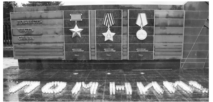
ФАКТЫ О ВЕЛИКОЙ ОТЕЧЕСТВЕННОЙ ВОЙНЕ