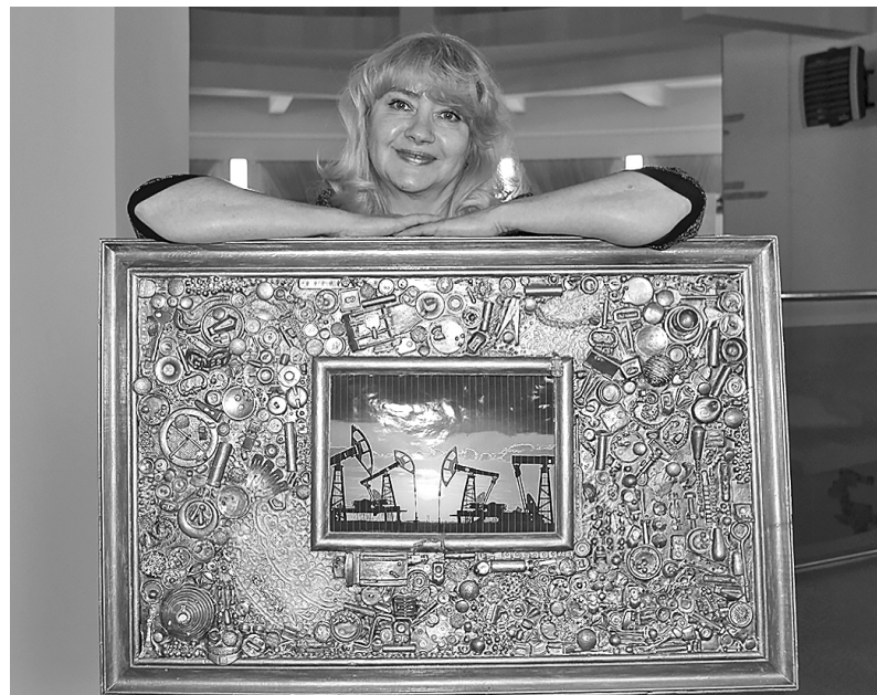
Необыкновенное в обычном.