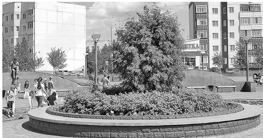
Поддержка была оказана в рамках госпроекта «Развитие жилищной сферы».

Согласно федеральной статистике Ханты-Мансийский автономный округ вошел в пятерку регионов-лидеров России по бюджетным средствам, выделяемым на социальную поддержку населения.