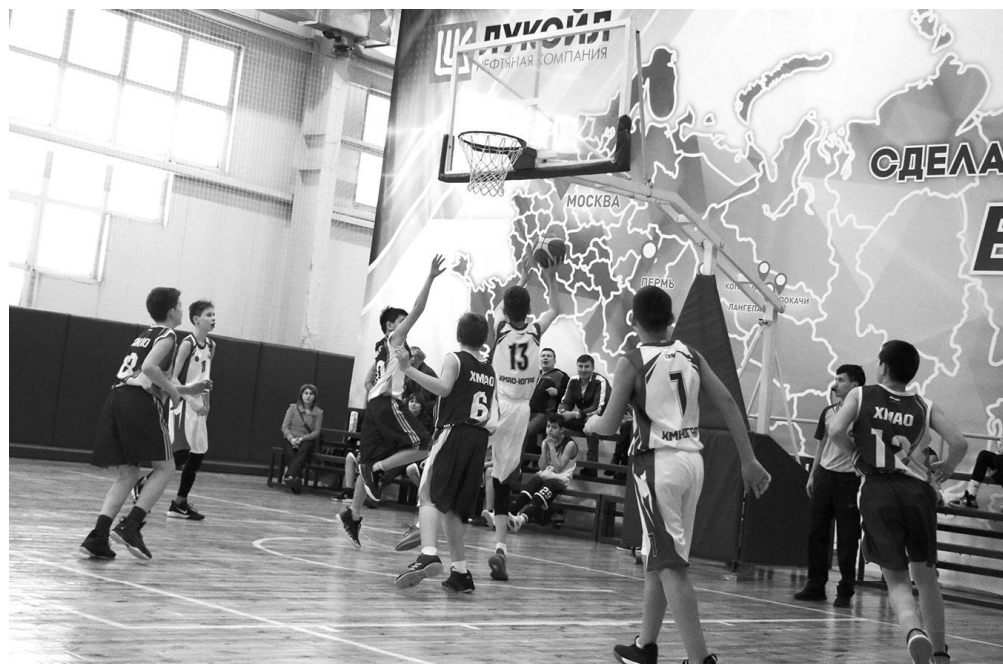
Баскетбол - это одна из самых популярных и зрелищных командных игр с мячом