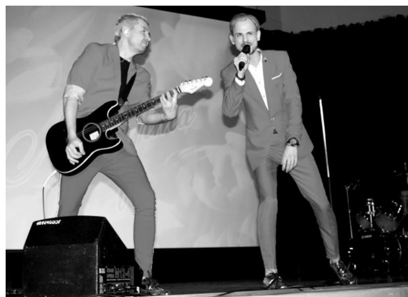
Кавер-группа «Джонни Депп» из г.Екатеринбурга