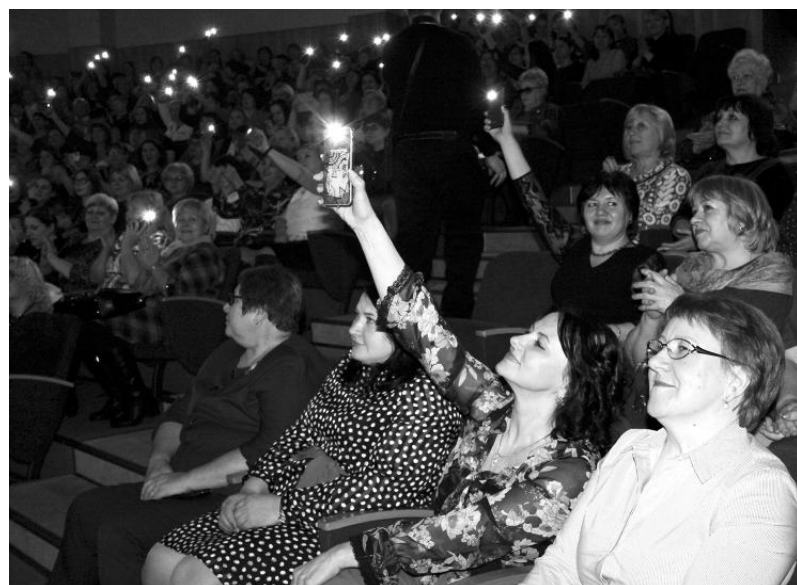
Романтическое настроение под песню «Земля в иллюминаторе»

Накануне 8 Марта в концертном зале школы №4 было светло от милых улыбок самых обаятельных и привлекательных представительниц нашего города. Именно им, всем покачёвским женщинам, девочкам и девушкам, был посвящён традиционный праздничный концерт. Как всегда, сценарий великолепный.