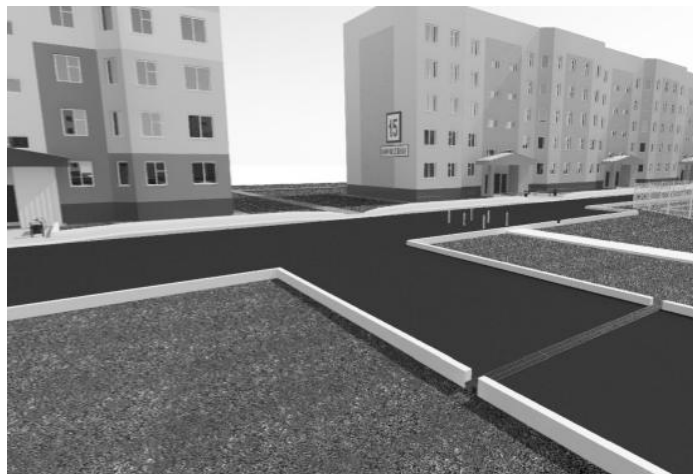
Так будут выглядеть дворы Таёжная, 10; Молодёжная, 9, 11, 15 после проведения работ по благоустройству