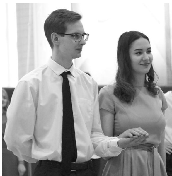
Танец взорвал зал от эмоций