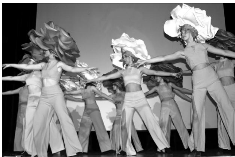
Спасибо хореографу за танец, а костюмеру - за розы