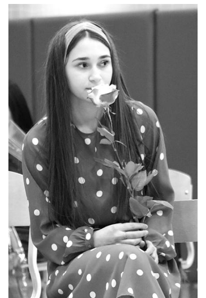
Весенний аромат цветов