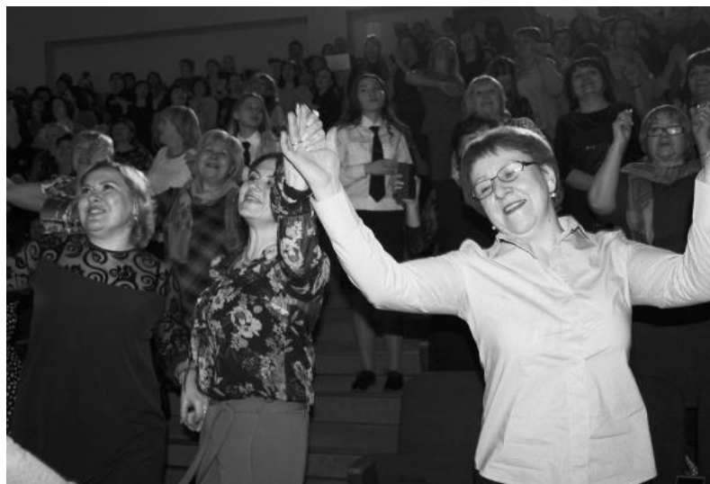
Эмоции зашкаливали! Весь зал танцевал!