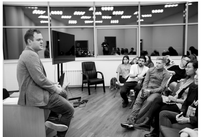
Этот чувак знает Ксению Собчак! Ну, разве не круто, а?!

В завершение хочется сказать, что «Креативный город» дал мысли громкие, друзей ярких и волшебства на всю голову! За этим и ехали, собственно!