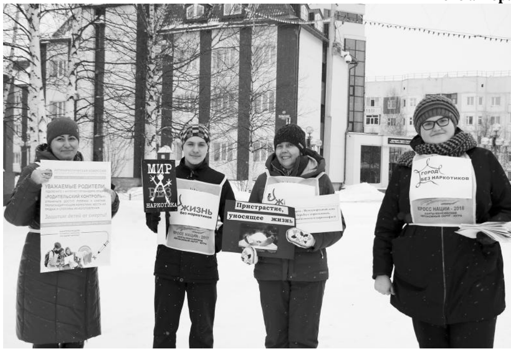
Мы говорим наркотикам «НЕТ!»