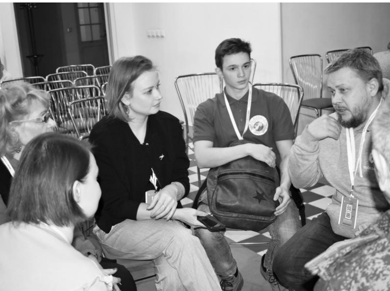
Мастер-класс «Наводим порядок в организации: как повысить устойчивость НКО, внедряя системы менеджмента качества»