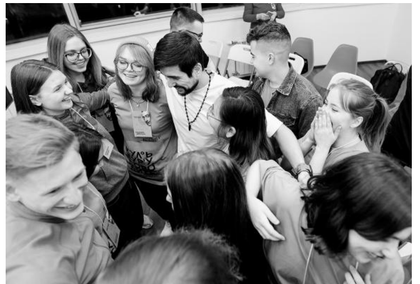
Адреналин подступал, пульс учащался, дыхание сбилось!