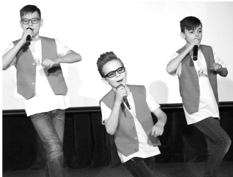
Поздравление от юных джентльменов

Ряд восторженных эпитетов можно продолжать долго, но быстрее хочется сказать о главном