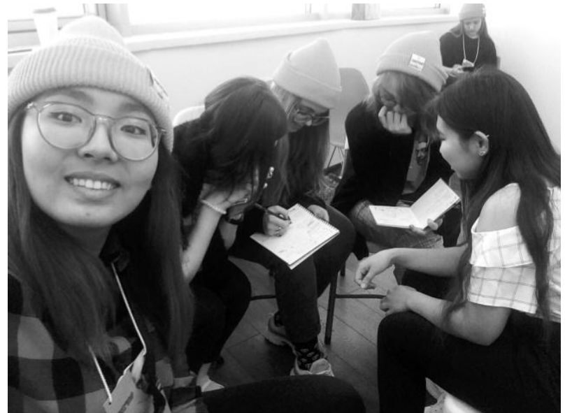
Затянула «Мозгобойня». Включились мозг, логика, но не телефон