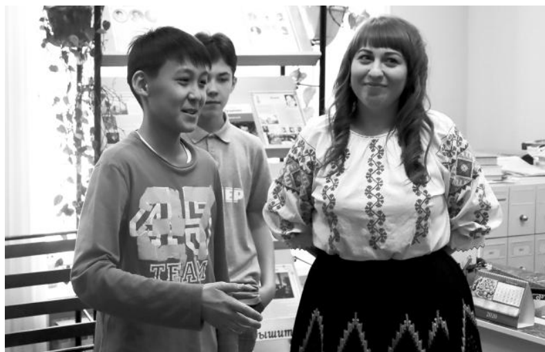
Ребята посетили различные станции и узнали культуру разных народов

В завершение участники получили сладкие призы.