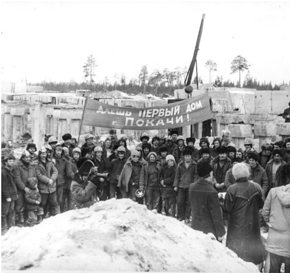
■ В первом капитальном доме Покачей строители заложили капсулу времени, которую потомки смогут распечатать через 100 лет

«Мы приехали в Нижневартовск, там шел набор на Покачи, и мы отправились. Добирались очень долго, дорога тогда была плиточная. Скакали в автобусе, как мячики. Приехали сюда, нас было 3 семьи. Здесь 4 вагончика, один из них прорабская, и только сваи забиты. Нам сказали: «Будем город новый строить». Приехали поздно, давайте спать ложиться. Ночью холодище, зуб на зуб не попадает! Одежда там какие-то тоненькие были, укрывались пальто, шубами. Утром проснулись, надо умываться, собираться на планерку, знакомиться. Кинулись, а вода в ведре замерзла! Так начались наши