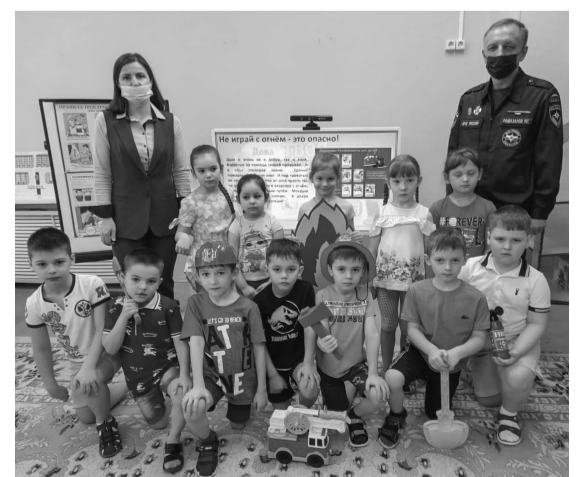
■ Всероссийский урок безопасности в детском саду «Сказка»

В процессе занятия с детьми обсудили различные источники опасности и то, как нужно себя вести в чрезвычайных ситуациях, например, при пожаре. Помимо лекции с презентацией, информацию до воспитанников детского сада доносили в игровой форме: так и ребятам интереснее, и важные знания запоминаются лучше. Открытый урок «ОБЖ» помог ребятам закрепить знания, которые в случае опасной ситуации помогут действовать правильно и сохранить здоровье.