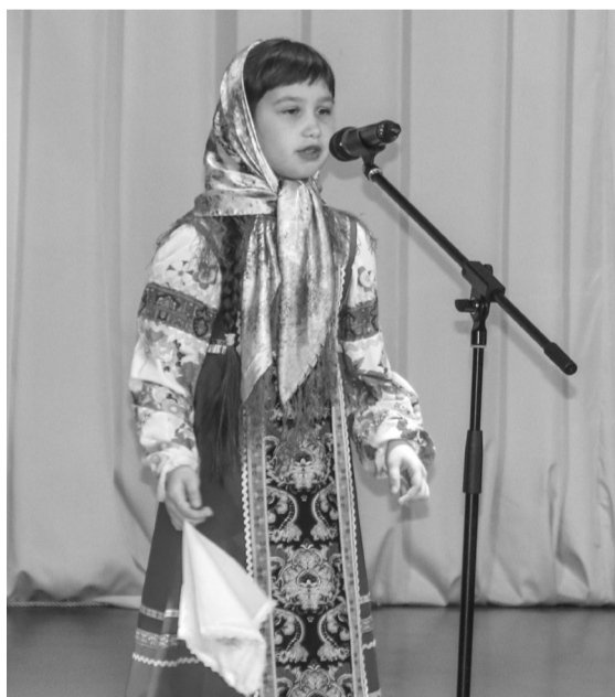
В русской народной песне - душа всей России

Юные артисты представили уникальную музыкальную палитру звуков таких инструментов, как баян, аккордеон, флейта, фортепиано, а зажигательные выступления хореографических коллективов «Сувенир», «Задоринка» и «New-анс» добавили мероприятию особенную праздничную атмосферу.