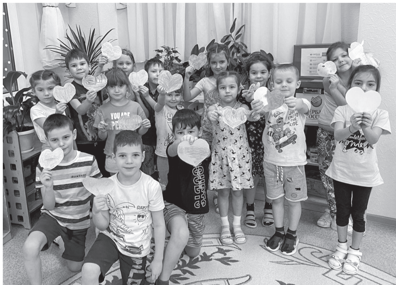
Группа «Ручеек» детского сада «Югорка» отметила Международный день «спасибо»