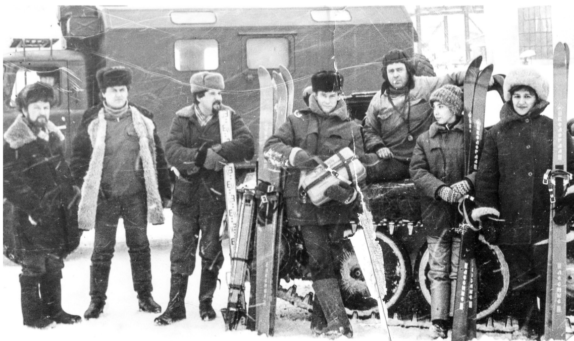
При освоении новых месторождений - от разведки до обустройства - первыми идут маркшейдеры

От этой буровой геологи стали продвигаться на север Западной Сибири. Они работали в экстремальных условиях. Все проходило далеко не гладко, и первопроходцам не сразу удалось найти нефть и газ, однако они не сдавались и продолжали поиски.