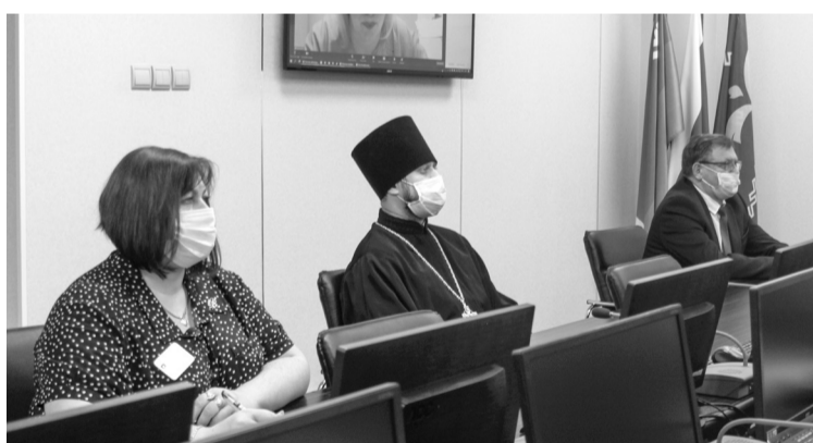
Накануне праздника Крещение Господне обсудили меры предосторожности при проведении обряда купания в купели, а также при наборе освященной воды на Голубом озере и в емкостях на территории храма

Запланировано вакцинировать в городе Покачи против ковида 80% взрослого населения, что составляет 11006 человек. Всего на 13.01.2022 привито 7583 человека (68,89%),