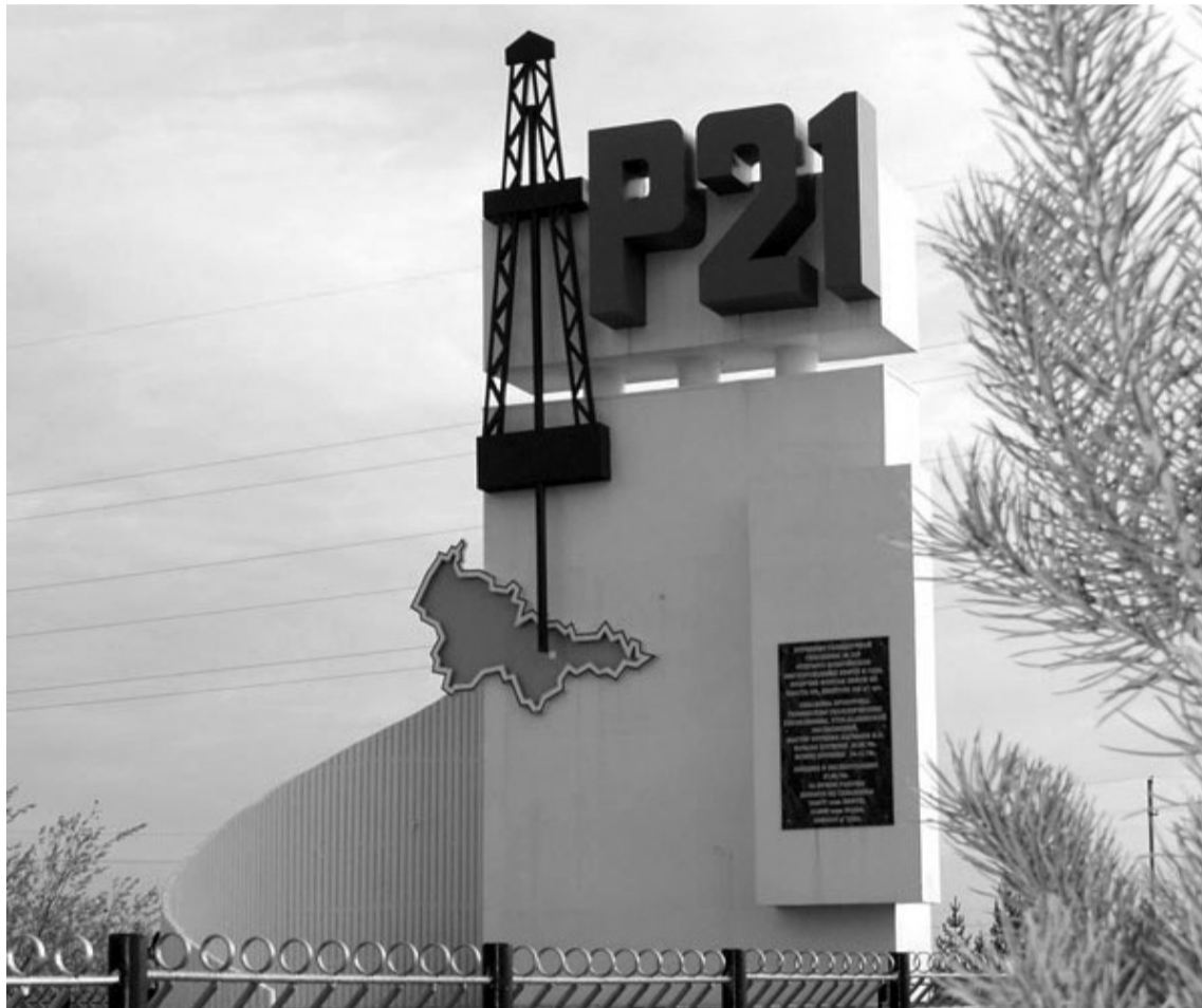
В Покачах первой дала фонтан нефти 21-я разведочная скважина в ноябре 1970 г.