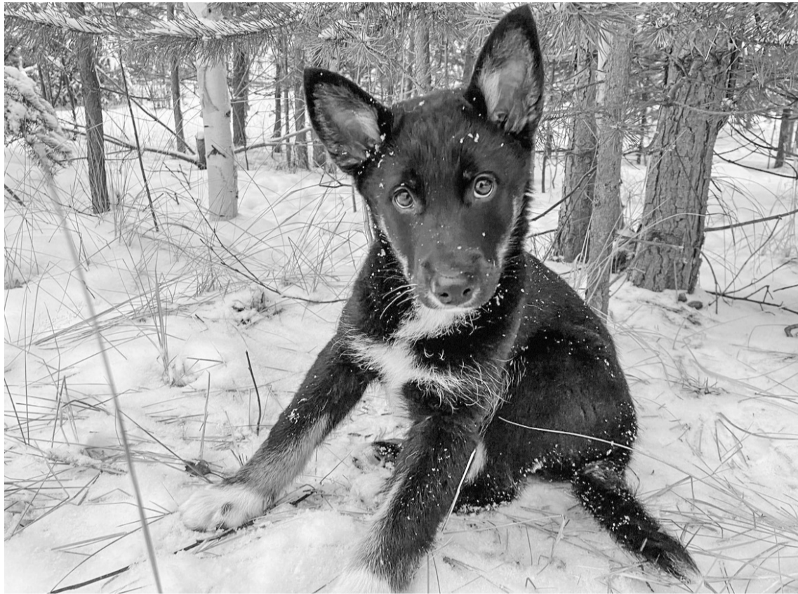
Щенка родила собака, которую бросил хозяин

Сотрудницы баклаборатории не раз видели резвящихся малышей. «Я с самого их рождения слежу за этими щенками, они родились под бетонной плитой у крыльца баклаборатории. Вначале их было шестеро, троих забрали люди к себе, осталось трое. Еще одного забрала женщина с Комсомольской, 6, но она почему-то выпустила его. Люди сердобольные кормили их, так и мы, работники баклаборатории, из дома приносили еду, с утра кормили. Они выросли на глазах – хорошенькие, никому вреда не причиняют, их мама также никого не трогает, просто лает, чтобы ее деток не обижали. Но, как вы знаете, на территории больницы их нельзя оставлять. Их выгнали, дырку закрыли, где они