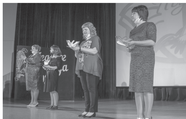
Конкурсанты в номинации «Учитель года»