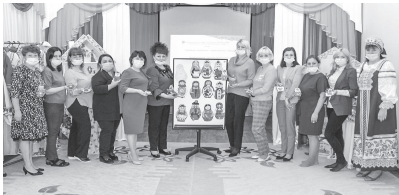
Городской семинар прошел на базе детского сада «Сказка»

25 ноября в детском саду «Сказка» прошел городской теоретико-практический семинар на тему «Формирование духовно-нравственных и социокультурных ценностей у дошкольников»