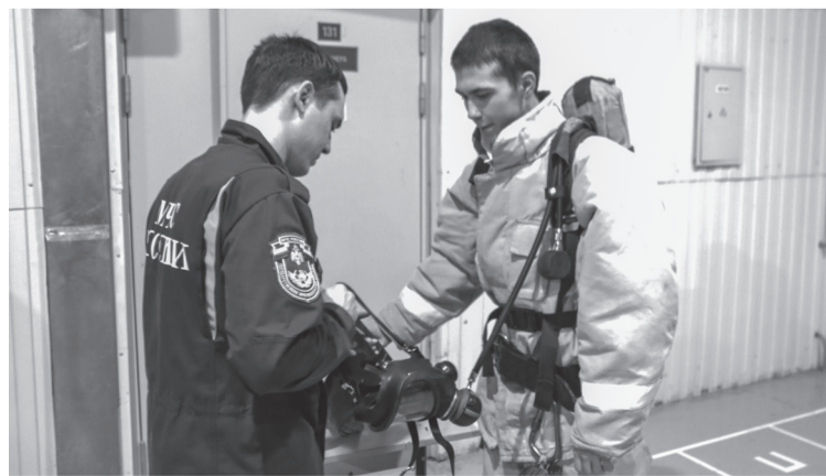
Волонтеры попробовали себя в роли пожарных

дицентра «Таймер» при газете «Покачевский вестник».