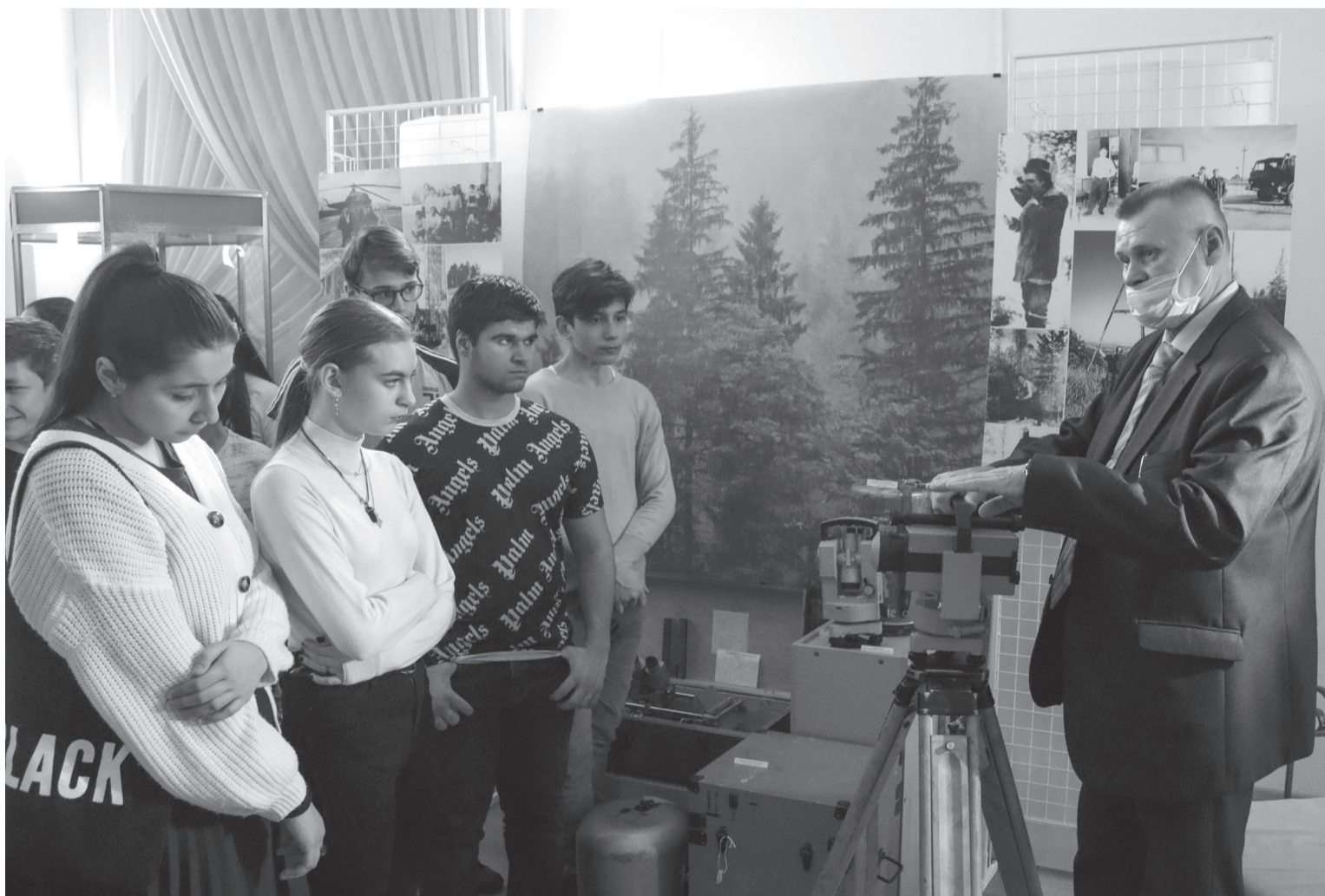
■ Открытие выставки «Измеряя мир»

24 ноября в выставочном зале краеведческого музея в Детской школе искусств состоялось открытие выставки «Измеряя мир»