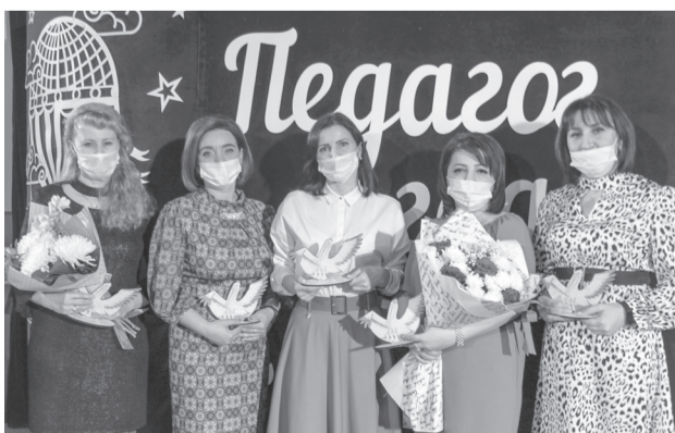
Конкурсанты в номинации «Воспитатель года»

Победители будут объявлены 10 декабря на торжественном закрытии конкурса «Педагог - 2021». Желаем всем конкурсантам творческих успехов и воли к победе!