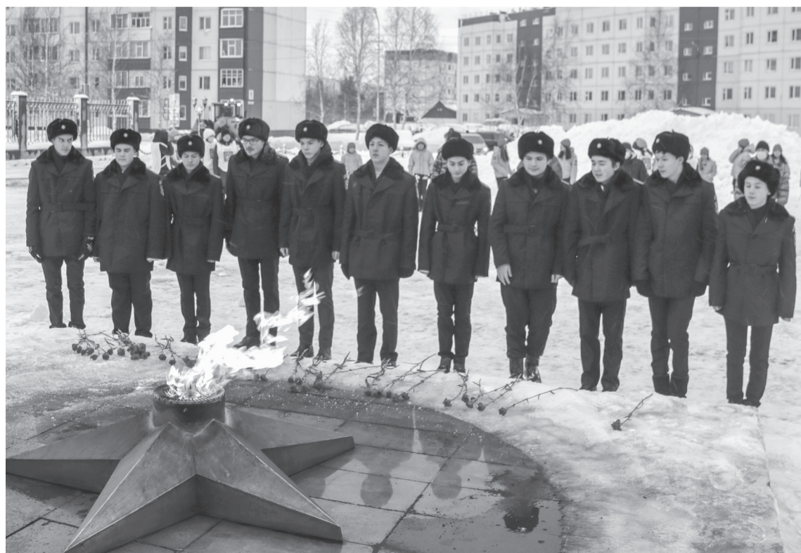
Возложение цветов к Вечному огню – это дань памяти обо всех неизвестных солдатах, отдавших свою жизнь за Родину и за мир для будущих поколений!

Вот уже семь лет подряд в этот день мы чтим память тех, кому обязаны нашей жизнью. И сегодня только минутой молчания и возложением цветов к Вечному огню мы можем отблагодарить их за подвиг.