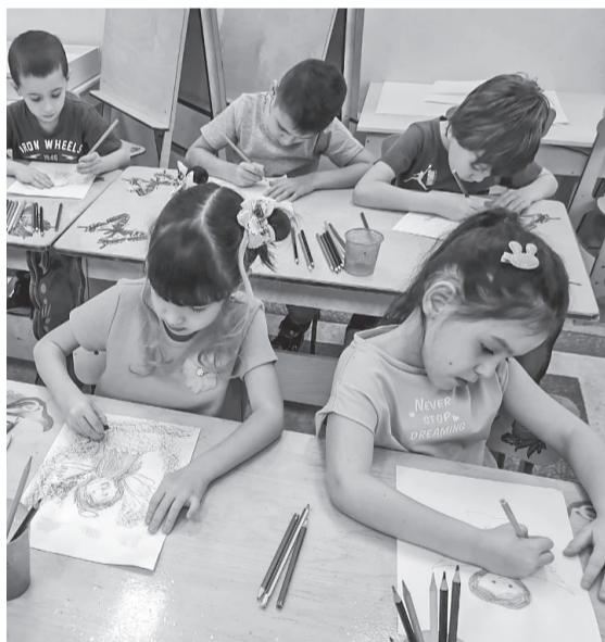
Воспитанники детского сада «Югорка» в рамках празднования Дня матери приняли участие во Всероссийской акции «Крылья ангела»

Мама – это ангел-хранитель для каждого ребенка, поэтому воспитанники нарисовали своих ангелов.