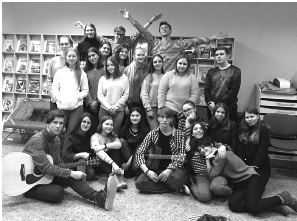
Материалы подготовили Наталья Иванова и Людмила Голубева.

Такой формат времяпровождения нравится юным горожанам. Это возможность интересно провести досуг со сверстниками, а также найти новых друзей.