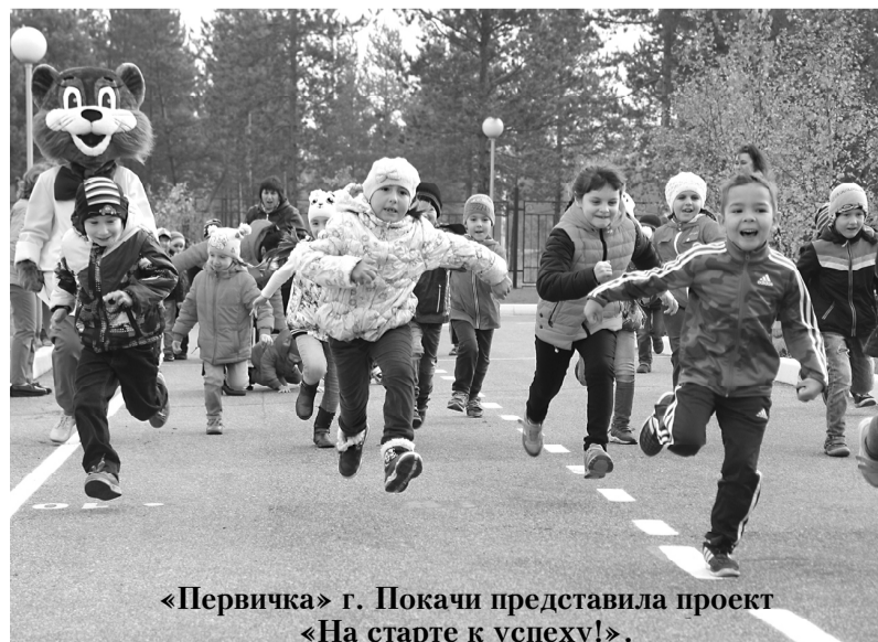
«Первичка» г. Покачи представила проект «На старте к успеху!».

Напомним, максимальная сумма гранта составит 200 тысяч рублей, победителей будет выбирать отдельно в трех категориях: первая — сельские первичные отделения, вторая — городские первичные отделения и третья — первичные отделения, действующие на территории административных центров субъектов.