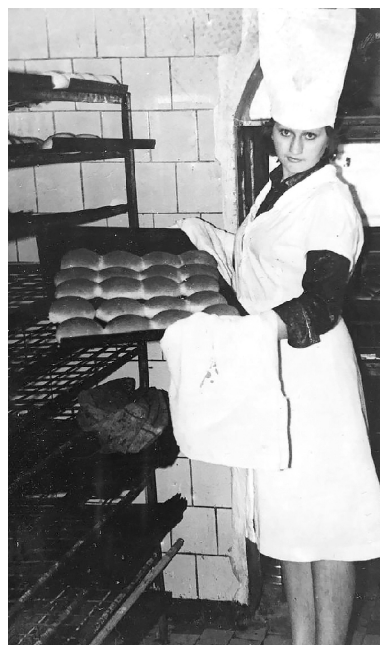
На первом рабочем месте.