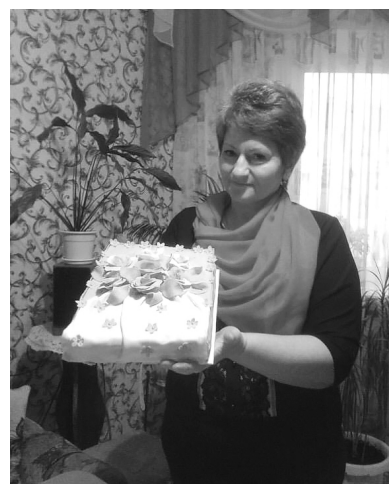
Творить, чтобы «радовать глаз».