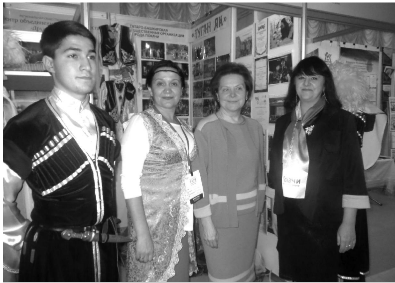
Окружная ярмарка некоммерческих организаций.