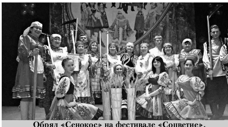
Обряд «Сенокос» на фестивале «Соцветие».