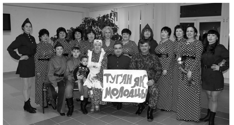
«Туган Як» - участники Битвы хоров.