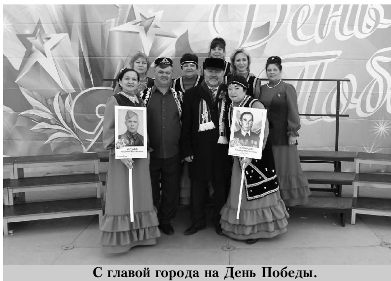
С главой города на День Победы.