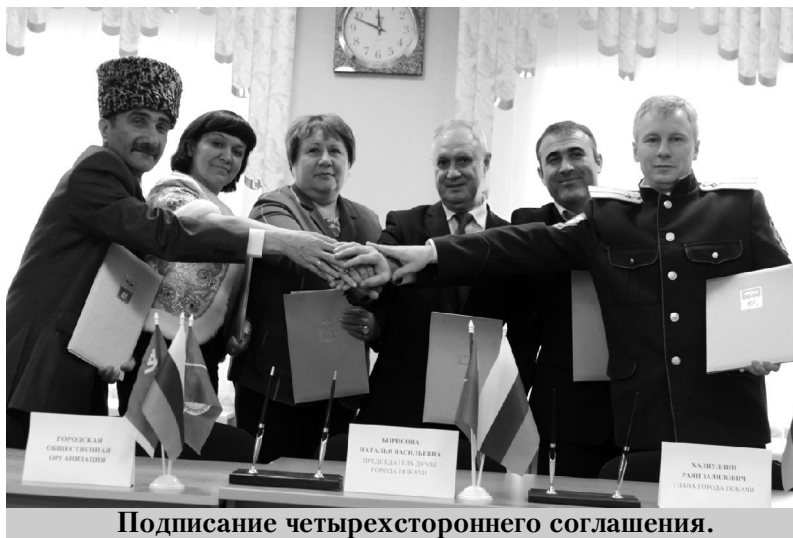
Подписание четырехстороннего соглашения.