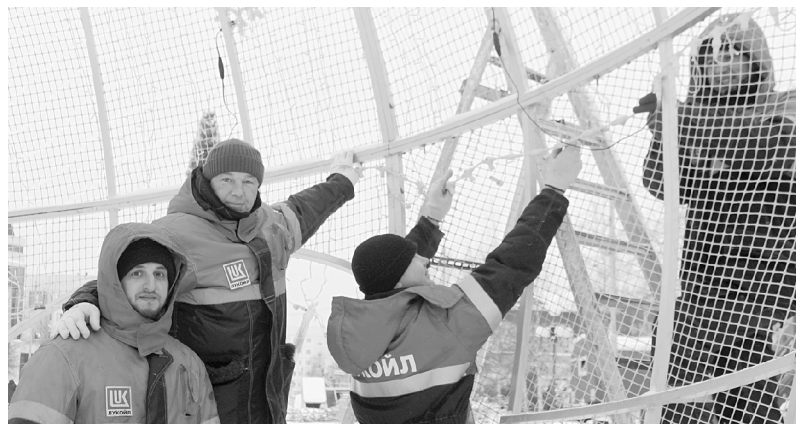
Ведутся работы по освещению шара.

7 декабря в школе №1 провели конкурсную программу «Наши права». Учащиеся 5-6 классов подготовили театрализованные представления, в которых рассказали о правах детей на примере сказочных персонажей.