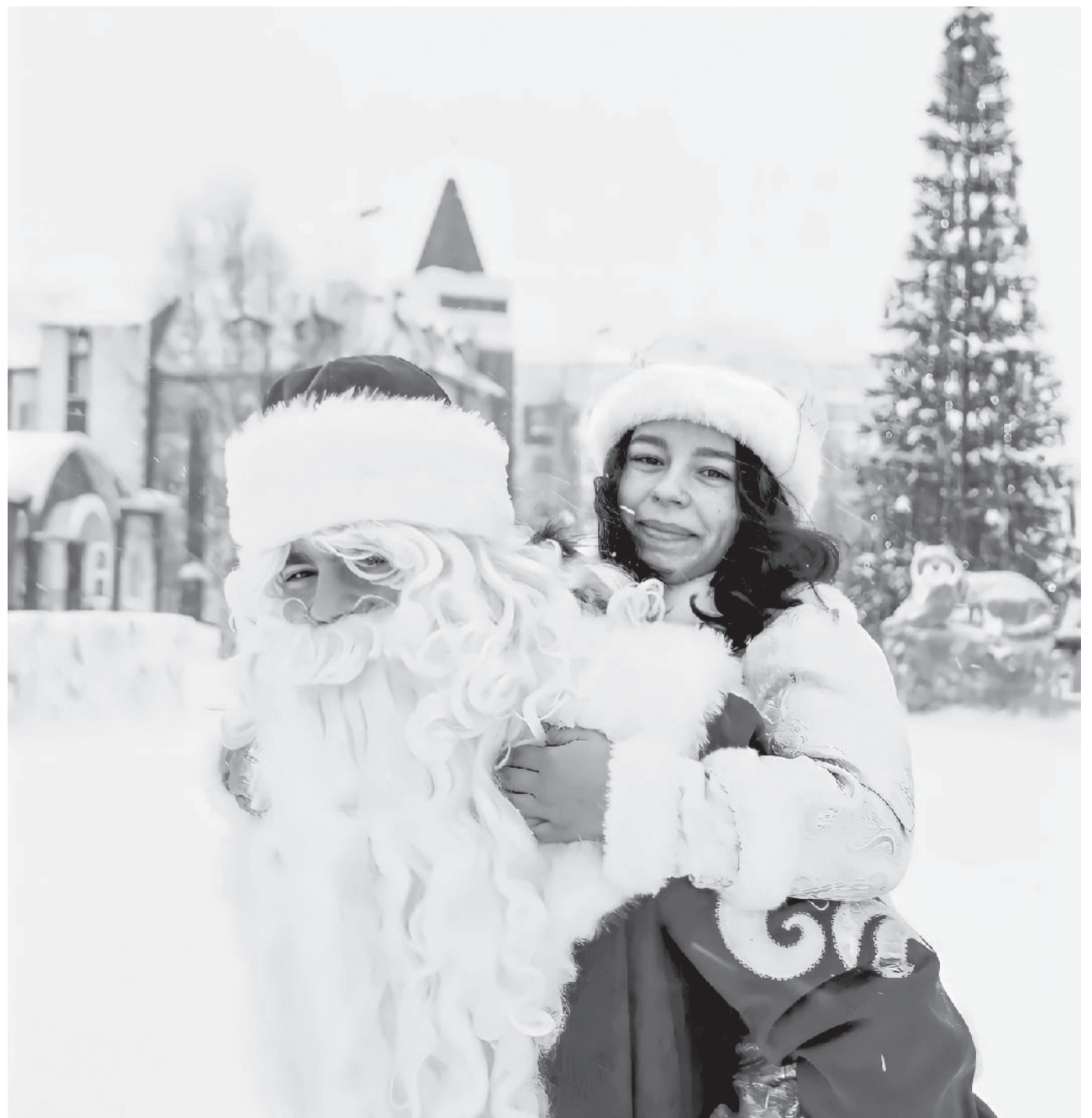
Новогоднее настроение уже царит в Покачах