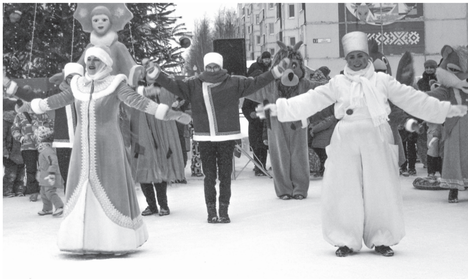
Открытие снежного городка - долгожданное событие