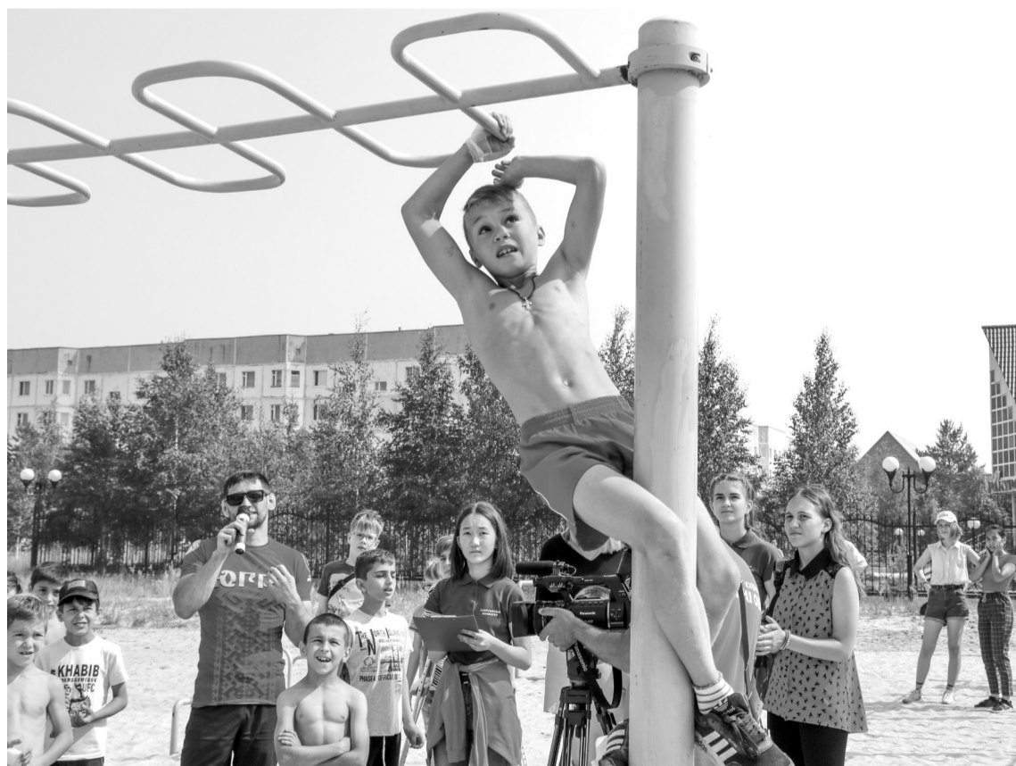
Площадки стрит воркаут во дворах города – один из способов приобщения к здоровому образу жизни

зафиксирован, когда у двоих жителей города были изъяты синтетические наркотики, у одного из них еще и наркотики растительного происхождения. Причем один из задержанных граждан раньше в поле зрения правоохранительных органов по таким вопросам не попадал. Кроме того, в ходе мероприятий, направленных на борьбу