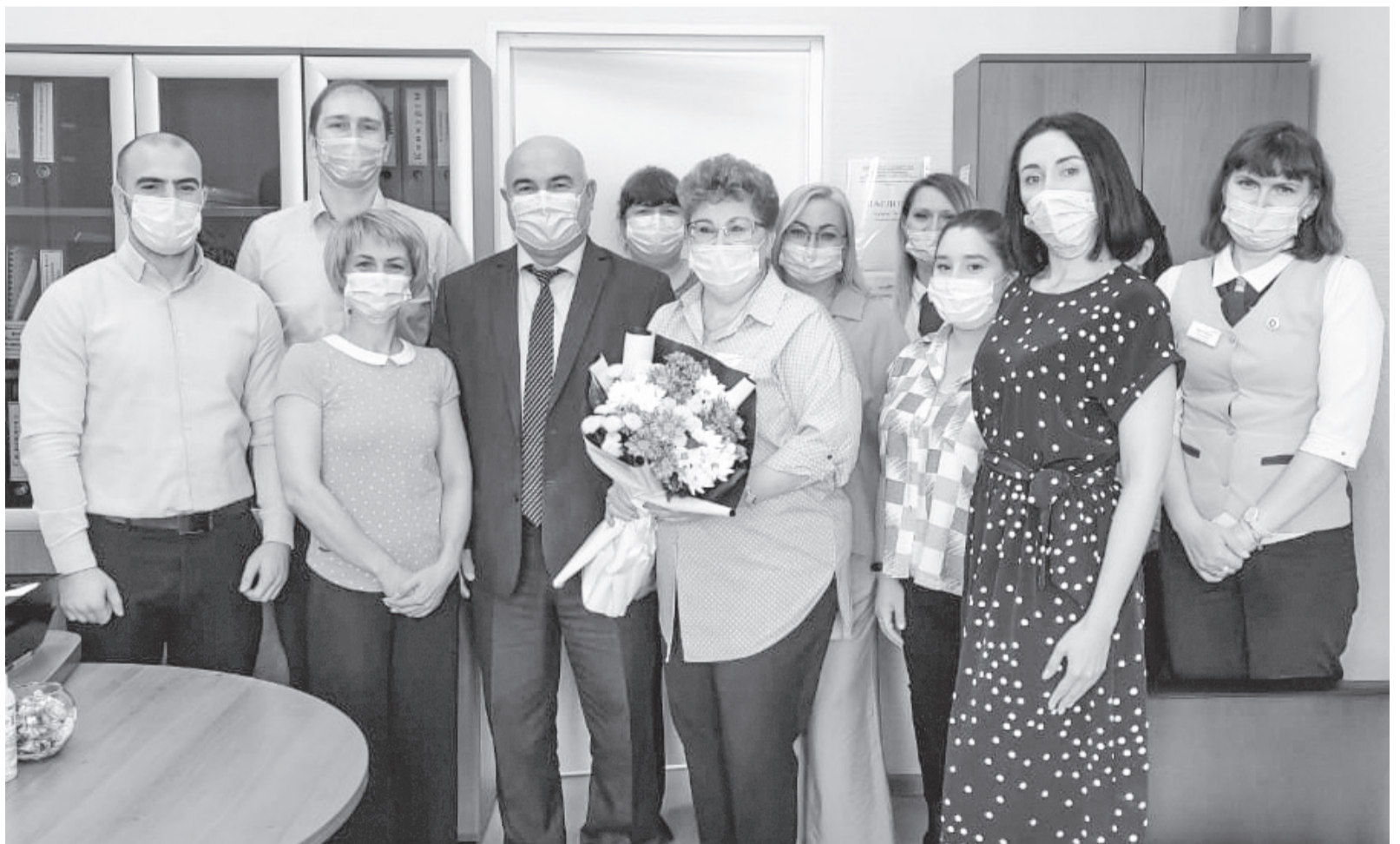
Глава города Покачи Владимир Степура поздравил коллектив филиала АУ ХМАО-Югры «Многофункциональный центр предоставления государственных и муниципальных услуг Югры» в городе Покачи

В МФЦ города Покачи работает 7 окон для приема заявителей, в том числе «Окно для бизнеса», существует система электронной очереди, что является максимально удобным для посетителей. Всего в многофункциональном центре нашего города предоставляется 285 услуг, 78 из которых –