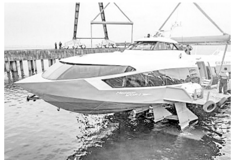
Торжественный момент спуска судна на воду