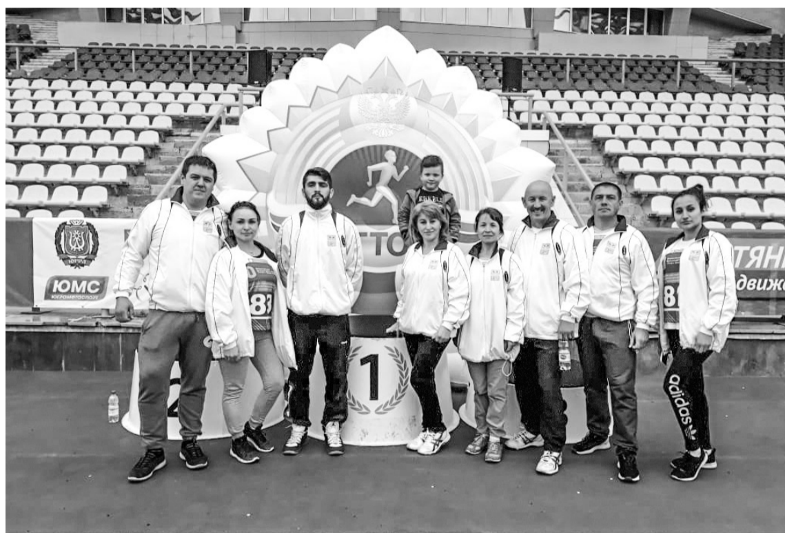
Развитие Всероссийского комплекса ГТО – профилактика наркотизации населения

Также один из последних фактов нарушения закона был