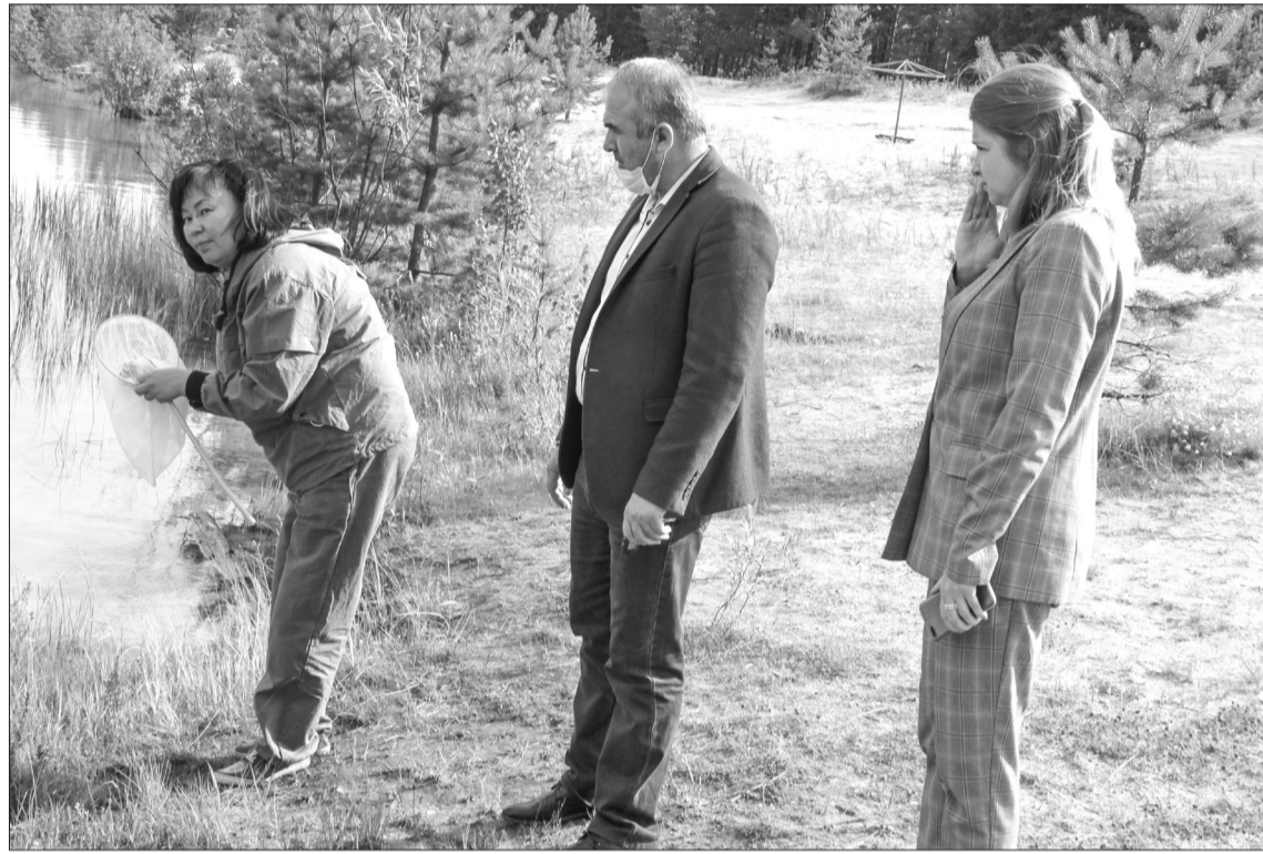
Энтомолог провела по специальной методике замер количества москитов и клещей на территории города Покачи

30 июля прошла проверка наличия и численности клещей и москитов на территории города Покачи