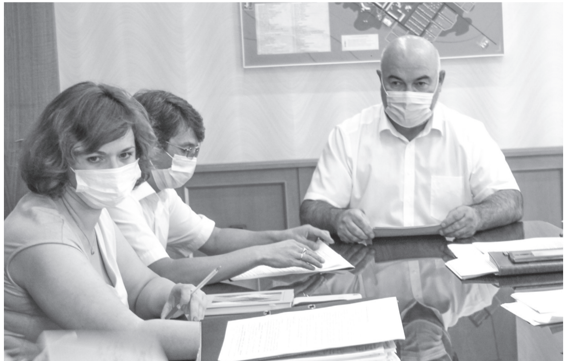
Заседание комиссии по предоставлению субсидий субъектам малого и среднего предпринимательства прошло под председательством главы города Владимира Степуры

щение части затрат на приобретение оборудования (основных средств) и лицензионных программных продуктов» предусмотрено 1 370 736, 84 руб. (окружной бюджет – 1302 200,00 руб., местный бюджет – 68 536,84 руб.).