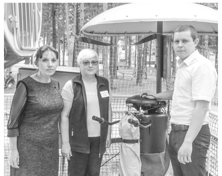
Чтобы понять эффективность так называемой ловушки для насекомых, ее работу испытывают в тестовом режиме

Использование ловушки для комаров проводится сейчас в тестовом режиме. Дело в том, что у городской администрации есть планы установить такие устройства на новом городском объекте «Теплый берег», который сейчас находится в стадии строительства. Он будет располагаться у водоема, и, следовательно, кровососущих насекомых там будет немало. Сейчас важно понять, насколько такие системы будут эффективны в покачевских условиях, рассчитать,