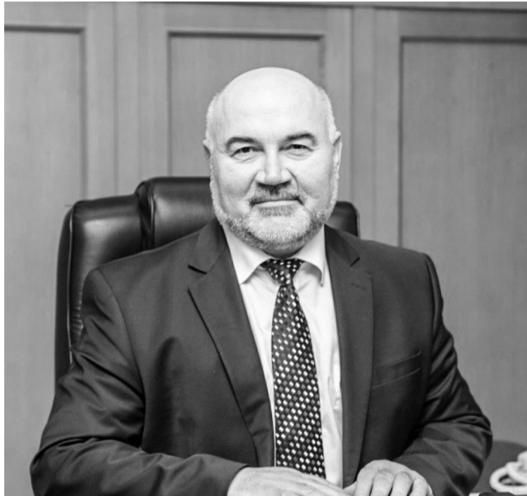
Глава города ответил на вопросы покачевцев

Чтобы вакцинироваться в Покачах, нужно обратиться в кабинет 106 городской больницы в рабочие дни с 08:00 до