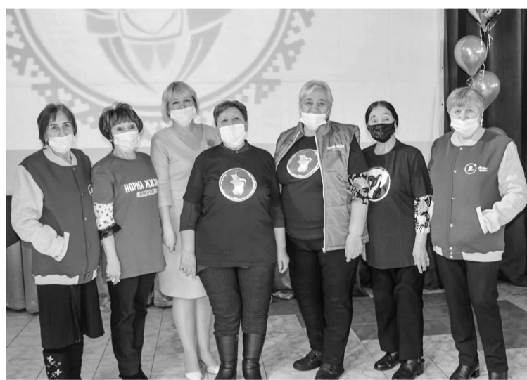
Серебряные волонтеры - участники новогодней недели добрых дел

Присутствующие в зале за просмотром видеоролика вспоминали лучшие моменты зимних вечеров. Пешие прогулки по городу с представителями