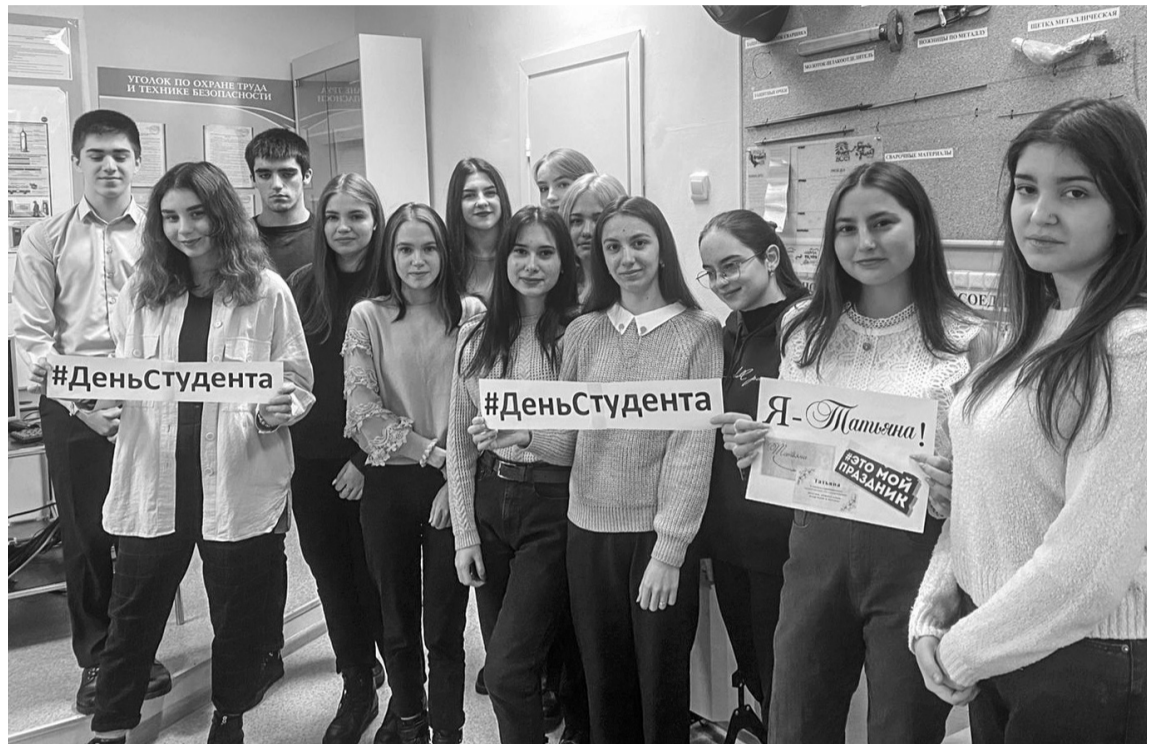
Студенты колледжа - активные, инициативные, талантливые, веселые и непоседливые

Волонтеры и лидеры студенческого самоуправления молодежного объединения «Профессионал» осуществили поздравительный рейд среди студентов Филиала колледжа, а также в рамках акции провели адресное поздравление студентов по имени Татьяна, вручили им вкусные подарки и сделали памятные фотографии под хештегом «#МЫВМЕСТЕ #студентыВМЕСТЕ».