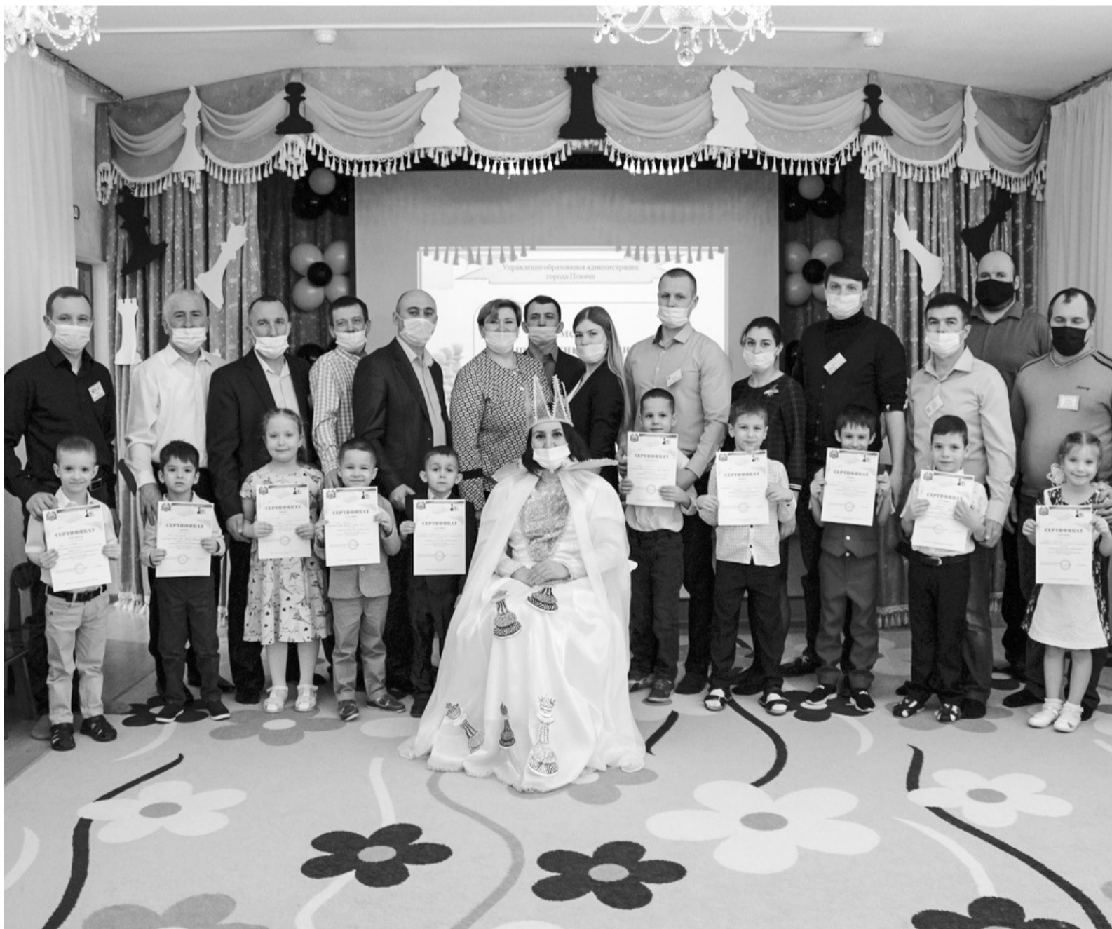
Все участники мероприятия сфотографировались на память с Королевой шахмат