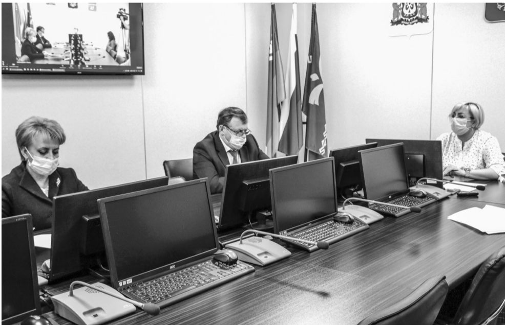
Через 6 месяцев после прививки от ковида необходимо сделать ревакцинацию

Самым эффективным методом по борьбе с новой коронавирусной инфекцией является коллективная иммунизация