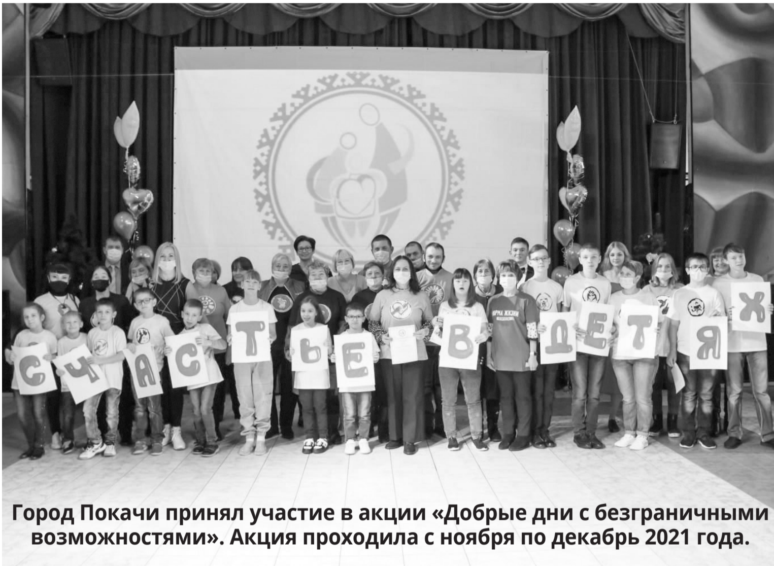
Город Покачи принял участие в акции «Добрые дни с безграничными возможностями». Акция проходила с ноября по декабрь 2021 года.