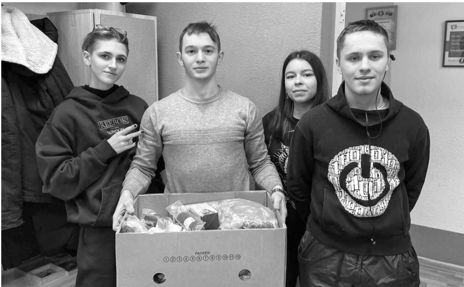
Волонтеры медицентра «Таймер» передают продукты от спонсора в приют

Метель разыгралась не на шутку. Мело несколько дней подряд