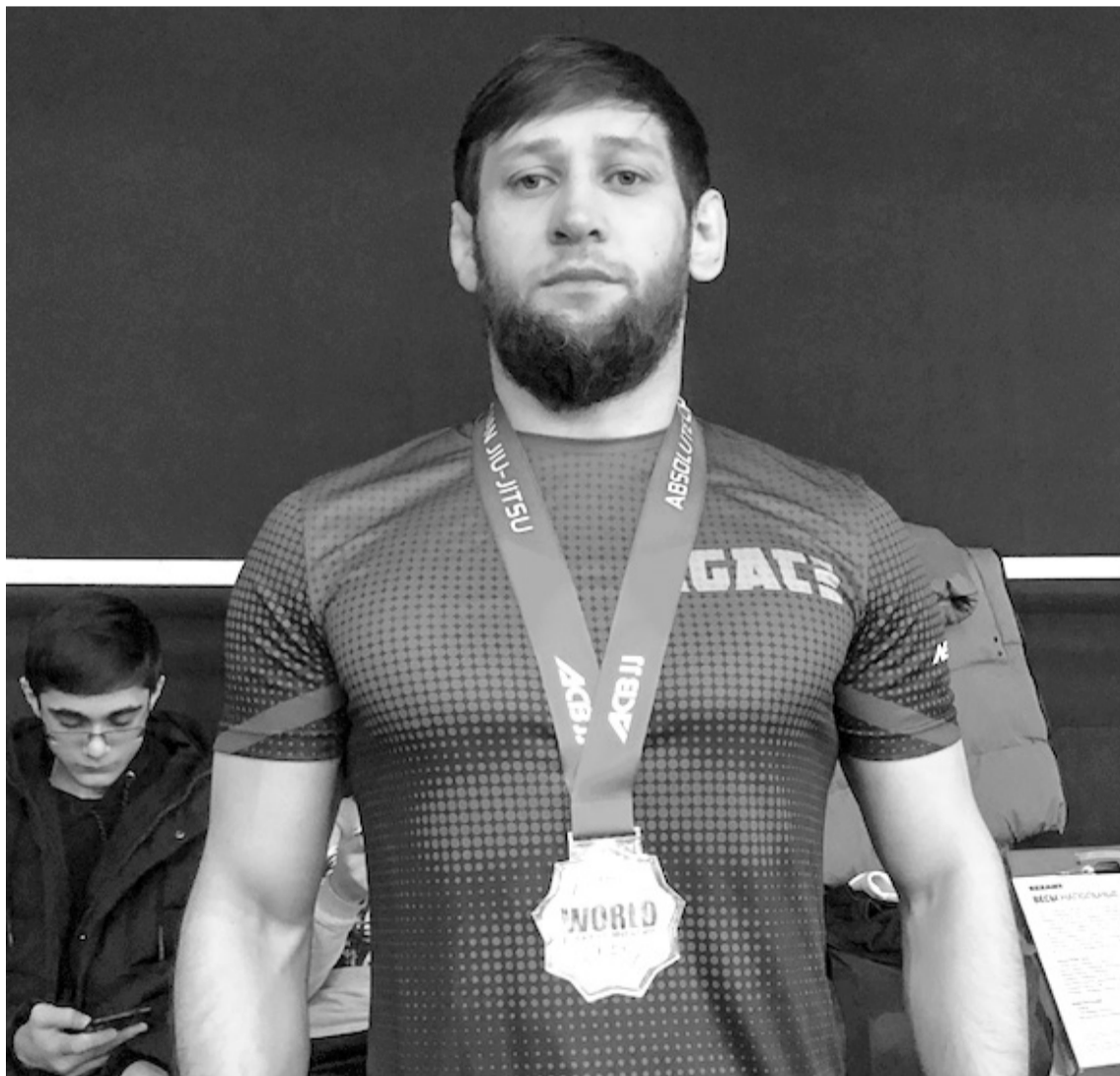
Магомед Раджабов - четырехкратный чемпион мира по джиу-джитсу

Покачевские спортсмены показали высокий уровень подготовки на Чемпионате мира