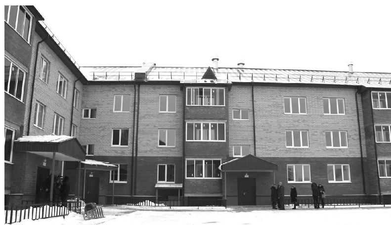
Так выглядит ул. Харьковская сейчас

оны. До 2019 года закроют вопрос с балками ещё в пяти — Нефтеюганском районе, городах Пыть-Ях, Нягань, Нефтеюганск, Мегион.