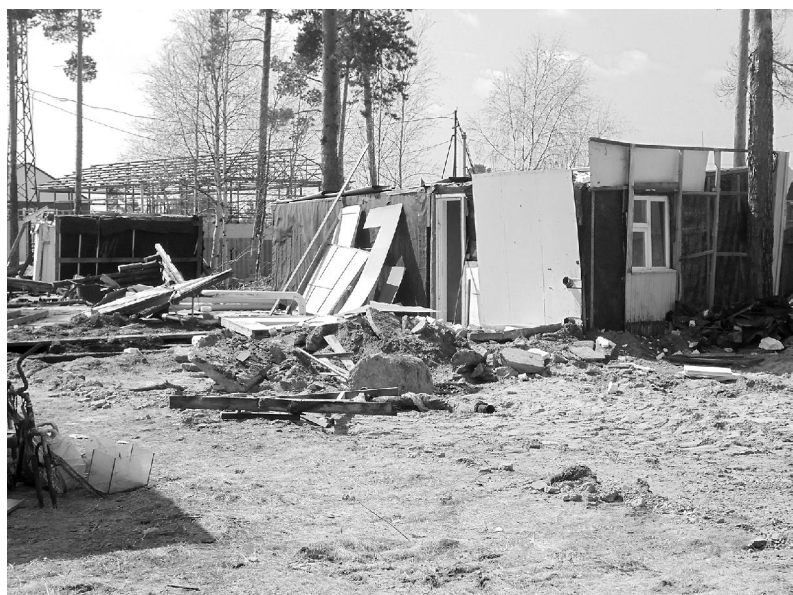
Снос балков шёл полным ходом

Начиная с 2012 года осуществляется реализация мероприятий по ликвидации и расселению приспособленных для проживания строений и ежемесячный мониторинг количе-