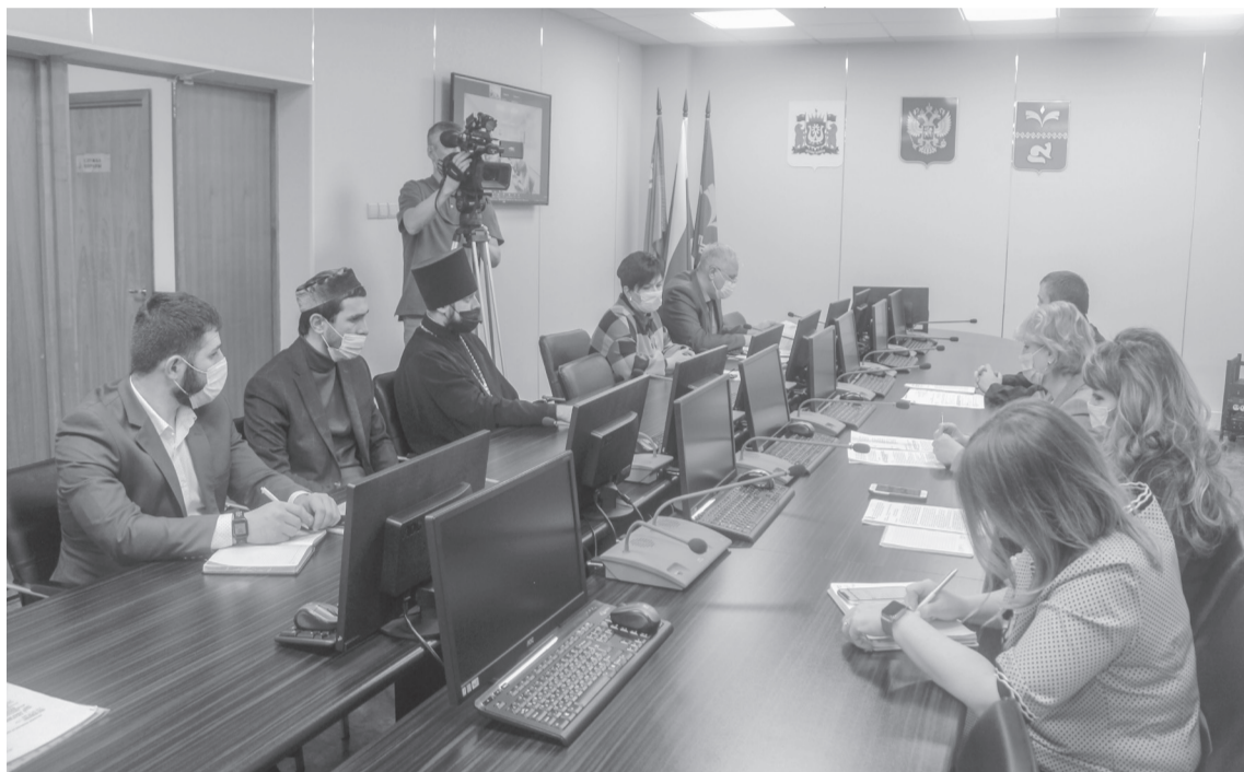
■ Комиссия обсудила важные вопросы