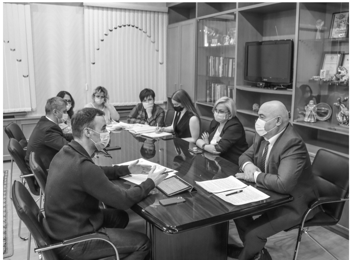
На встрече обсудили спортивную жизнь города

«Данная система разрабатывалась как важный информационный помощник в работе. Я полагаю, что все участники информационной системы оценят удобство и ту легкость, которая должна