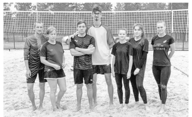
В Покачах прошел турнир по пляжному волейболу в честь Дня физкультурника

Соревнования прошли в теплой дружеской атмосфере.