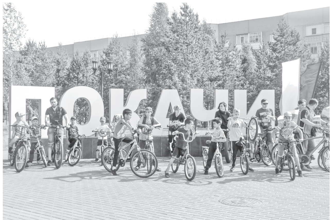
В честь Дня Государственного флага России был организован велопробег

22 августа в День Государственного флага Российской Федерации в Покачах прошли праздничные мероприятия, посвященные этому важному событию