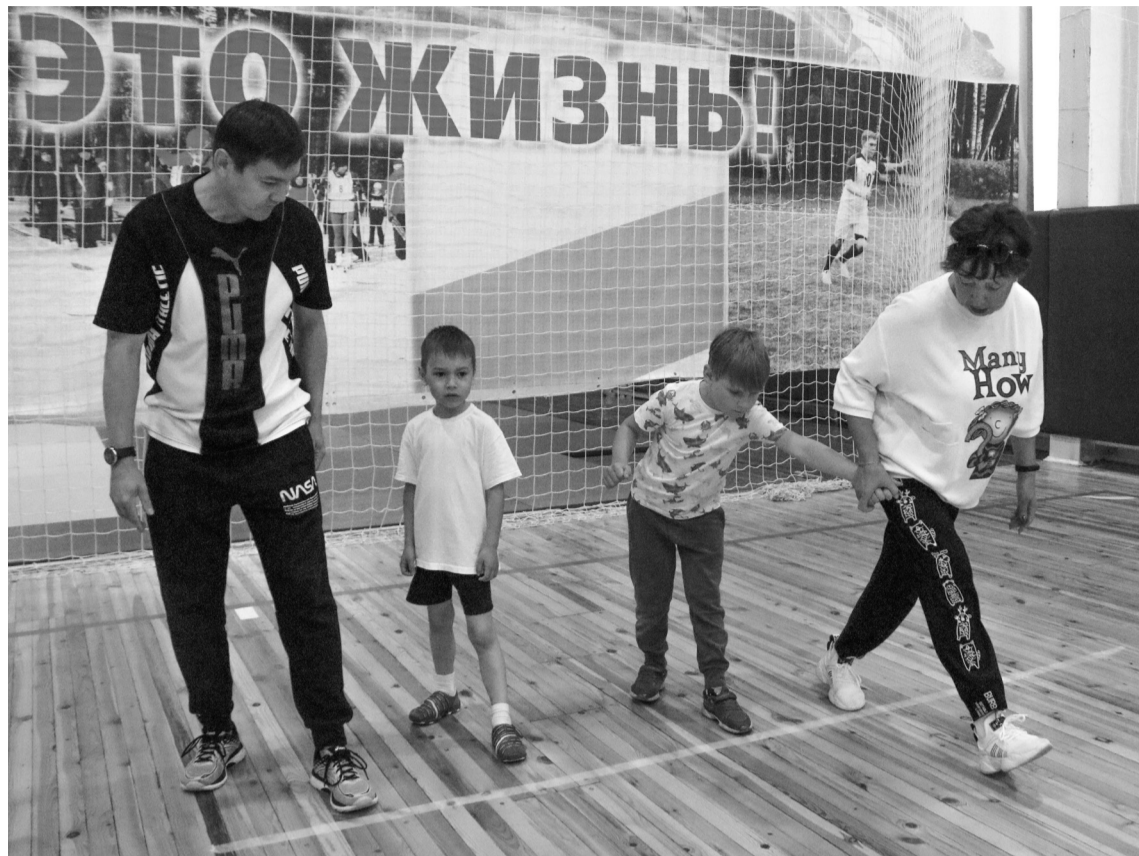
Родители и наставники давали советы, как правильно выполнять задание ФОТОГАЛЕРЕЮ СМОТРИТЕ В СЕТЕВОМ ИЗДАНИИ «ПОКАЧИИНФОРМ»

Телефоны: 8 (34632) 59765, 8 (34632) 59752, сайт: lnrc.ru , эл. почта: onrc@mail.ru , факс: 8 (34632) 59770.