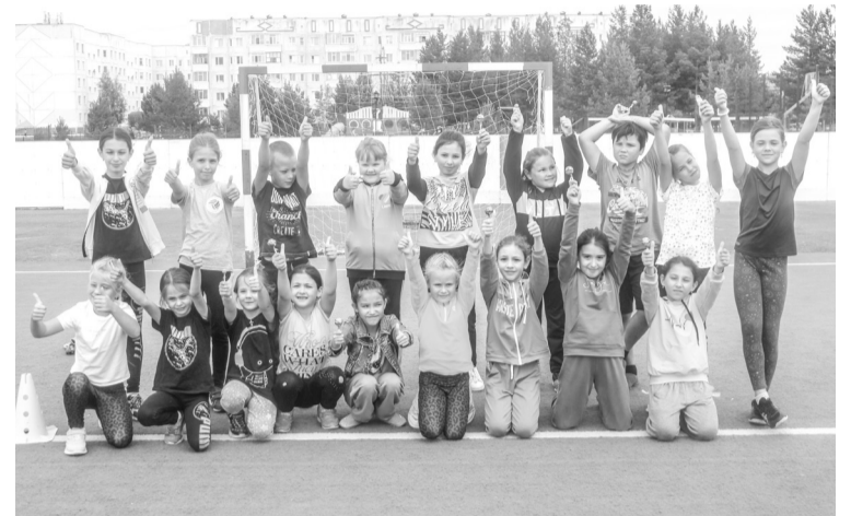
Все участники получили сладкие призы и хорошее настроение

В конкурсе «Поставь рекорд ко Дню физкультурника» дети ставили рекорды по прыжкам на скакалке. Все участники получили сладкие призы и хорошее настроение.