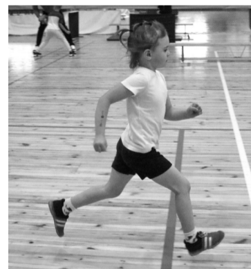
Челночный бег - это бег на короткое расстояние с постоянной сменой направления между двумя точками

посвященные 90-летию создания Всероссийского физкультурно-спортивного комплекса «Готов к труду и обороне».