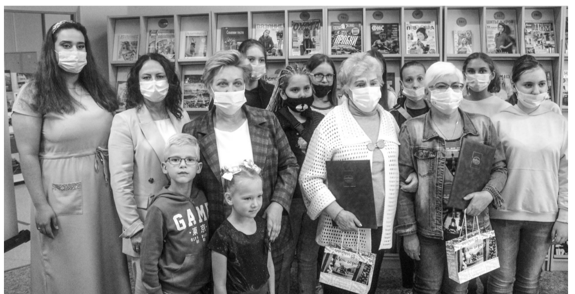
Участники мероприятия сфотографировались на память

«Мы приехали в Нижневартовск, там шел набор в Покачи,