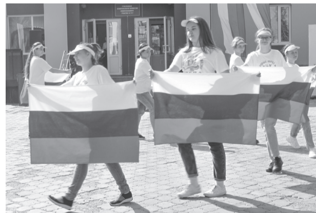
Флешмоб «Гордо реет флаг России» прошел возле арт-объекта «Буквы ПОКАЧИ» и возле ДК «Октябрь»

Главным атрибутом флешмоба стал, конечно же, флаг Российской Федерации. После музыкального выступления участники велопробега встали на старт и проехали дистанцию вокруг города. Многие участники проехали с флагами РФ.