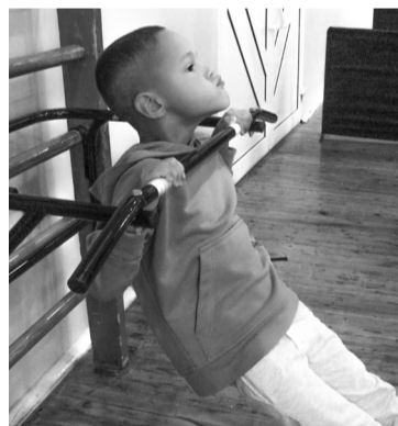
Подтягивание на нижней перекладине – один из 7 видов, которые надо было сдать на нормативы ГТО