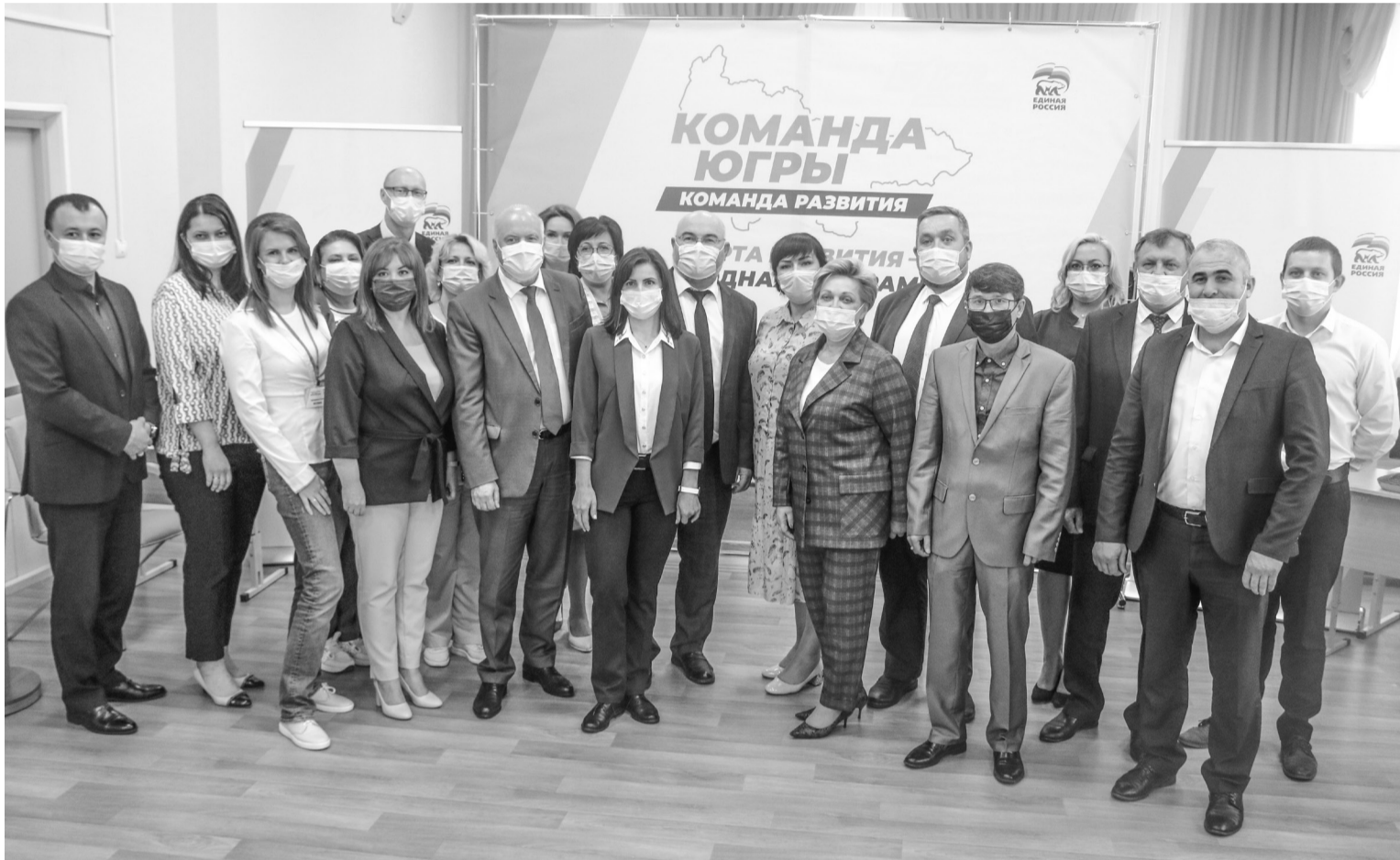
Участники форума сфотографировались на память

20 августа в Детской школе искусств прошел муниципальный форум «Команда Югры»