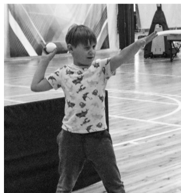
Метание теннисного мяча в цель

В честь Дня физкультурника в КСК «Нефтяник» прошел прием нормативов ГТО для всех желающих