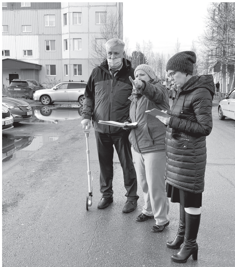
Инвентаризация дворов позволит определить, где требуется ремонт в первую очередь

Источники информации: Паблик «ВКонтакте» администрации города «Покачи»