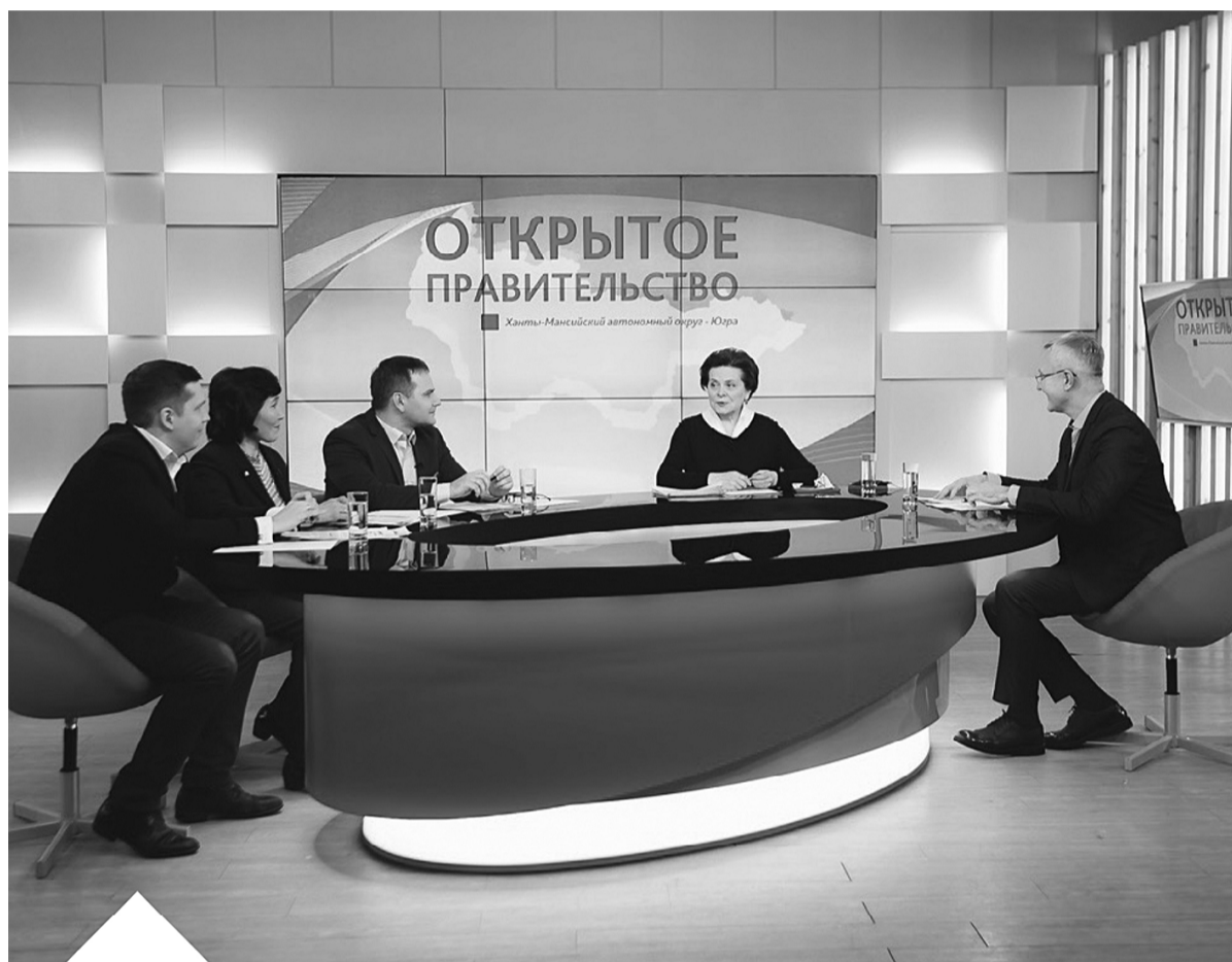
Вопросы губернатору задавали главные редакторы региональных СМИ – ОТРК «Югра», ГТРК «Югория» газеты «Новости Югры», объединенной редакции газет «Ханты ясан» и «Луима сэрипос».

Полагаю, в отношении объемов добычи есть другие возможности, кроме энергетики, использования этих ценных ресурсов, и мы должны думать в том числе и о них. Поддержку инновационную составляющую. Когда я встречаюсь с молодыми учеными, то подчёркиваю: начинаете, мыслите креативно, находите возможности, чтобы наше основное богатство – сырьё – можно было использовать в самых разных, неожиданных ракурсах. На сегодняшний день это основной источник формирования доходной базы, богатства региона и Российской Федерации. Если к этому относиться таким образом, то нужно учитывать все тенденции рынка энергетики, способы фор-