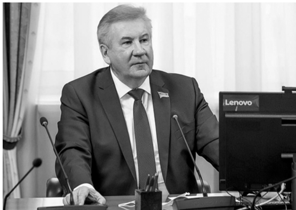
Процедура пройдет только в режиме онлайн в большинстве регионов страны

Отказ в регистрации получили 95 человек. Семь из них после устранения недостатков повторно подали документы в оргкомитет и стали кандидатами. Основными причинами для отказа стали неполные пакеты документов, попытка выдвинуться сразу по нескольким одномандатным округам или предоставление недостоверной информации. Кроме того, у некоторых из кандидатов оказались непогашенные судимости или иностранные финансовые активы. Большинство желающих принять участие в процедуре