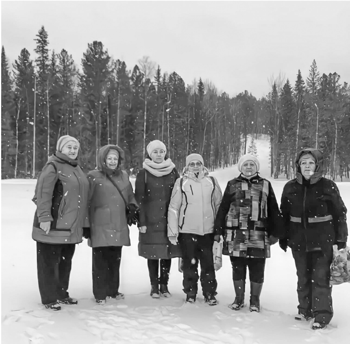
Участницы клуба «Активная жизнь» побывали на «Урмане».

Клуб «Активная жизнь» в Покахачах возобновляет встречи в режиме офлайн