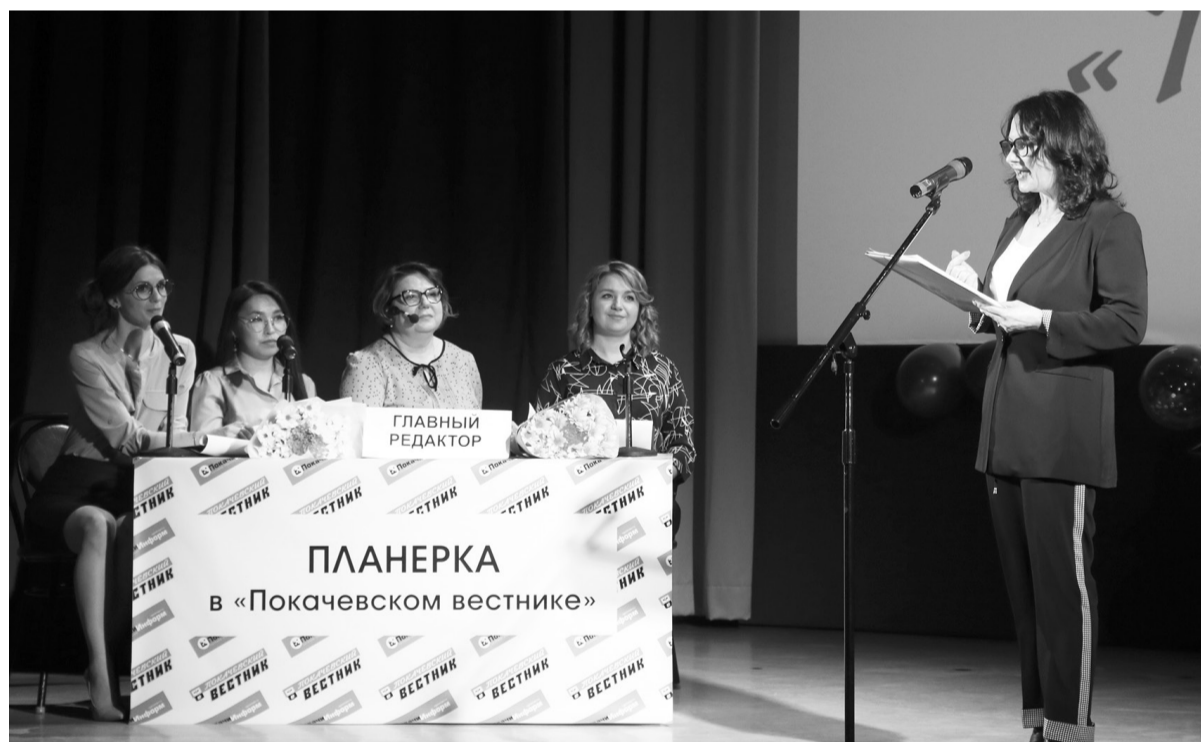
Коллектив принимает поздравления

В Доме культуры «Октябрь» состоялось официальное мероприятие в честь тридцатилетнего юбилея газеты «Покачёвский вестник»