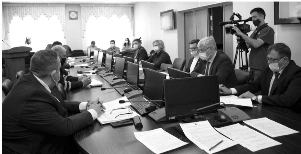
Комиссия по БДД решила провести работу по разработке и согласованию проекта реконструкции линии освещения по ул. Дорожной

По первому вопросу «О принимаемых мерах по совершенствованию организации дорожного движения на территории города Покачи» комиссия приняла решение рекомендовать руководителям автотран-