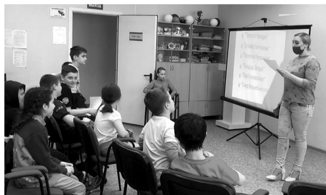
В городской библиотеке прошла неделя детской и юношеской книги

На каждой из станций участникам нужно было выполнить задание. В задании, в котором нужно было соотнести произведение и автора, ребята показали хорошее знание литературы. Творческие и даже актерские способности понадобились им, чтобы показать с помощью пантомимы