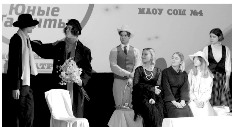
Спектакль по пьесе А.Чехова «Вишневый сад». Выступление старшей группы на конкурсе «Юные таланты» в 2020 году (первое место) и с ним же на фестивале «Дух огня»

редадут эстафету нынешним семиклассникам, которые и станут старшим составом. А в младшей группе теперь останутся ребята, которые дебютируют в мае с нашим новым спектаклем, они учатся сейчас во 2-3 классах.