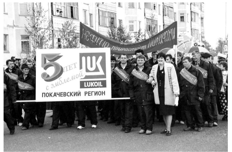
Листаем страницы истории