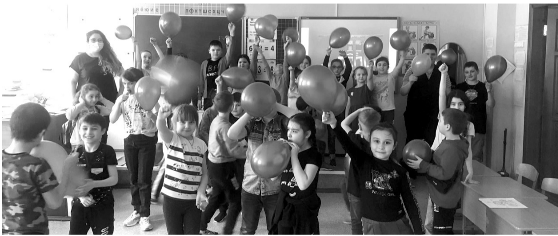
Воспитанники лагеря «Улыбка» надули синие шары в знак поддержки людей, страдающих аутизмом