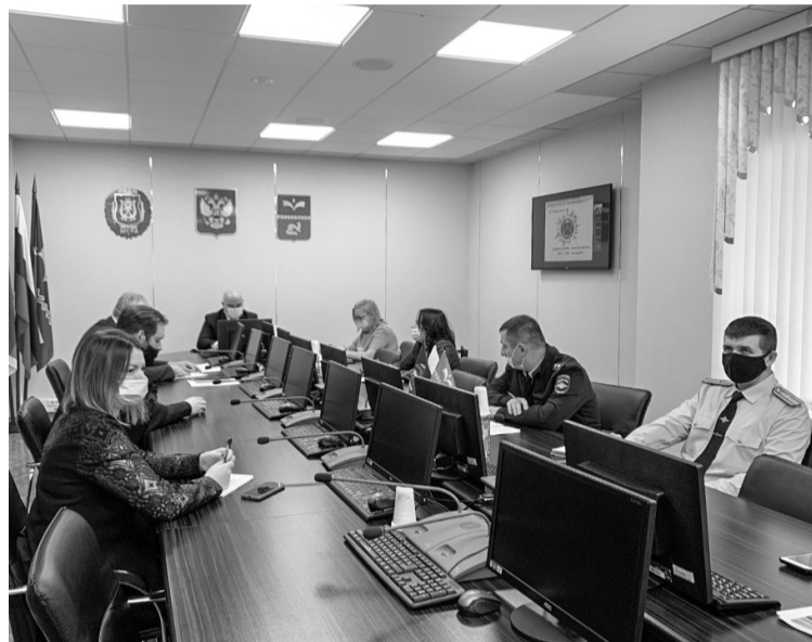
На заседании комиссии по профилактике правонарушений в городе Покачи

Также проведён ряд бесед на темы: «Профилактика дистанционных краж и мошенничества», «Ответственность за распространение идей экстремизма и терроризма в молодежной среде», «Терроризм – угроза обществу», «Уголовная и административная ответственность за совершение преступлений и правонарушений», «Правила поведения в общественных местах в период новогодних праздников», «О недопустимости употребления и распространения психоактивных веществ», «Ответственность несовершеннолетних за участие в несанкционированных митингах, шествиях, распространение литературы экстремистского толка, за груп-