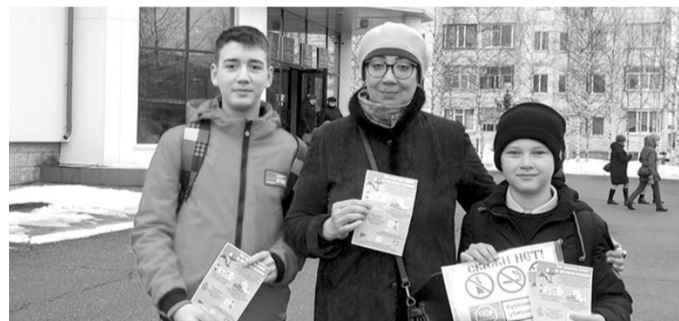
Ученики школы №2 раздали памятки на тему здорового образа жизни

Всемирный День здоровья отмечается с 1950 года. Эта дата не случайна, именно 7 апреля в 1948 году начала свою работу Всемирная организация здравоохранения. Каждый год выби-