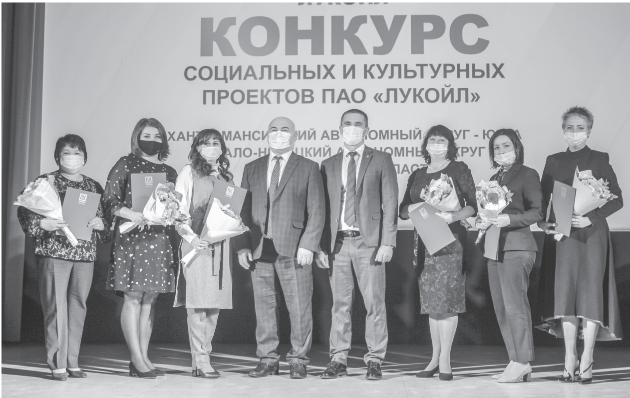
В 2021 году из 20 покачевских проектов 6 награждены грантами ПАО «ЛУКОЙЛ»

8 декабря в Доме культуры «Октябрь» состоялась торжественная церемония награждения победителей конкурса социальных и культурных проектов ПАО «ЛУКОЙЛ»