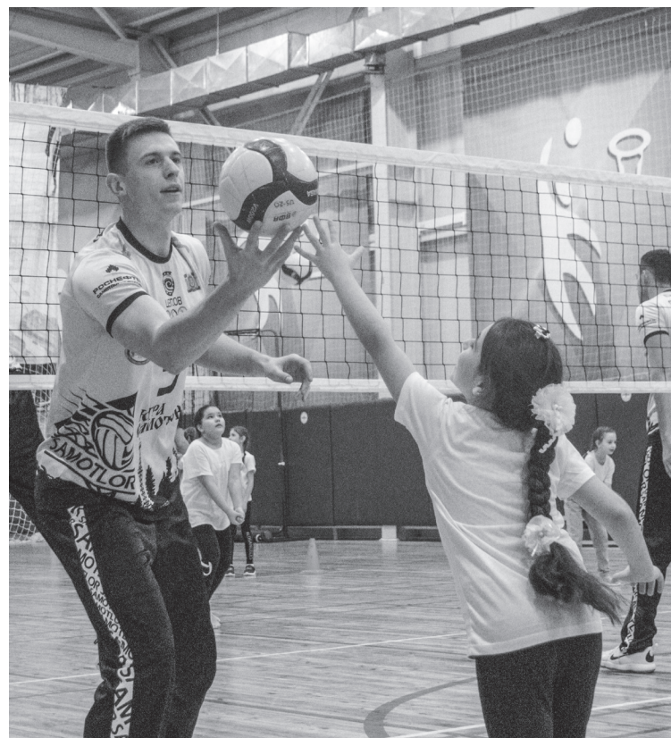
■ Игроки волейбольной команды «Югра-Самотлор» провели мастер-класс для юных покачевских спортсменов

Мастер-классы прошли на высочайшем уровне. Ребята получили огромный заряд положительных эмоций и позитивный настрой, а также отметили большую пользу от приобретенного опыта.