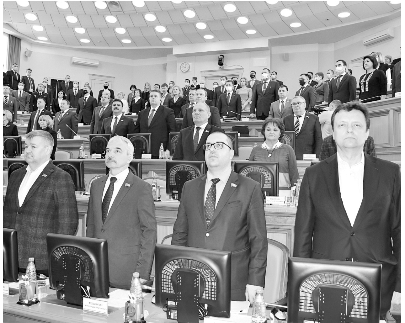
Заседание Думы Югры в Ханты-Мансийске