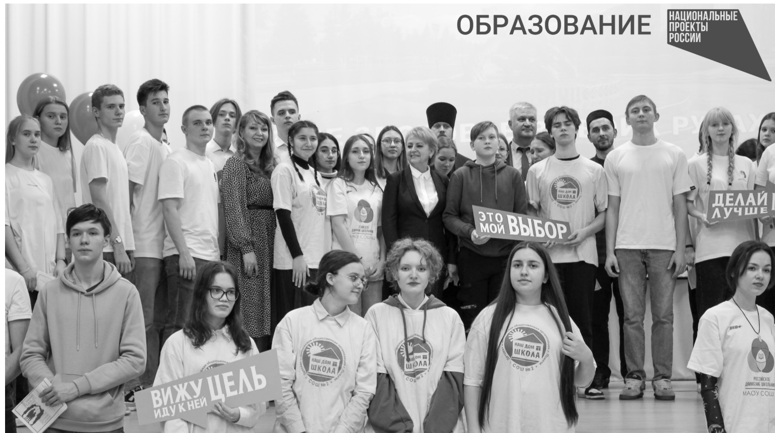
Участники мероприятия сфотографировались на память

В Покачах проходит антинаркотическая декада «Твоё здоровье в твоих руках»