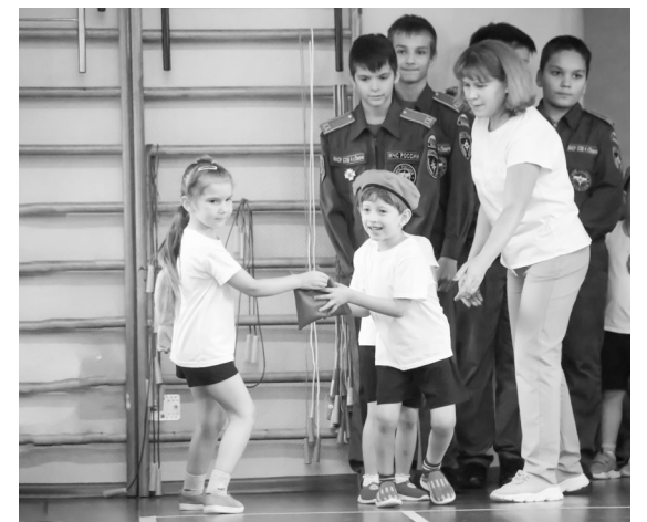
📍 После напутствующих слов и пожеланий удачи участникам спортивно-патриотического мероприятия начались соревнования с преодолением полосы препятствий