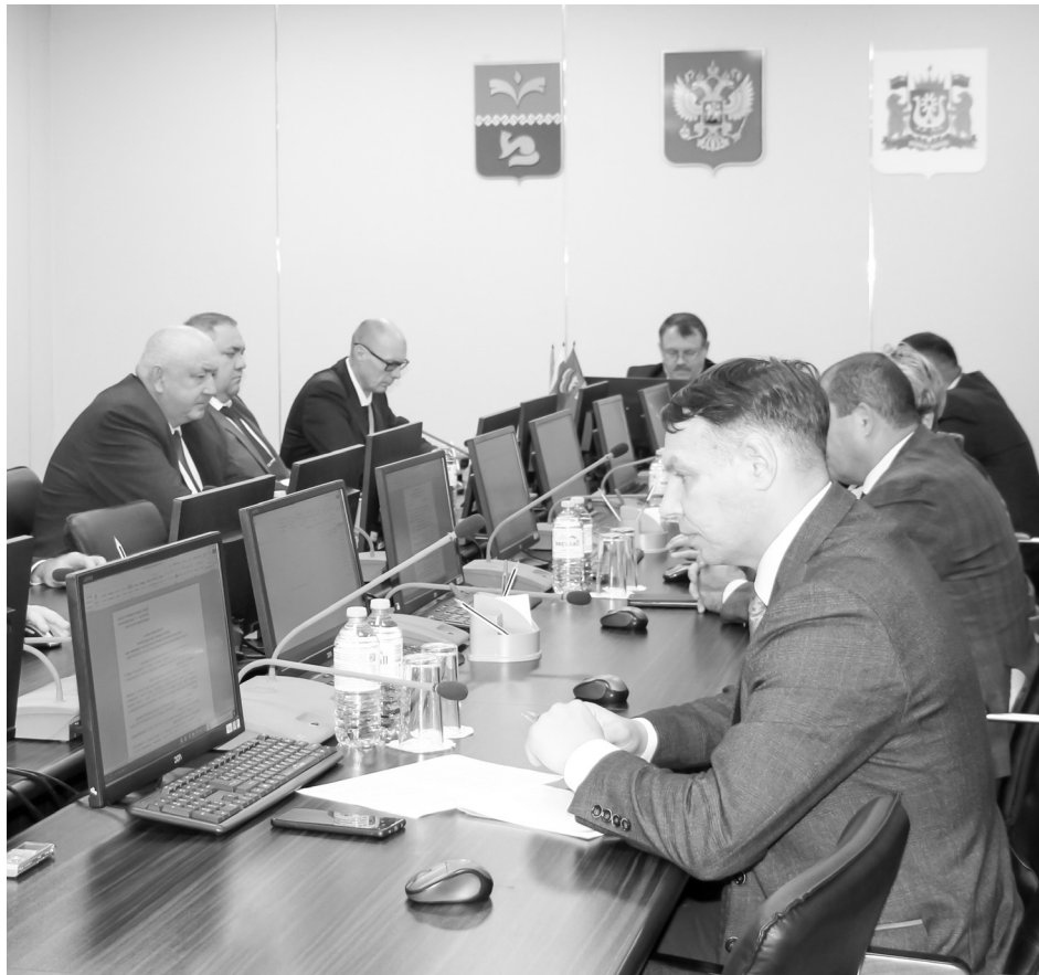
Депутаты заслушали информацию о готовности жилищно-коммунального хозяйства к работе в осенне-зимний период 2022-2023 годов и об исполнении в Покачах в текущем году программы капитального ремонта

Такая мера прежде всего была вызвана необходимостью обеспечения чистоты на придомовых территориях. Од-