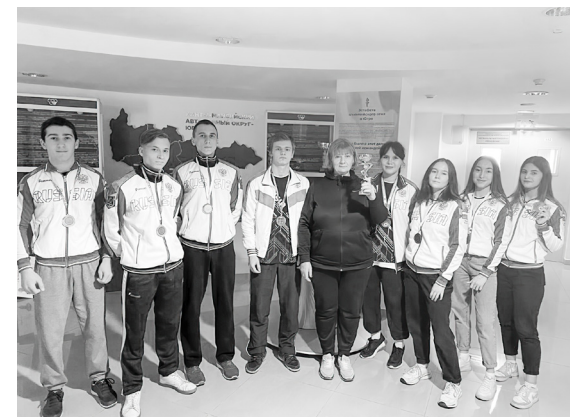
Команда Лангепасского политехнического колледжа - бронзовый призер второго регионального этапа фестиваля Всероссийского физкультурно-спортивного комплекса «Готов к труду и обороне» - «Игры ГТО»

Желаем вам дальнейших спортивных успехов и достижений! Будьте здоровыми, крепкими, выносливыми и физически развитыми!