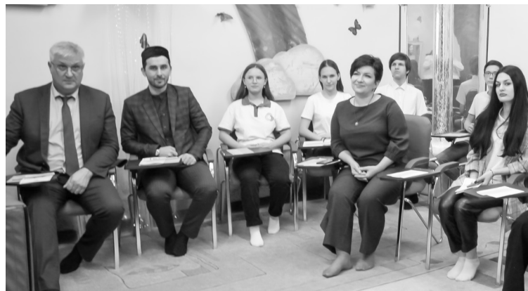
На воркшоп-площадке «Зарядись позитивом!»