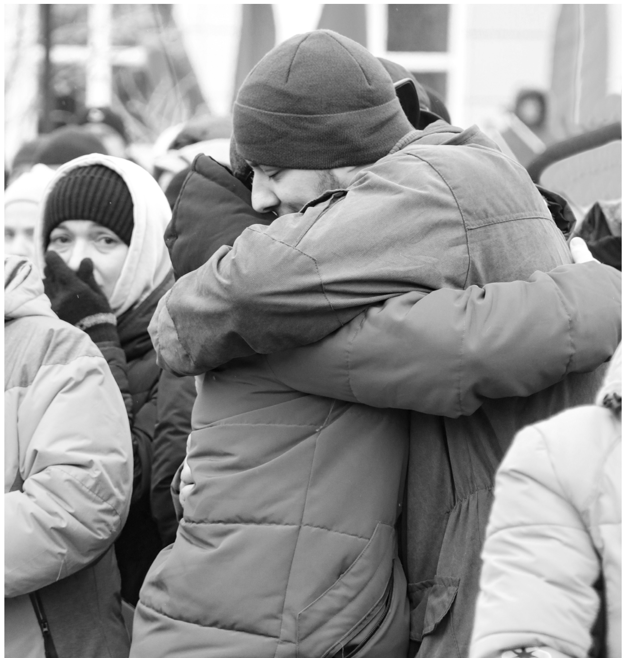
Провожающие желали ребятам поскорее вернуться с победой, живыми и здоровыми

А мы вас будем ждать. В добрый путь, ребята!