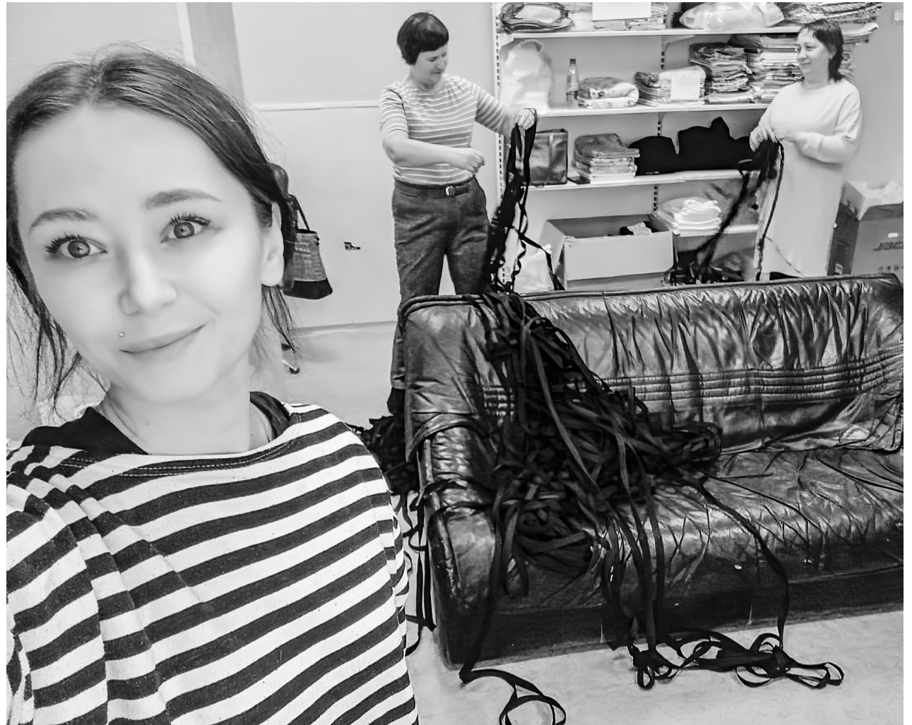
Покачевские рукодельницы в процессе изготовления носилок

P.S. С момента начала мобилизации покачевские мастерицы связали и отправили более 100 пар носков для защитников из нашего города.