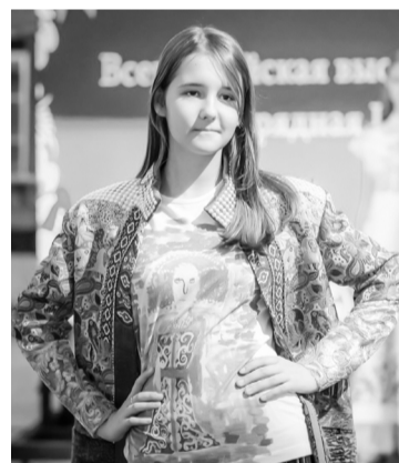
☑ Красоту национальных костюмов из разных регионов страны продемонстрировали на выставке-дефиле «Нарядная Россия»