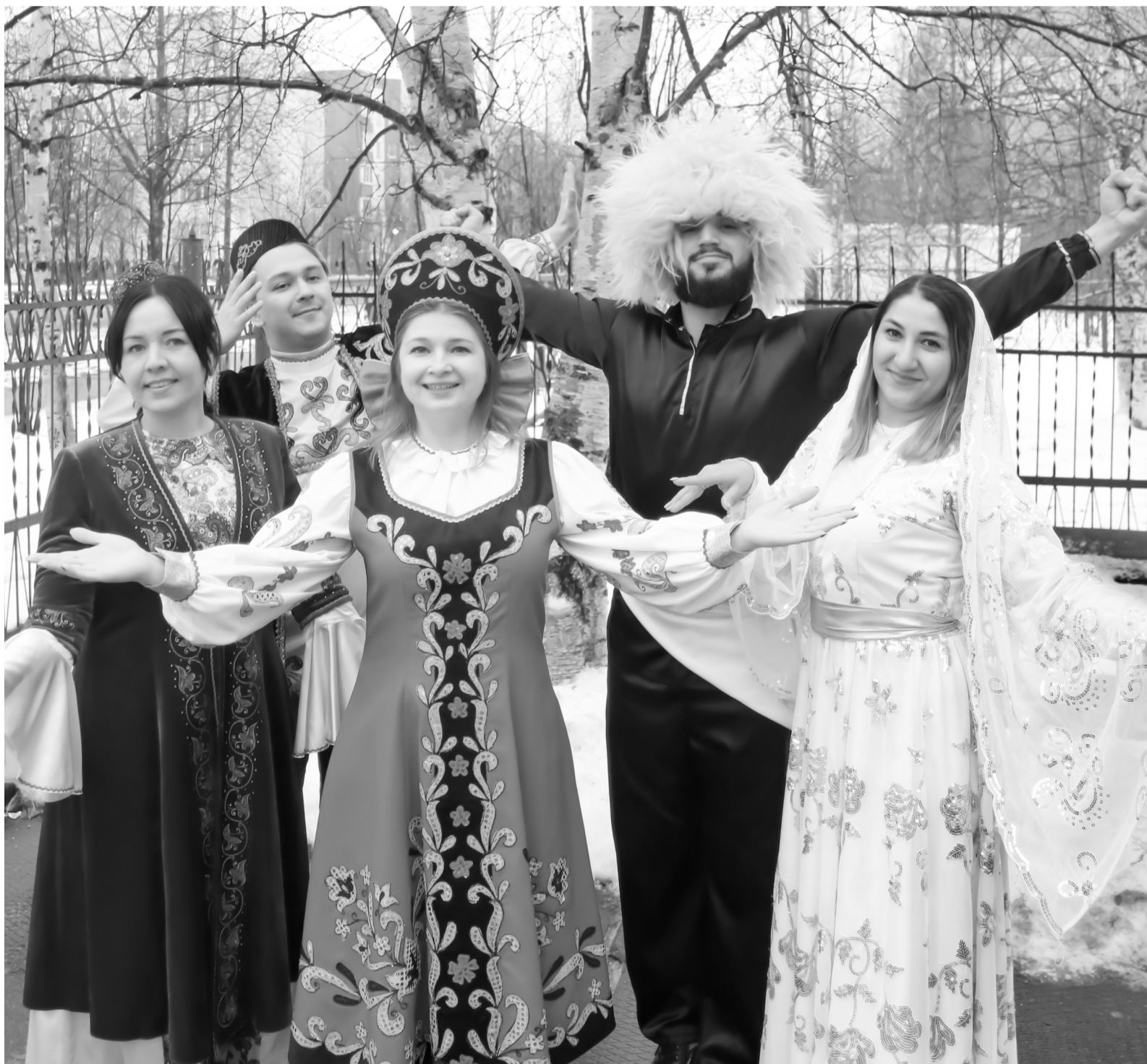
В наши дни актуальность праздника не утратила силу

В честь Дня единства 4 ноября в России проходят праздничные концерты, шествия, благотворительные акции и другие мероприятия, призванные показать, что мы должны быть единым, сплоченным народом, способным выстоять вместе в любых испытаниях.