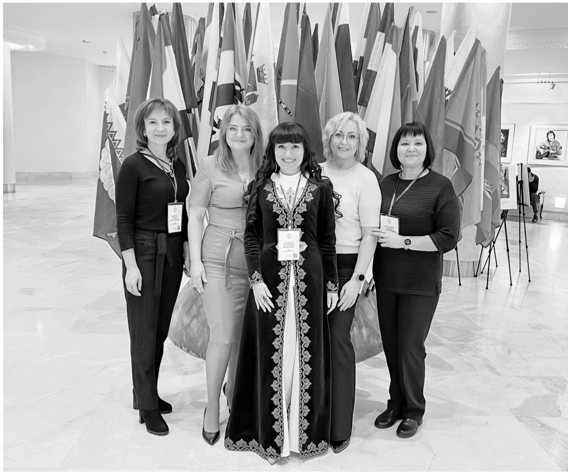
☑ Делегация города Покачи на форуме

На открытии форума было зачитано приветствие Магомедсалама Магомедова – заместителя руководителя Администрации Президента России, ответственного секретаря Совета по межнациональным отношениям при Президенте РФ. Он выразил уверенность, что форум откроет новые имена, позволит выявить лучшие практики, будет способствовать укреплению общего гражданского единства многонационального народа России в условиях современных вызовов, включая