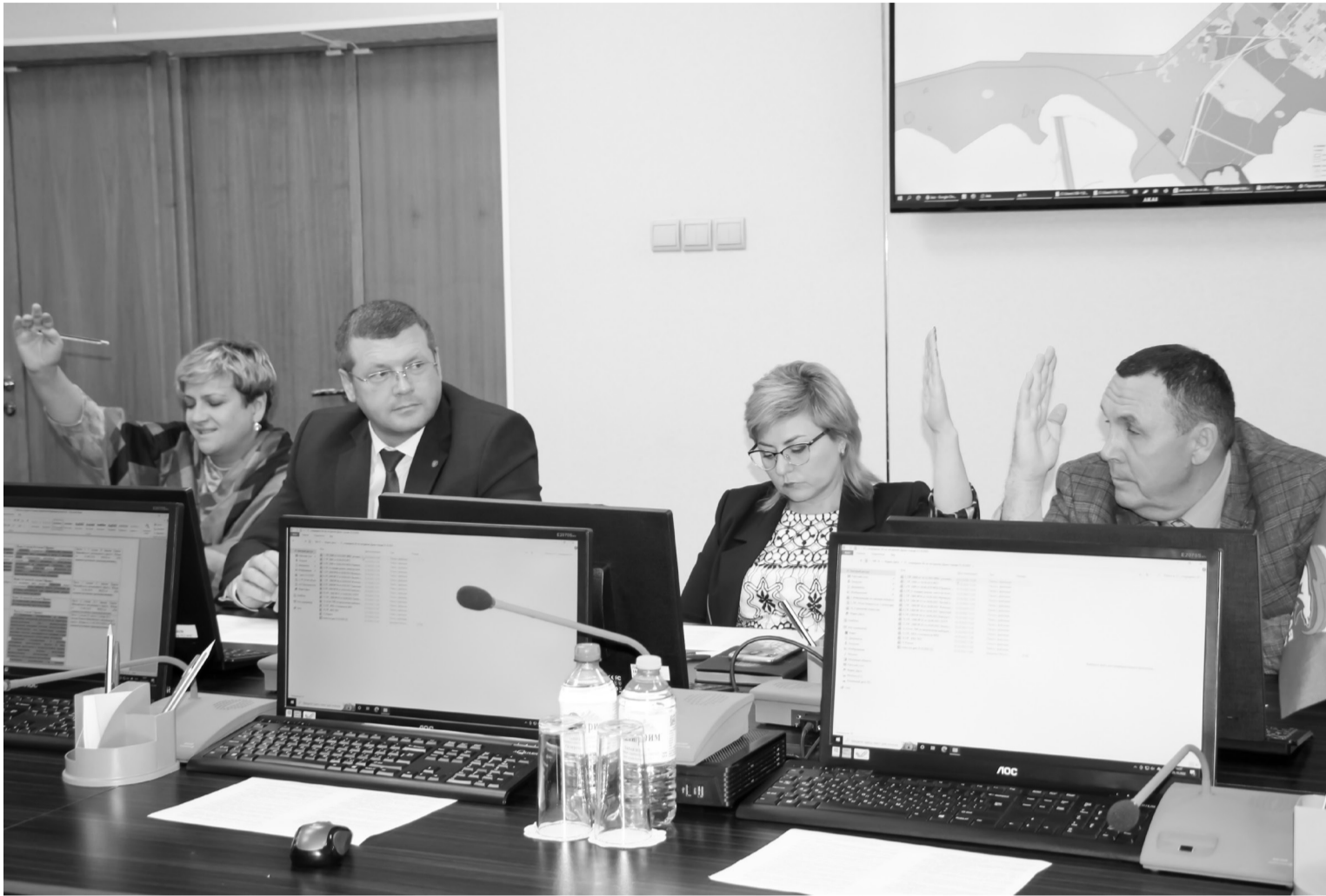
Решения Думы принимаются по результатам голосования депутатов