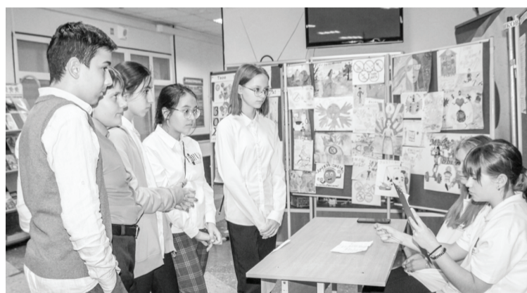
Ребята с удовольствием приняли участие в квесте

Зачастую люди, употребляющие наркотики, перестают быть продуктивными членами общества. Наркомания разрушает семью, а ведь крепкая семья является основой существования