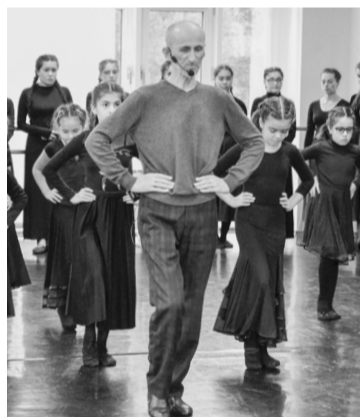
☑ На форуме участники познакомились с техникой и особенностями традиционных танцев народов России