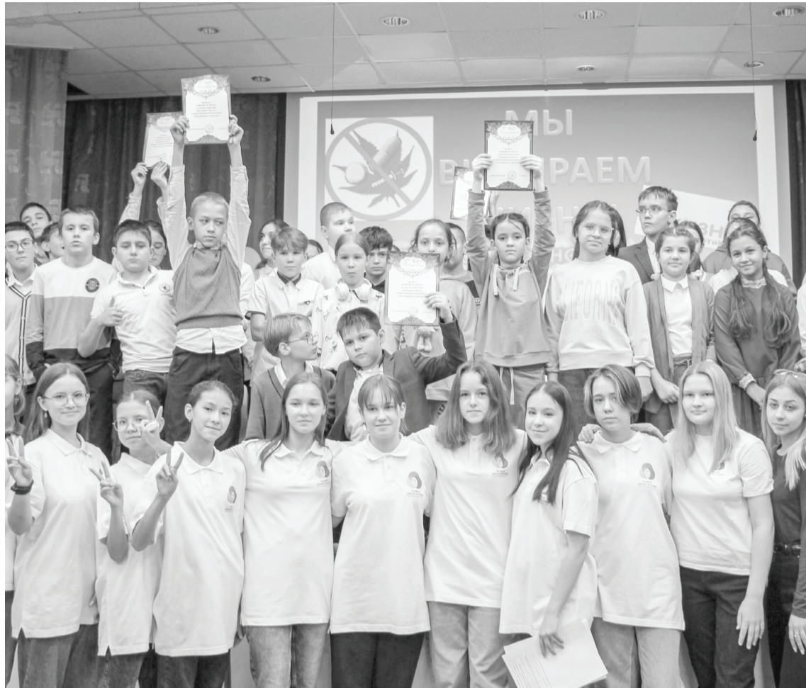
Участники квест-игры сфотографировались на память

Все команды были награждены грамотами. Ребята получили отличный заряд бодрости и море положительных эмоций.