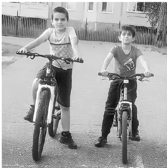
Соревнования по велокроссу проводятся на протяжении всех летних месяцев и собирают большое количество любителей погонять с ветерком

Велокросс — одно из любимых соревнований покачевских мальчишек, и они с радостью принимают в нем участие. Подобные заезды проводятся МАУ СОК «Звездный» регулярно в течение всех летних каникул. 12 августа ребята снова проехали дистанцию и поборолись за звание самого искусного ездока на велосипеде. Победители получили призы.