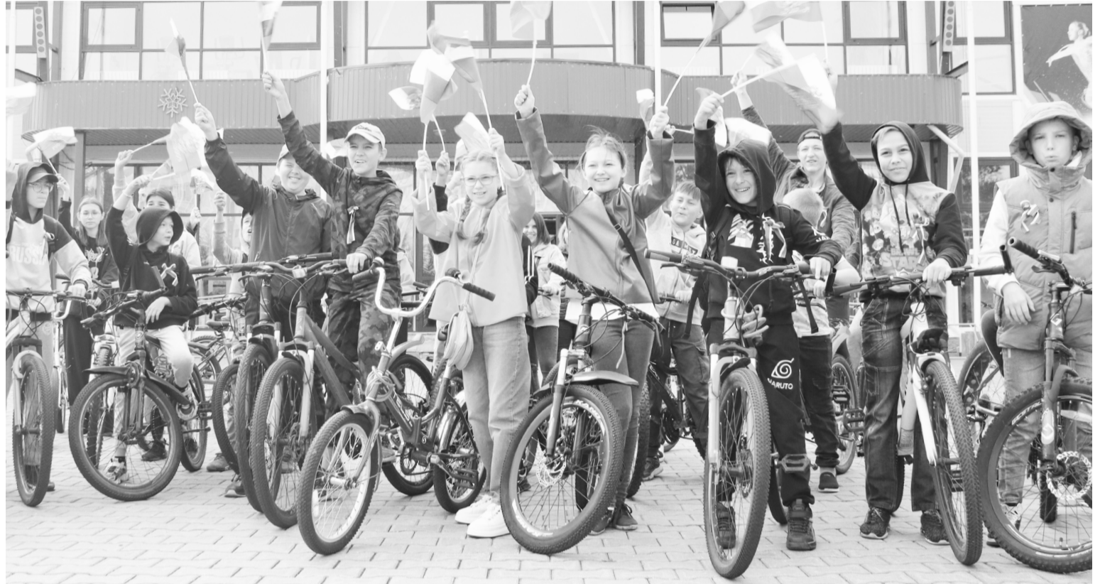
В честь Дня Российского флага участники проехали на велосипедах, держа в руках триколор

Дети и взрослые участвовали в викторинах, играх, отвечали на