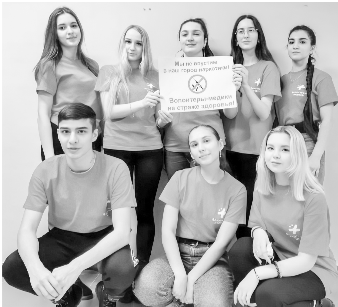
📍 Волонтеры-медики ежегодно принимают участие в городском добровольческом слете

Большая работа проводится покачевскими волонтерами-медиками в учебных заведениях. Профилактика наркомании, наглядная демонстрация посредством брошюр и