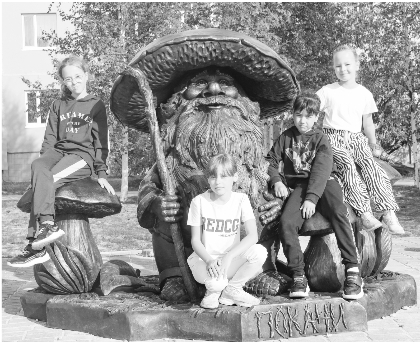
■ Новый арт-объект Старичок-Боровичок украшает сквер «Таежный»

Смотрится новая архитектурная форма позитивно и по-доброму. «Старичок-Боровичок» нравится и взрослым, и детям.