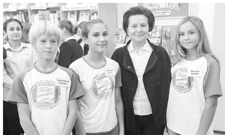
📍 Волонтеры-медики встретились и сфотографировались с губернатором Ханты-Мансийского автономного округа – Югры Натальей Владимировной Комаровой

🗨 Проблема наркомании сегодня может коснуться каждого из нас. Нарастающая напряженность, стрессовые ситуации, неопределенность, нестабильность вызывают у молодого поколения асоциальные формы поведения – употребление наркотическими веществами.