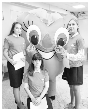
📍 В списке добровольцев много мероприятий, направленных на профилактику разных заболеваний