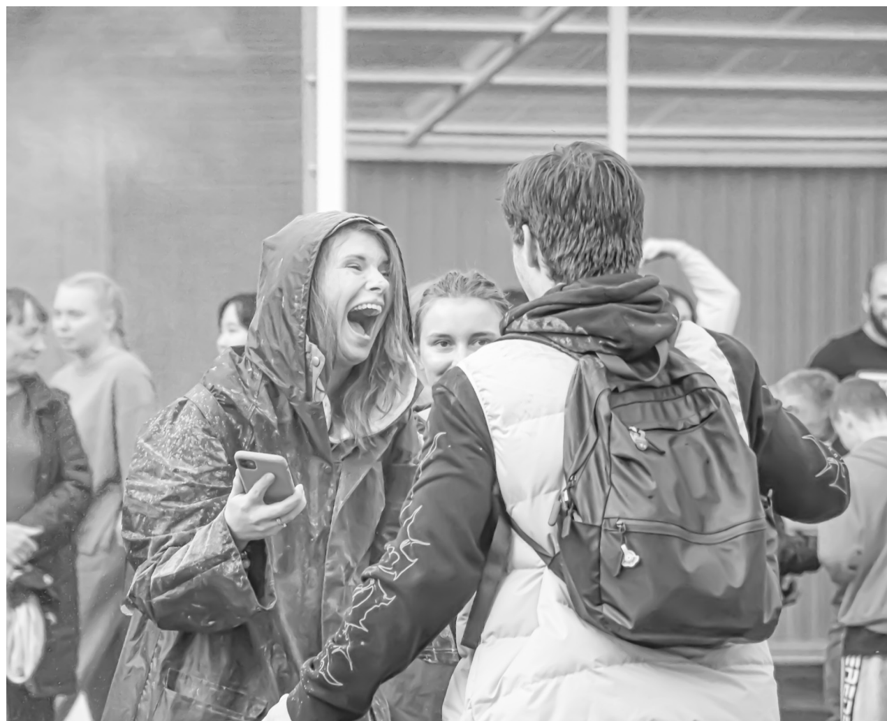
Эмоции на празднике зашкаливали