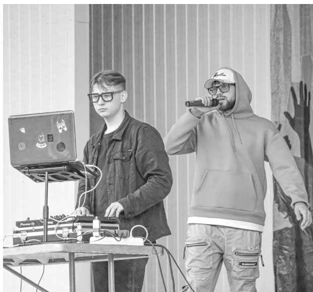
Помимо развлекательных площадок, диджеи и эм-с провели свою программу