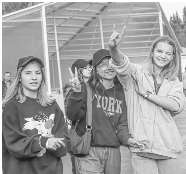
Молодые и задорные

Читайте новости в сетевом издании vgazetepv.ru и в наших группах соцсетей