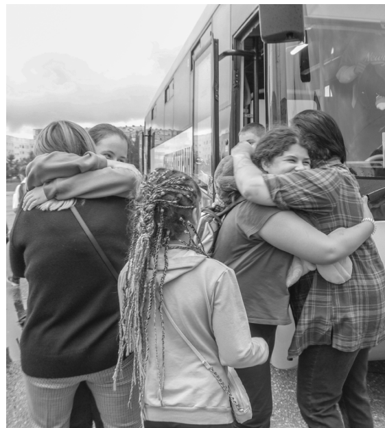
☑ Радостная встреча родителей с детьми, вернувшимися из лагерей Черноморского побережья

Вернувшись в Покачи, дети прошли медицинский фильтр в школьном медкабинете. Все дети здоровые и загорелые, отдохнувшие и набравшие сил.