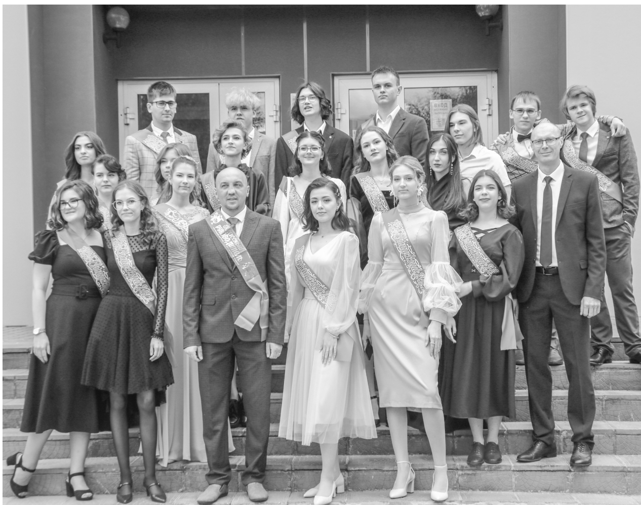
Фото на память с главой города Виктором Таненковым