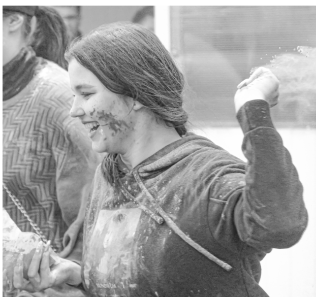
Молодежь вопила, обсыпая друг друга красками холи