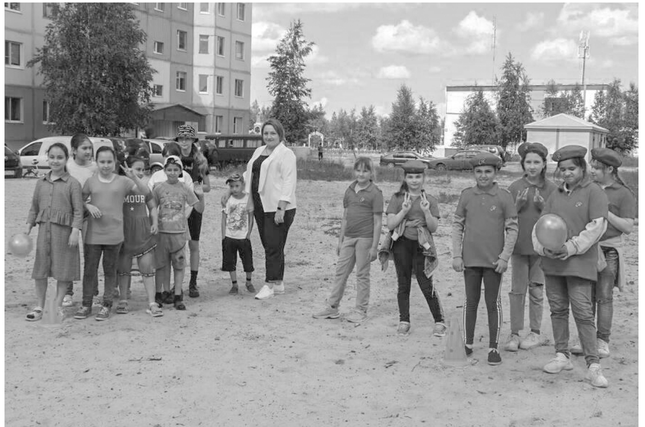
Лагерь «Улыбка» и ТОС «Молодёжный» приняли участие в спортивных состязаниях «Веселые старты»