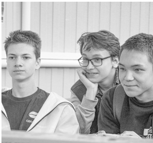
Это же «Супер Марио!»