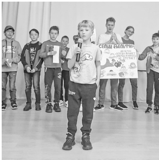
Ребята проявляют себя не только спортивно, но и творчески