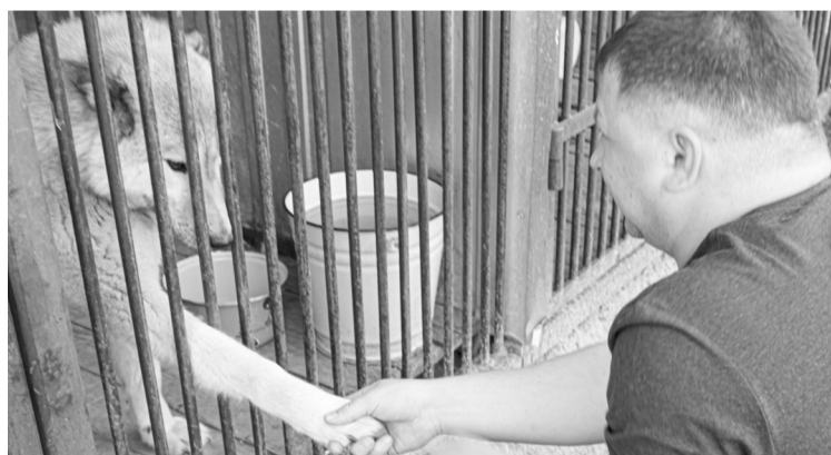
Собака - верный друг человека, нуждается в заботе

Конечно же, не хочется, чтобы собаки и кошки вновь становились бездомными. Работники приюта и волонтеры прикладывают все усилия для того, чтобы для питомцев, к которым уже прикипели душой, найти прежних или новых хозяев. С этой целью активисты АНО «Дай шанс» на своей странице в социальной сети