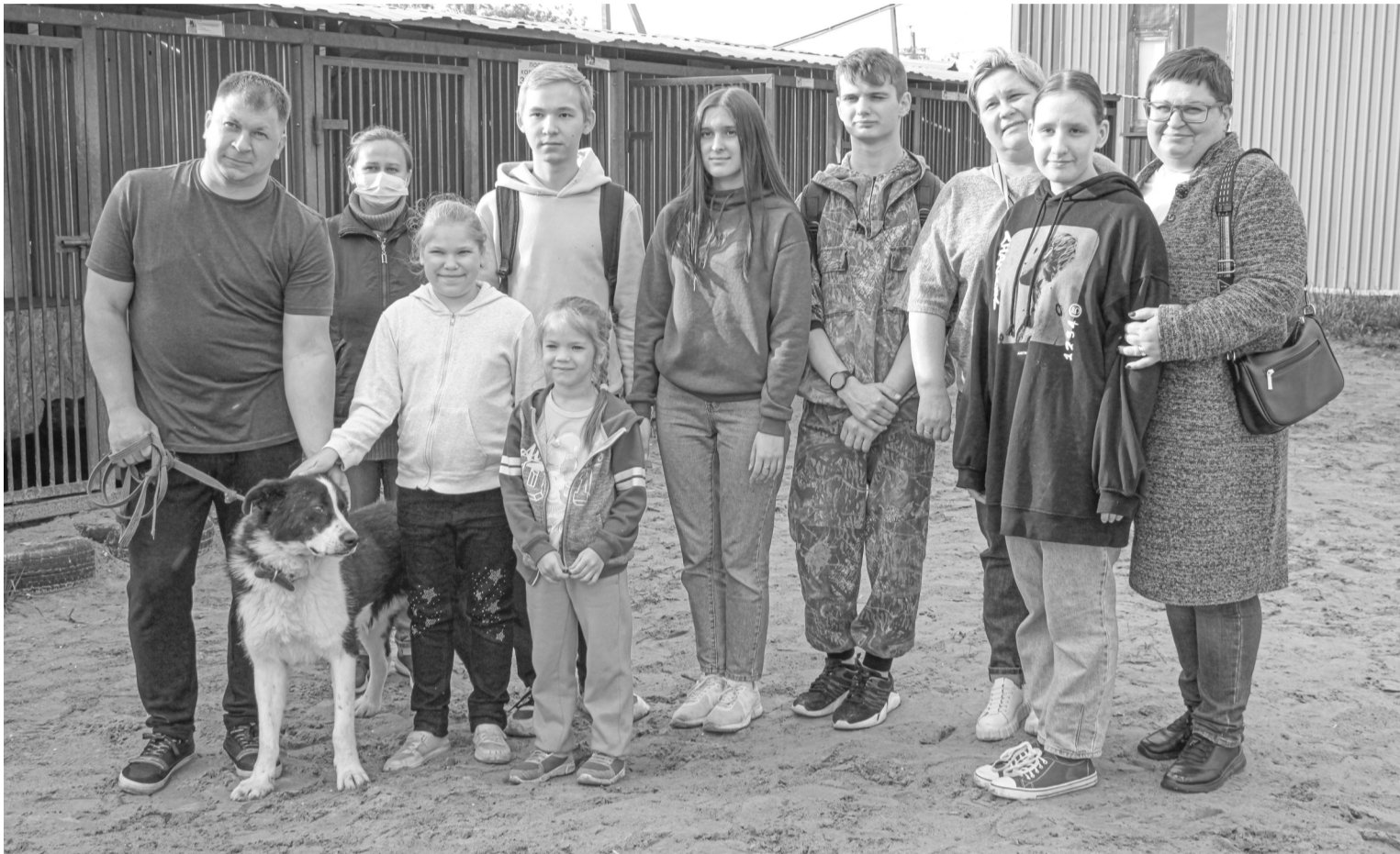
Активисты АНО «Дай шанс» провели акцию «День открытых дверей в приюте для бездомных животных»

В городе Покачи активисты автономной некоммерческой организации «Дай шанс» провели День открытых дверей в приюте для бездомных животных