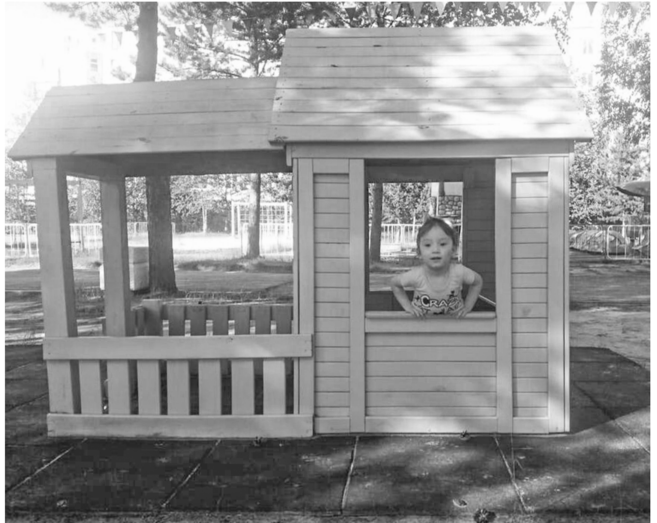
Для малышей в парке предусмотрены: игровая конструкция в виде домика, невысокие горки, качели и песочницы