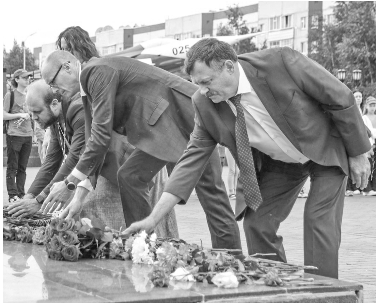
📷 Возложение цветов к Вечному огню

Местный политический совет Всероссийской политической партии «ЕДИНАЯ РОССИЯ» города Покачи