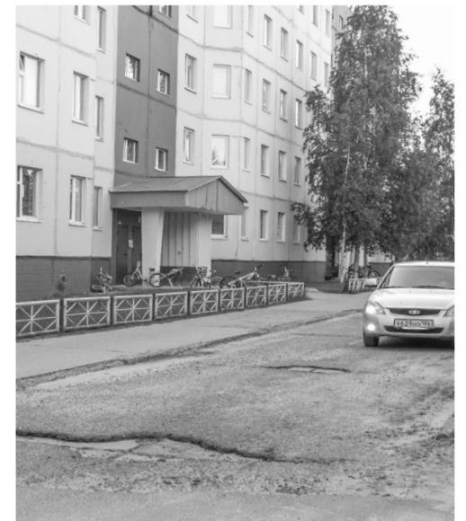
Дорожное покрытие во дворе дома Молодежная, 7