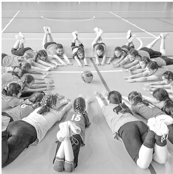
Утренняя разминка

Не забывают ребята про спортивные мероприятия: тренировки, зарядки, спартакиаду – все это в ежедневном распорядке «Олимпийца». Силу и энергию воспитанники спортивного лагеря набирают благодаря двухразовому питанию, прогулкам и играм на свежем воздухе. После такого плодотворного отдыха дети становятся бодрыми и веселыми, а лучшее подтверждение сказанному – румянец на лице и сияющая улыбка ребенка.