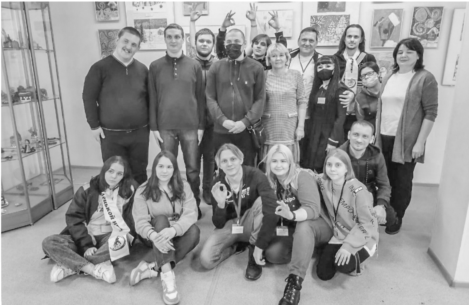
Теплая встреча коллектива АНО «Центр семейного устройства «Счастье в детях» с участниками Когалымской федерации инвалидного спорта и волонтерского корпуса «ДОБРО БРО»

У Центра семейного устройства «Счастье в детях» из города Покачи есть друзья - Когалымская городская федерация инвалидного спорта и волонтерский корпус «ДОБРО БРО». Они познакомились не так давно, в 2020 году, но их дружба уже приносит позитивный результат