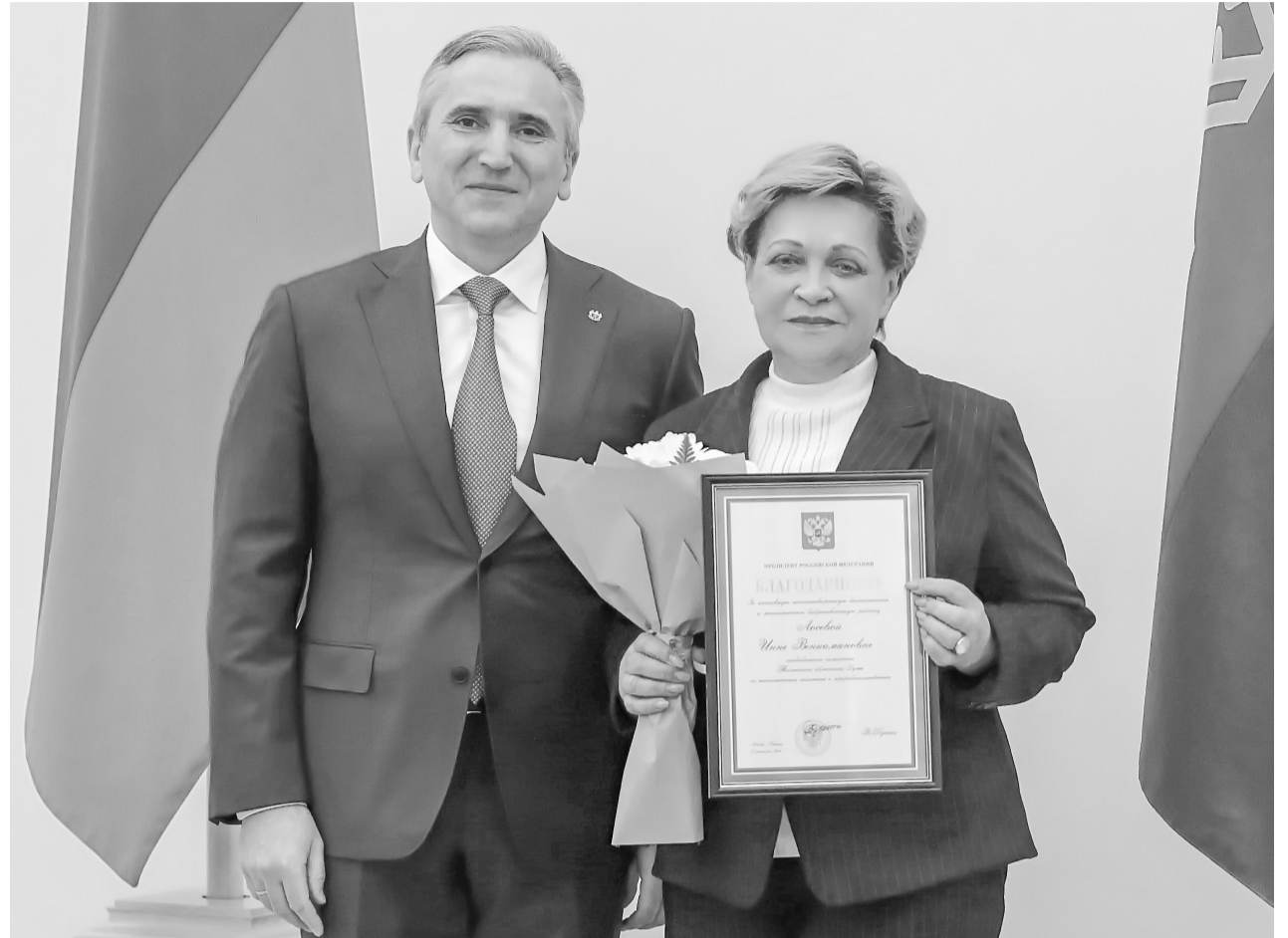
Награду в торжественной обстановке вручил губернатор Тюменской области Александр Моор