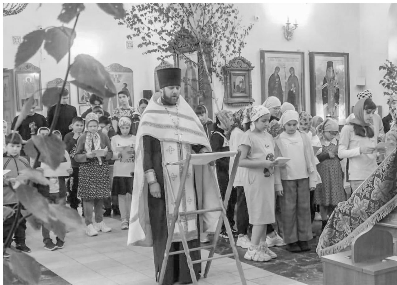
Воспитанники детского лагеря «Неофит» принимают участие в служении молебна в храме в честь Покрова Божией Матери