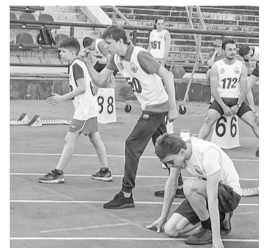
Покачевские спортсмены завоевали призовые места