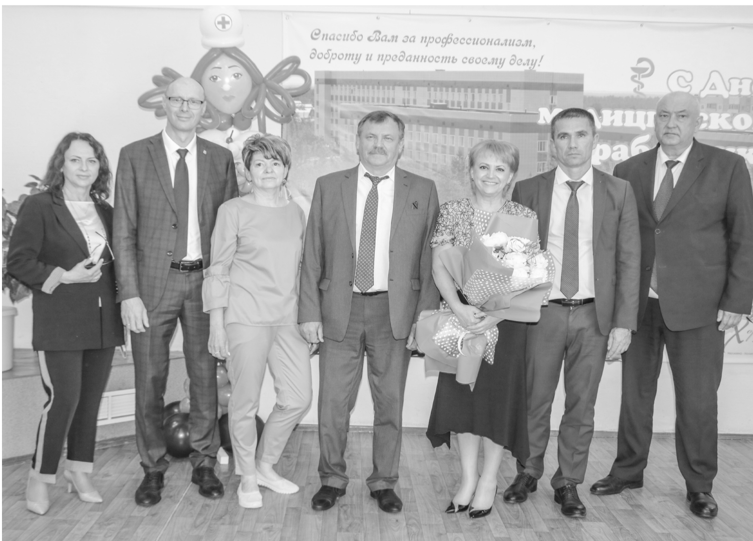
Покачевские работники здравоохранения приняли поздравления в честь своего профессионального праздника

В адрес медицинских работников прозвучали слова благодарности за бесценный труд и квалифицированную помощь населению, которая бескорыстно оказывается на протяжении многих лет. Благодаря медицинским работникам в Покачах удалось противостоять коварному ковиду, достичь