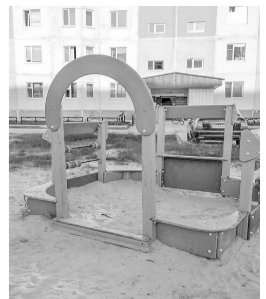
Игровая площадка во дворе Мира, 8