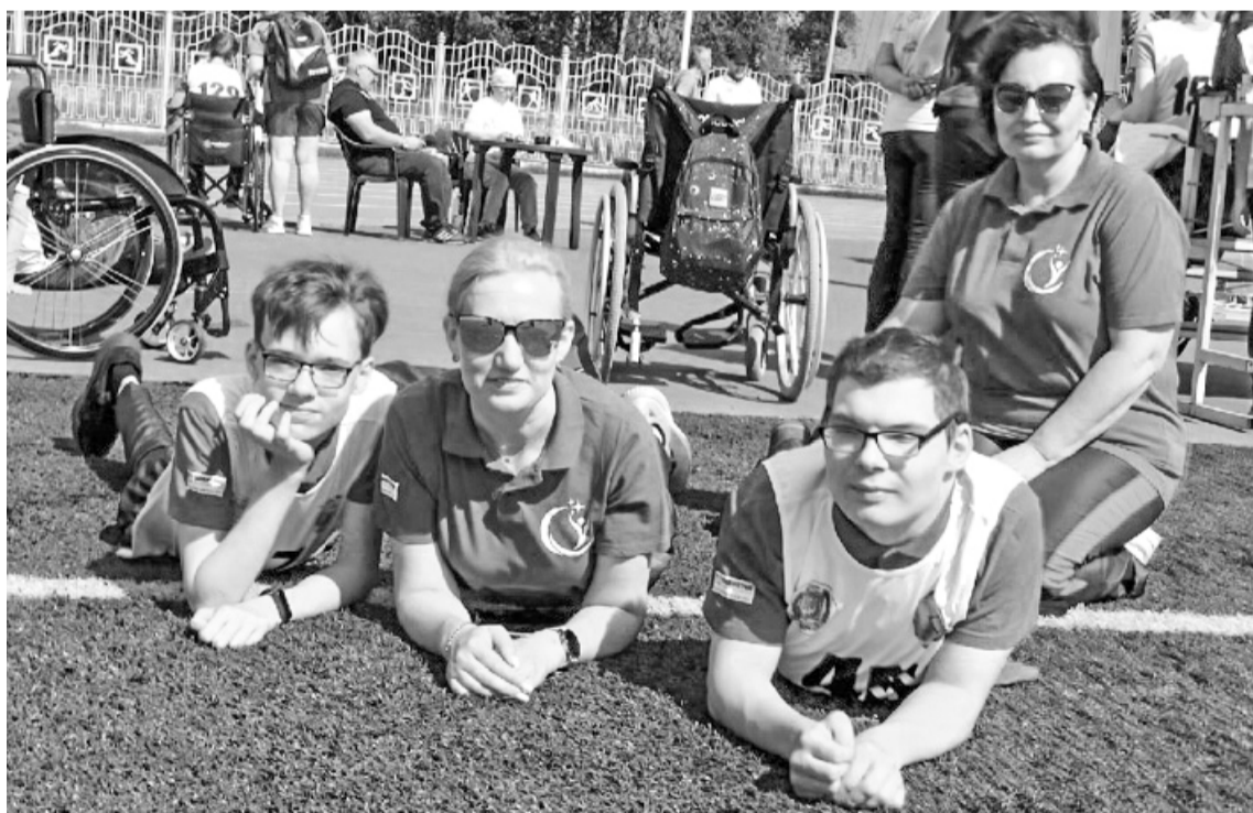
Участники покачевской команды поехали на соревнования, как всегда, дружно и с хорошим настроением

Участники покачевской команды поехали на соревнования, как всегда, дружно и с хорошим настроением. По итогам спортивных состязаний покачевские спортсмены добились