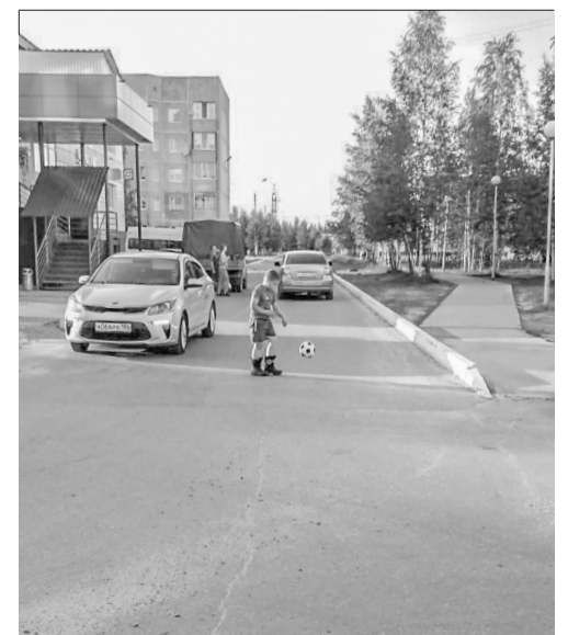
Дорога вдоль школы № 4