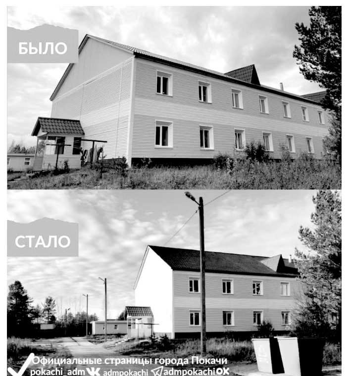
Официальные страницы города Покачи pokachi_adm vk admpokachi admpokachi OK

Напомним, из-за строительства нового дома на соседнем участке осуществлять вход в помещение пришлось через запасной выход, который расположен с обратной стороны здания. К нему проложили тротуарные плиты от подъезда до Бакинской, 9, установили три дополнительных опоры освещения и поставили новые мусорные баки. Работы по благоустройству территории Бакинской, 11 завершены. Проблема решена.