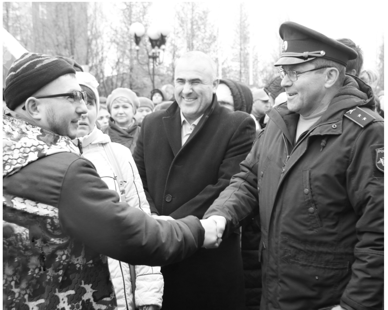
📷 Провожающие сфотографировались с парнями на память, обменялись крепкими объятиями и рукопожатиями, конечно же, пожелали нашим защитникам вернуться домой как можно скорее