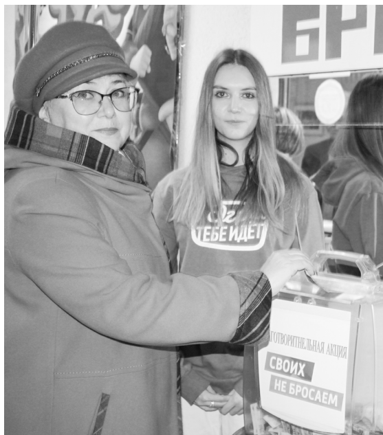
📷 Мобилизованным покачевцам будут направлены средства, собранные на благотворительном концерте

🗨 Апофеозом концерта стал хореографический номер с российскими флагами и буквой «Z», символизирующей главные лозунги нашего времени: «За Россию! За Победу! За Президента!». Сплотившись, мы обязательно победим! Потому что НАШЕ ДЕЛО ПРАВОЕ!