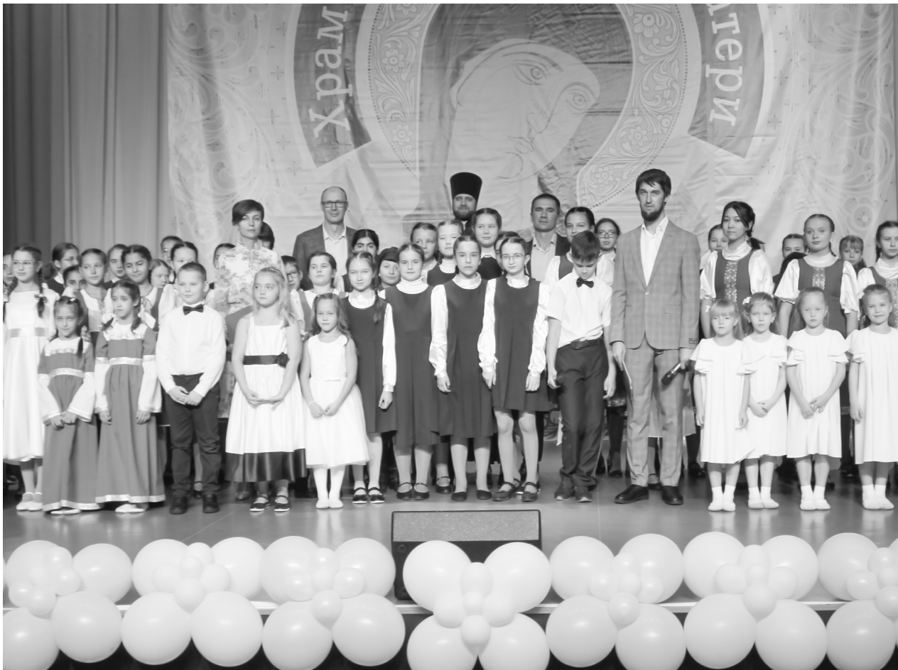
Фотография на память о Престольном празднике

Читайте новости в сетевом издании vgazetepv.ru и в наших группах соцсетей