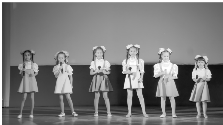
Зрителей порадовали выступлением творческих номеров

После городского церемониала все муниципалитеты округа присо-