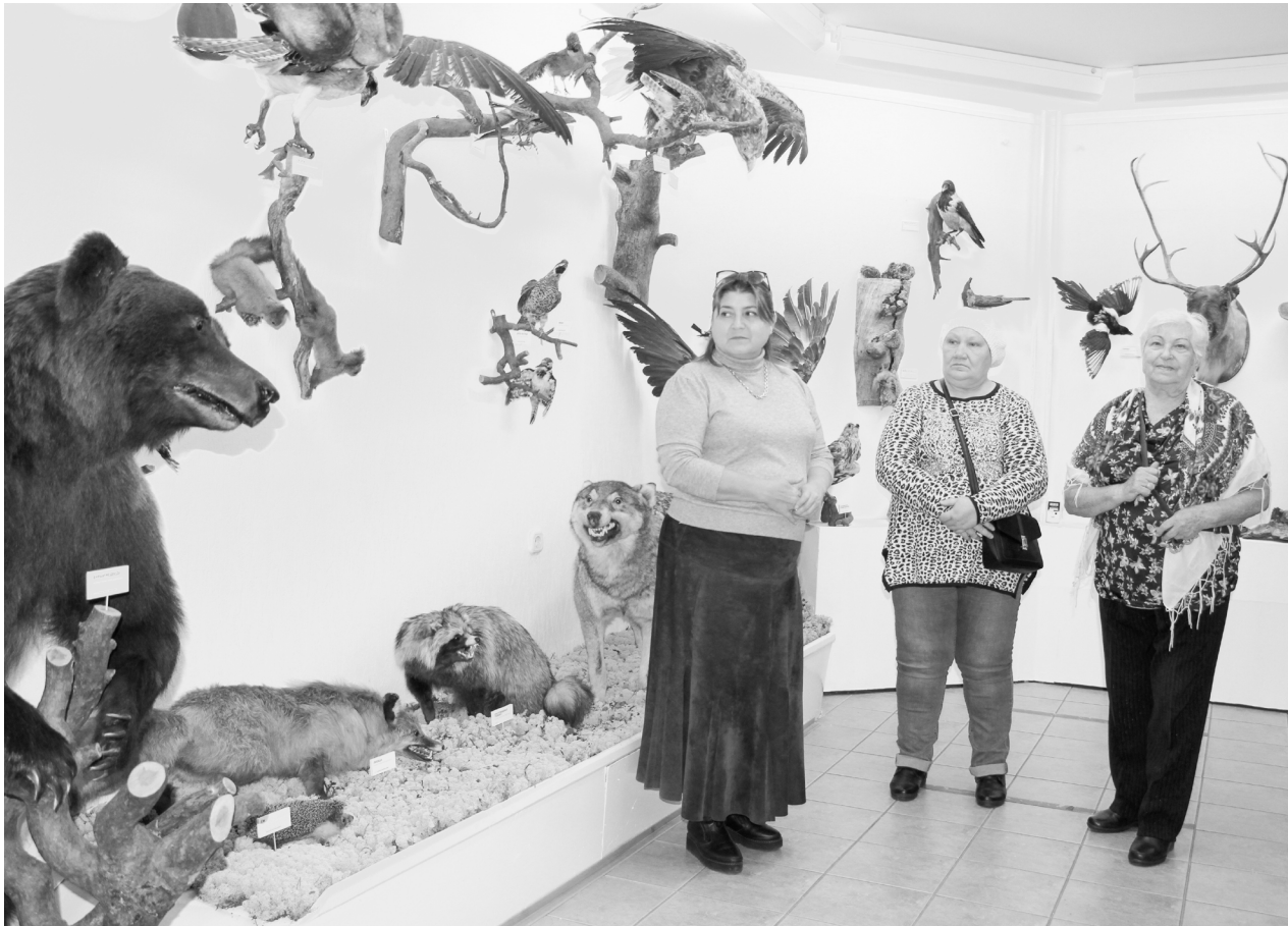
Посетители выставки узнали о том, как отличить болотных птиц от лесных, о разновидностях оленей и много чего нового