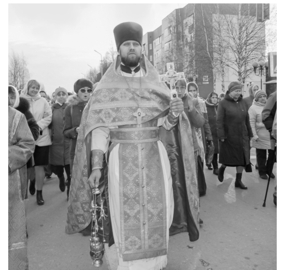
Прихожане совершили Крестный ход по улицам города

Мероприятие прошло на высоком духовном подъеме. Лица прихожан сияли лучезарным светом.