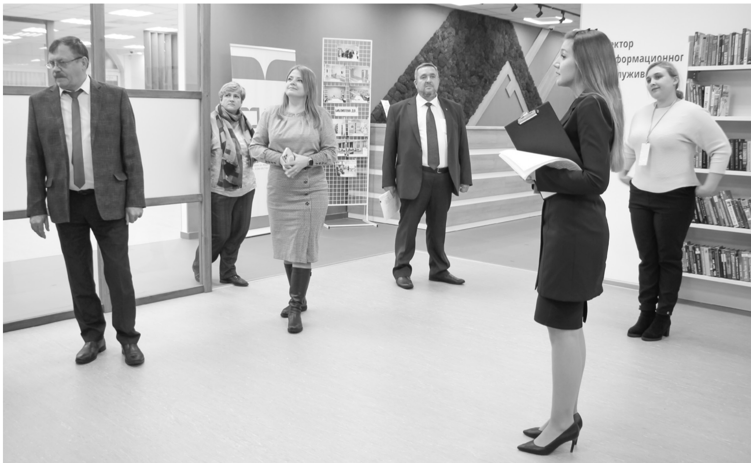
Библиотека превратилась в особое пространство. 8 ноября единороссы пришли посмотреть, как работают сотрудники библиотеки в новых условиях и каков эффект от модернизации

Официальное открытие обновленной библиотеки после масштабного ремонта состоялось 9 сентября 2022 года, и вот 8 ноября покачевские единороссы пришли с контрольным визитом