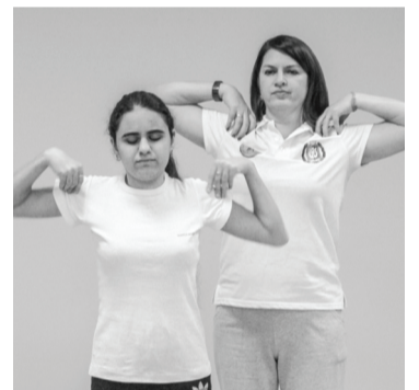
Участники мастер-класса по занятию адаптивной физкультурой