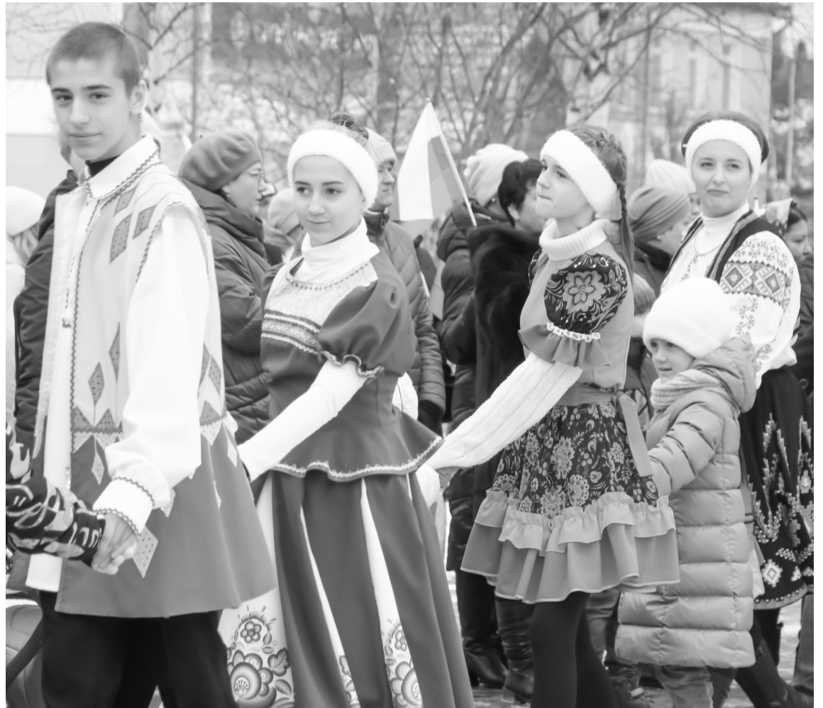
На площади ДК «Октябрь» собрались жители города, чтобы вместе отметить праздник

В знак проявления доверия и уважения друг к другу пока-