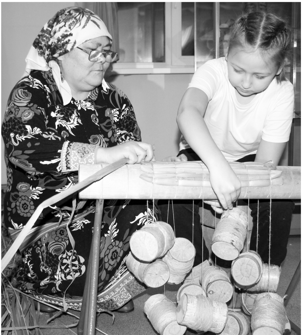
Провести ночь, соприкоснувшись с искусством, приходили люди разных возрастов, парами, семьями, компаниями

«Ночь искусств» с проведением мастер-классов в различных видах творчества сплотила разные поколения покачевцев.