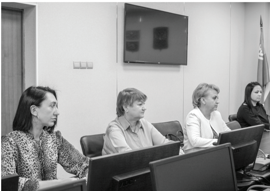
На заседании было отмечено, как важно сейчас всем объединиться, чтобы защитники Отечества чувствовали нашу поддержку

Активистами города Покачи создано Общество поддержки мобилизованных, контрактников, добровольцев и их семей