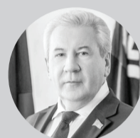
Борис ХОХРЯКОВ, председатель Думы Югры

«Отчет и послание Губернатора позволяют говорить о том, что Югра развивается, движется в правильном направлении. Сегодня мы переживаем сложнейшие времена: боевые действия в Донбассе, подпитываемые Западом, беспрецедентное и несправедливое санкционное и экономическое давление. Югра справляется с этим достойно, оставаясь в числе регионов-лидеров. Основные задачи сформулированы: забота о здоровье и социальном благополучии граждан, развитие человеческого капитала, прежде всего поддержка молодежи. Достаточное внимание уделяется задачам интеллектуальной экономики, рационального недропользования, комплексного развития территорий».