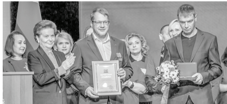
Наталья Комарова вручила государственные награды общественникам, волонтерам, медработникам

– В поддержку инициатив десятков тысяч югорчан, с уважением к ним предлагаю объявить 2023 год в Югре Годом взаимопомощи для каждого из нас, кто делает мир лучше, неравнодушен к ближним, помогает потому, что не может иначе. Спасибо за внимание.