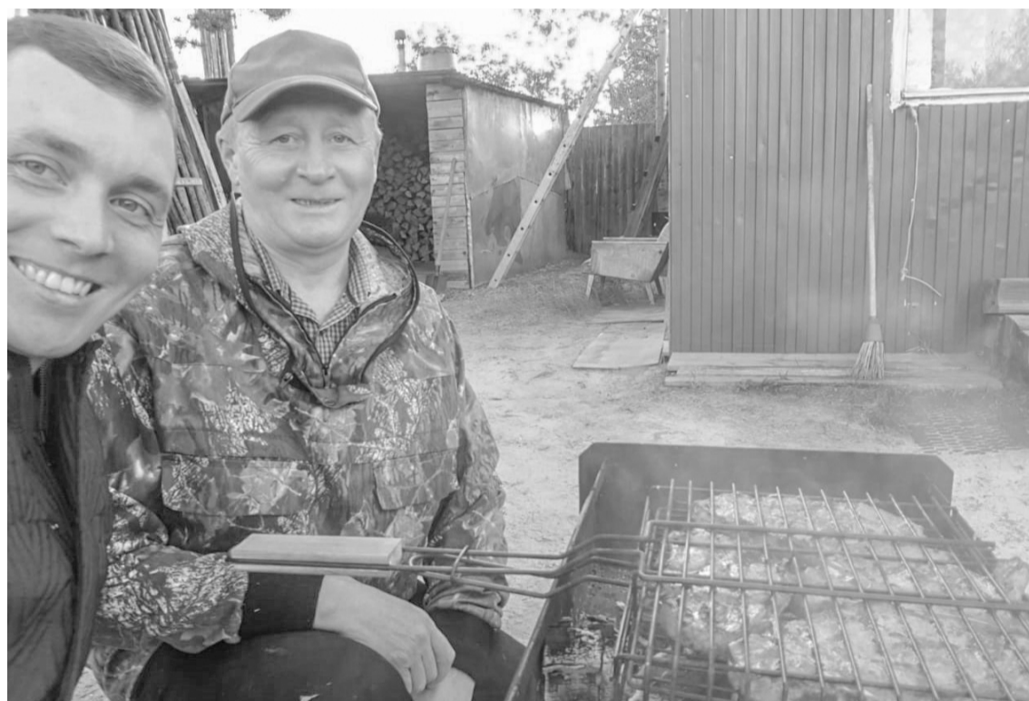
Совместный труд и отдых на даче - семейная традиция