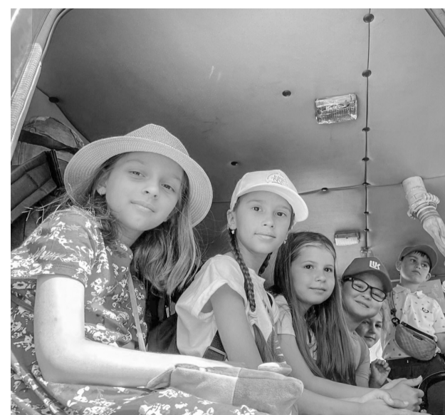
Экскурсия в пожарную часть