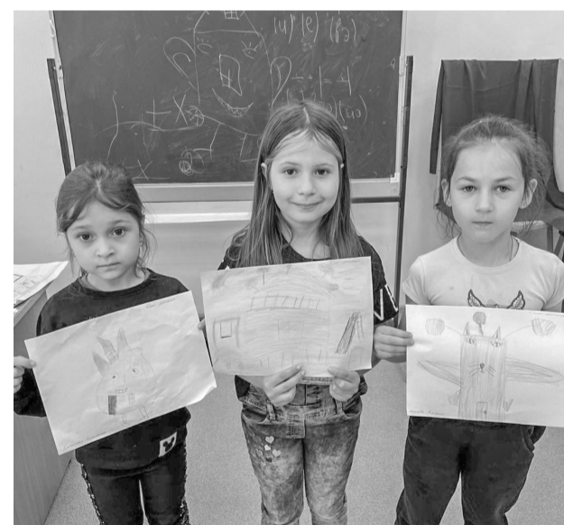
Творческая смена в «Камертоне»