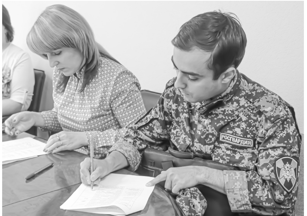
Комиссия провела приемку лагерей второй смены