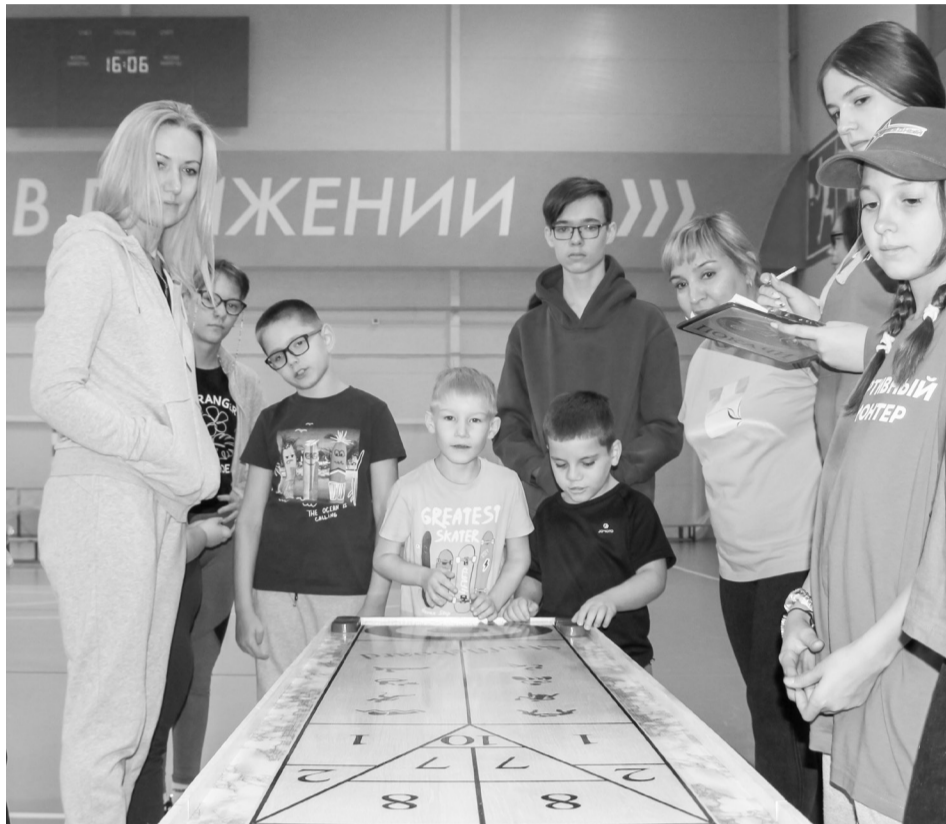
Ребята играли в шаффлборд и корнхолл

Спортивный праздник «Преодолей себя» прошел в минувшие выходные в физкультурно-спортивном комплексе «Сибиряк»