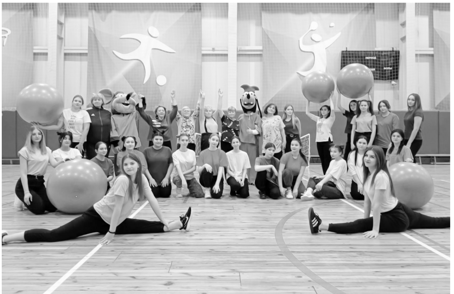
📷 В кругу стройных девушек, которые подготовили специальную программу, обаятельные пенсионерки зарядились молодостью и оптимизмом

Уже сама атмосфера спортивного зала придаёт бодрость, энергичность и поднимает настроение. А в кругу стройных, красивых девушек, которые подготовили специальную программу с песнями, спортивными танцами и подвижными играми, наши обаятельные и очень общительные пенсионерки за-