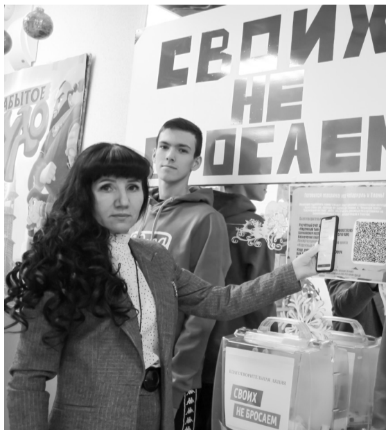
Во время концерта можно было пожертвовать деньги в бокс или перечислить по QR-коду на благотворительный счет для поддержки мобилизованных, контрактников и добровольцев