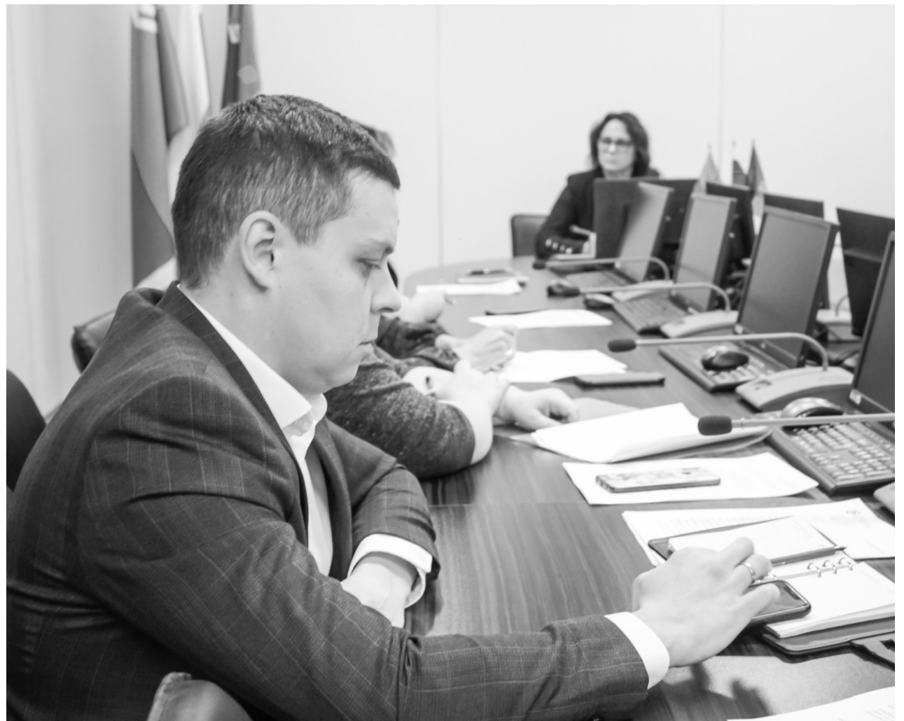
Обсуждение по вопросу исполнения заявок по запросам мобилизованных покачевцев и их семей