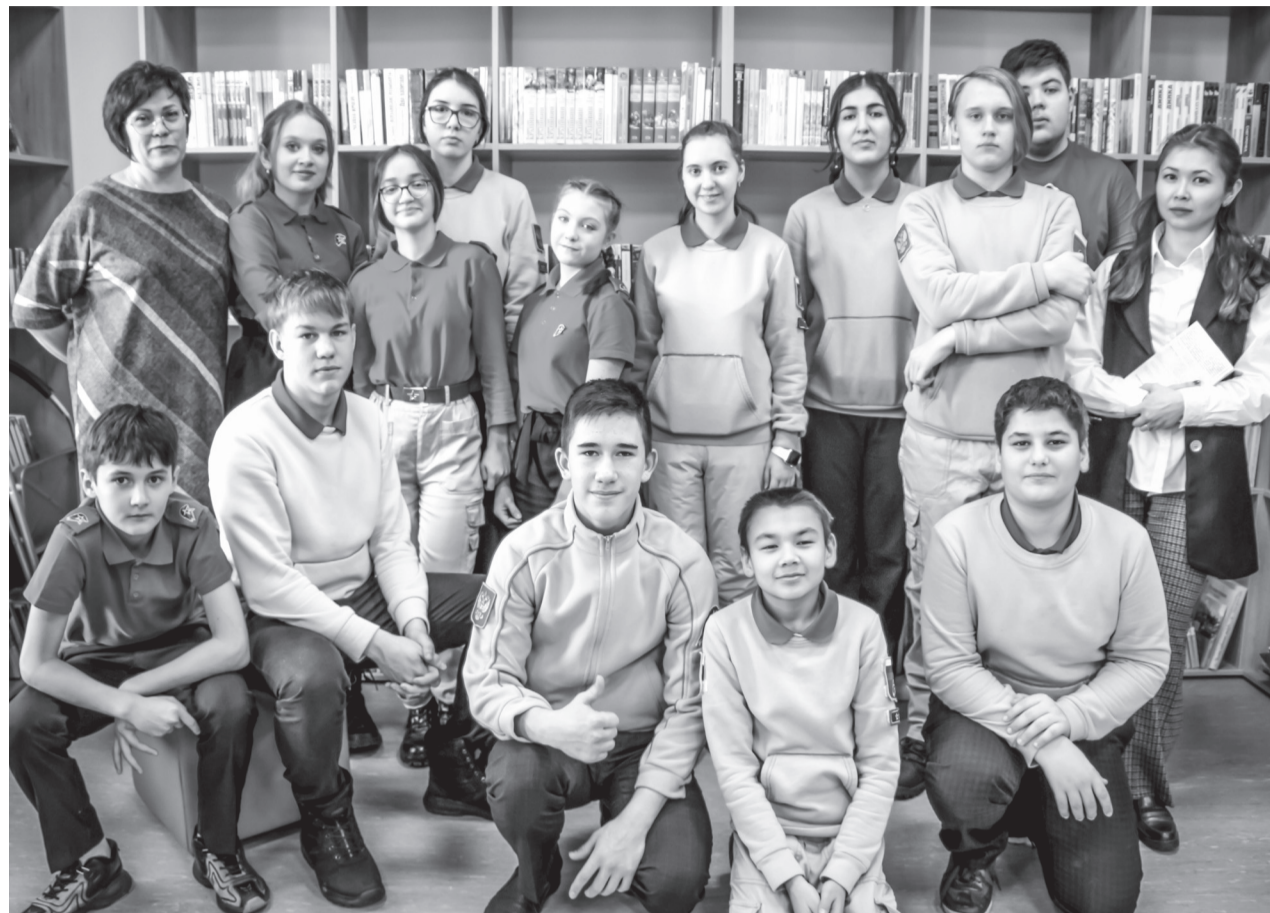
Участники акции в городской библиотеке имени А. А. Филатова прошли тест по истории Великой Отечественной войны / ФОТО АВТОРА

Лучшие работы будут размещены на виртуальной выставке рисунков, которую смогут посмотреть все желающие, зайдя на сайт МАУДО «Детская школа искусств» / ФОТО АВТОРА