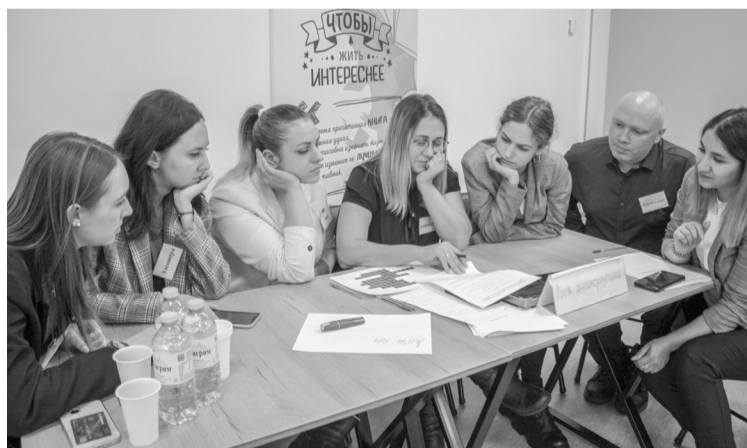
Участники деловой игры разгадывают кроссворд