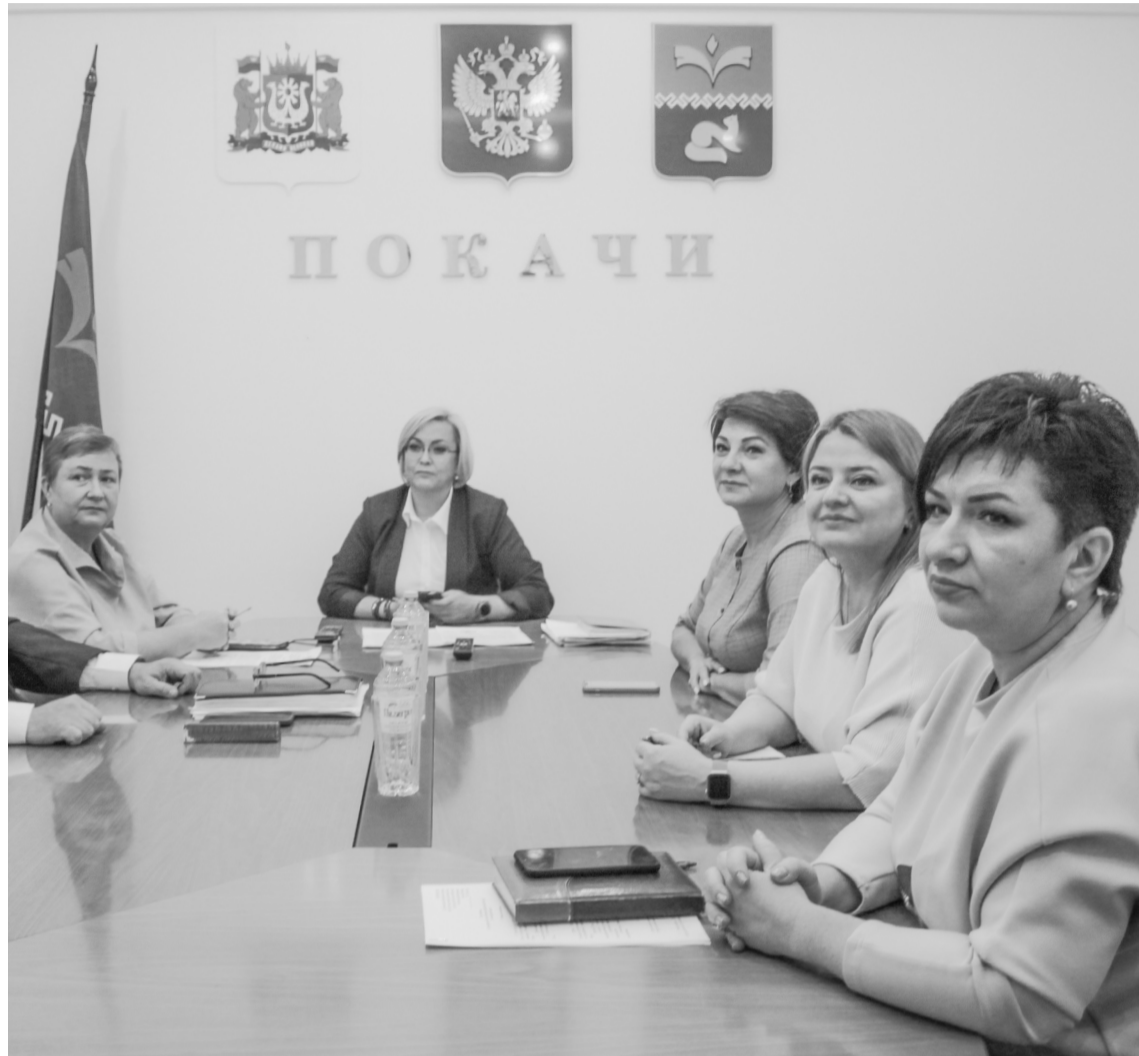
Город Покачи принял участие в прямой линии губернатора Югры

Телефон для справок: 8 (34669) 56020 (доб. 210).