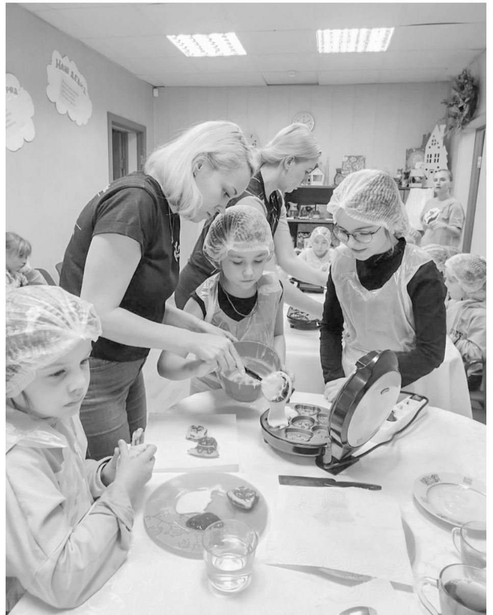
■ Дети с большим интересом принимали участие в творческих мастер-классах

«Мой ребенок каждый день приходил из лагеря радостный и вдохновленный»;