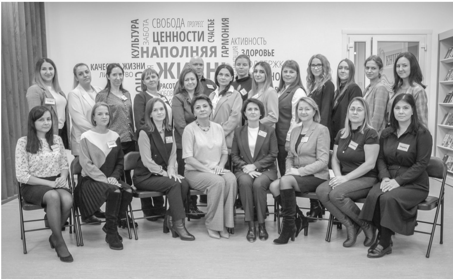
Фото на память о тематической деловой игре «Коррупция и борьба с ней»

В Покачах внедряют новые формы антикоррупционной деятельности